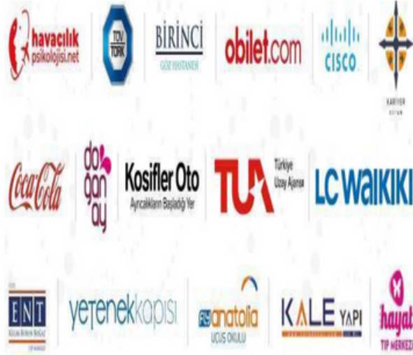
Tablo 5. Sürdürülebilir Kalkınma Amaçları Doğrultusunda 2023 Yılında Kurulan İş Birlikleri