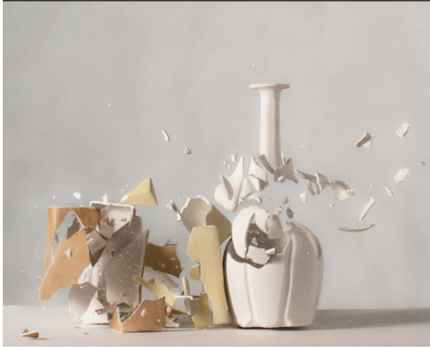
Şekil 3 Ori Gerscht, Ever Time 01 , 2018

Yukarıdaki örnekler doğanın kendi süregidenliğinin dışında, ona müdahale ederek ve ondan parçalar alınarak insan tarafından yapılandırılan nesnelere vurgu yapmaktadır. İnsani ürünler doğaya hâkim olma anlayışının başka bir ifadesi olsa da, kaçınılan ölüm ve yıkımın el yapımı bir