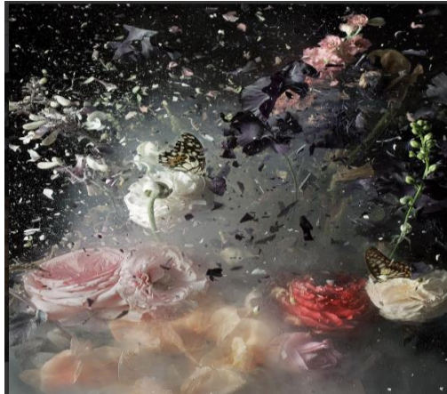
Şekil 3 Ori Gerscht, 'Fields and Vision', 2022

Gersht... meyvelerle oluşturduğu kurguları patlatma eylemlerini, yıkım anının aynı zamanda da yaratıcılığın gerçekleştiği an olduğunu ortaya koymak üzere gerçekleştirmiştir... Sanatçı içinde bulunduğu toplumsal koşulların yarattığı etkileri ve içsel dinamikleri, sanat eserlerine aktararak, yeni sanat anlayışlarının doğmasına kaynaklık ederken, eski görüşleri de yıkıma uğratmıştır. Sanatçı, hayatın bir parçası olmasına bağlı olarak ondan etkilenirken, onu da etkisi altına alarak dönüştürmüştür (İlhan, 2020, s. 34).