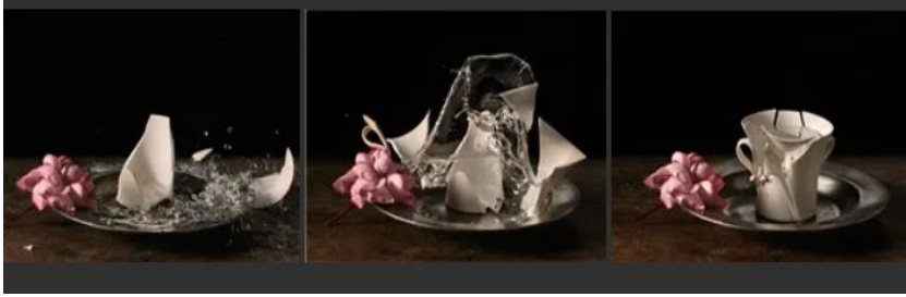
Şekil 2 Ori Gerscht, New Orders 01 , Talley Dunn Gallery, 2018

Meyve ve sebzelerle yapılan kompozisyonlara çiçeklerin eşlik ettiği görülmektedir. Bu örneklerle oldukça ilgi çekicidir. Zira bu yapılanmalar doğal nesnelere üzerine şekillenmekte ve bu bağlamda doğanın insanın dışında kalan yönlerinde de yıkım ve bozulmanın olduğuna işaret etmektedir. Mesiyani kırılma ve şiddet, Benjaminci bağlamda insan eliyle bir yıkım getirmekte olsa bile aslında yıkım ve şiddet doğanın kendisinde de hâkim olan bir form olarak yükselmektedir. Gerscht yalnızca doğa tasvirleriyle yetinmeyerek insan yapımı olan nesnelere de çalışmalarına dâhil etmektedir.