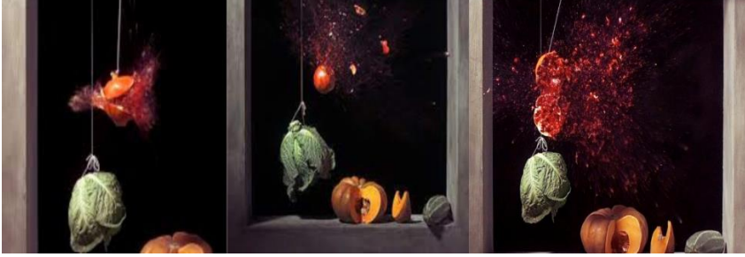
Şekil 1 Ori Gerscht, 'Tasavvur edilemeyecek hızda yıkım', Nar: Denge Yiti-mi, 2006

Çocuksuluk yaratırken yok etmeyi, formları başkalaştırmayı temellendirirken, toplumsal anlamda başkalaşmayı ve yasanın barbarı olmayı getirmektedir. Akla gelmeyen, görülemeyeni hatta umulmayanı mevcut hale getiren iki yıkıcı unsur bu anlamda birleşmektedir.