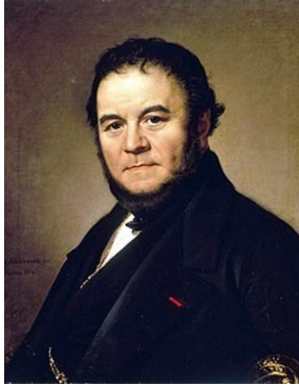
Resim: 1 Stedhal

Kırmızı ve Siyah ( Le Rouge et le Noir ) ın, 1830 tarihinde ilk baskısı yapılır, Türkçeye Kızıl ile Kara adıyla da çevrilmiştir.