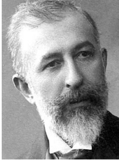
Resim 3: Halit Ziya (Uşaklıgil)

Halit Ziya'nın Servet-i Fünûn döneminde yazdığı Mai ve Siyah romanı adeta bu devrin bir beyannâmesi gibidir.