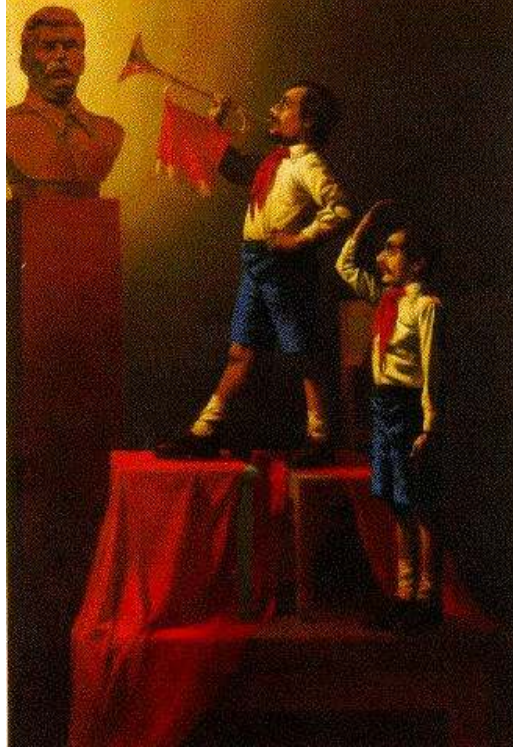
Fig. 7 Vitaly Komar ve Aleksandr Melamid, "Genç Öncüler olarak Çift Otoportre", 182 x 127 cm, Tuval üzerine yağlı boya, 1982-83, Martin Sklahttp'in koleksiyonu

Eserlerini kolektif üreten Vitaly Komar ve Alexander Melamid adlı iki Rus, ülkelerinde iken genç birer muhalif, ülke dışına kaçtıklarında ise Postmodernizm'in neredeyse sözcüsü haline gelmiş iki ilginç sanatçıdır. İki sanatçı çalışmalarına, 1965 yılında batılı Pop Art'ın Sovyet versiyonunu uygulayarak başlamışlardır. Bundan sonra birçok uluslararası sergi yapmış, 1978'den itibaren ABD'de yaşamaya başlamışlardır. Sovyet Rusya'dayken, rejime muhalif olan sanatçılar, sosyalist realizmi dönüştürdükleri form yüzünden "Çileden çıkaran muhalifler" olarak anılmışlardır. Bu yönde çalışan ikili, 1972'den beri tek bir kişiymiş gibi üretim yapmıştır. Eserlerinin içerik zenginliği ve özgünlüğü, iki yaratıcı beynin katkısını yansıtır.