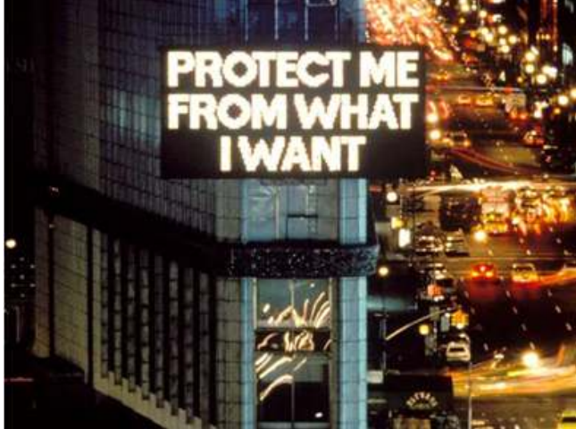
Fig. 4 Jenny Holzer" Beni istediğim şeyden koru", Renkli elektronik işaret, Times Meydanı, New York, 1985.