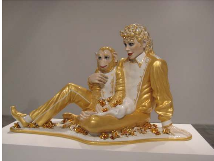
Fig. 2 Jeff Koons, "Michael Jackson ve Bubbles"

Neo Pop, adeta Pop Art'ın gözden geçirilmiş bir şeklidir; bugünkü simge ve sembolleri ile popüler kültürde yerini almıştır. Neo Pop'ta; tanınan nesnelere, kişiler ile yeniden bir doğuş vardır. Neo Pop, Batı kültüründeki değerleri, ilişkileri ve etkileşimleri eleştirmek, değerlendirmek eğilimindedir ve açıkça provokatif, tartışmalı fikirlere kucak açar. Jeff Koons'un altta yer alan eseri akımın ilk önemli örneklerindedir.