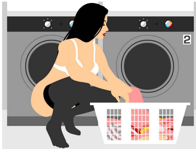
Fig. 12 Peter Stanick, "Çamaşırhane", 91 x 122 x 10 cm, Tuval üzerine mürekkep, 2010.