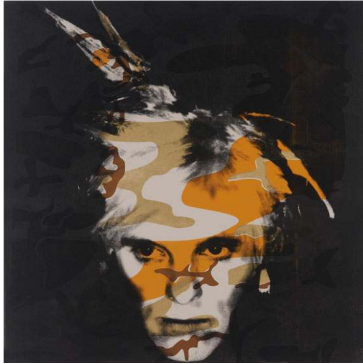
Fig. 8 GavinTurk, “Altın ve Boz Kahverenkli Korku Kamufraj Peruğu” 100 x 100 cm, Tuval üzerine akrilik ve üzeri ipek mürekkep, 2007

Sanatçıların Rus neo-akademizmi ve tüketici Pop sanatının arasındaki yeni tarzlarının, edebi, açık ve anlamsal olarak da milliyetçi özellik gösterdiği görülmektedir. Tarihsel resim, popülizm, edebiyatla ilgili doğruluk ve kritik ironi gibi bir karışımla özgün çalışmalar ortaya koymuşlardır.