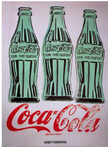
Fig. 1 Andy Warhol, "3 Kola Şişesi", 1962.

Pop Art sanatçıları için popüler kültür ürünleri vazgeçilmezdir. Televizyon, radyo, gazete, dergi gibi kitle iletişim araçları, başka hiçbir sanat akımında görülmemiş bir şekilde, Pop Art hareketinin malzemesi olmuştur. Akım, 1960'larda pek çok kişiyi şaşırtarak dünya çapında olağanüstü bir ilgi uyandırmıştır (B.A.Dellenbach,2009:41). Pop Art akımının en önemli temsilcilerinden kabul edilen Andy Warhol, sanat işlerinden daha çok günlük konuları ve objeleri ele almıştır. Warhol, Amerikan tüketim kültüründe var olan; Coca-Cola, bluejean, fimlerdeki süperstarlar, aşk, para, şöhret, seks, şekerlemeler, dönemin TV showları gibi güncel konularla ilgilenmiştir.