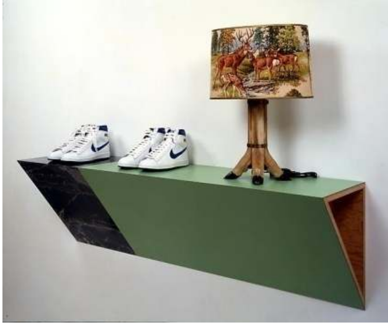
Fig. 6 Haim Steinbach, "Geleneğin Cazibesi" 96x 147 x 38cm, plastik laminasyonlu ahşap raf; pamuk, kauçuk, naylon ve deri spor ayakkabıları; polyester, plastik, metal ve geyik ayaklı lamba, 1985.

Haim Steinbach, nesne temelli bir üretime yönelen ve tüketim nesnelere sanat nesnesi statüsüne yükselten sanatçılar arasındadır. Steinbach, 'alışveriş'i bir performans biçimi olarak kullanmış ve satın aldığı nesnelere kendi tasarladığı vitrinlerde sergileyerek, bu kez sanat nesnesi olarak yeniden satışa sunmuştur. O, sanatı, "Tüketim Nesnesi Sanatı" olarak nitelendirilen sanatçılar arasındadır (Antmen,2010:290-291). Steinbach'ın üstte yer alan örnekte görüldüğü gibi formika kaplı rafları ilgi çekicidir. Raflar, bir mağazadan satın alınmış nesnelere taşımaktadır. Bu nesnelere, muntazam düzenlemeler şeklinde sergilenmektedir. Sıkı bir şekilde monte edilen raflar, adeta maddi eşyalara olan tutkumuzu ve onları nasıl kimliğimizin ayrılmaz bir parçası yaptığımızı yorumlamaktadır.