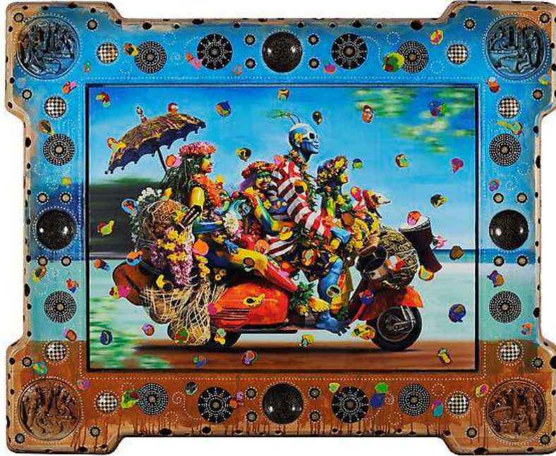
Fig. 10 Ashley Bickerton, "Skuter", 183 x 244 x 20 cm Tuval üzerine karışık teknik, 2008.