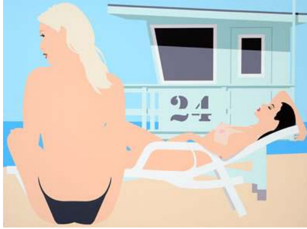
Fig. 11 Peter Stanick, "Katılımcılar (Subscribers)", 99cm x 132 cm, Tuval üzerine akrilik, 2006.

Ashley Bickerton 1993 yılında, New York'tan Endonezya'nın Bali adasına taşındı. Bu andan itibaren sanatı ve yapıtları buldukları mekândan etkilenmeye başladı. İlk dönem eserleri çoğunlukla kurumsal logolar, kullandığı ve dönemin tüketici kültürüne atıfta bulunan yüksek teknoloji kullanarak ürettiği heykellerdi: sanatçının kendi tanımıyla "meta heykeller". Fotoğraf, karışık teknik ve resim alanlarını harmanlayarak ürettiği işleriyle "Batılı olan" ve "Batılı olmayan" kavramlarını irdeleyen sanatçı, geleneksel biçimleri ve çağdaş sanatı, gerçeküstü grotesk figürler ve soyutlamalarla su yüzüne çıkartıp sorunsallaştırmaktadır. Bickerton, figüratif ve soyutu deneysel biçimde bir araya getirmekte ve bu uygulamasını "biyomorfik soyutlama" olarak adlandırmaktadır. Figürleri çoğunlukla ahşap ve fiberglas üzerine işlenmiş ya da kilden yapılmış kadın figürlerinin üzerine yerleştirilmiş çiçeksi, renkli ve kalın boya topakları oluşturmaktadır. Bunlarla beraber, dijital olarak manipüle edilmiş ve abartılı bir ilkelik içeren ifadeler de Bickerton'ın sanatının önemli parçalarıdır. Eserlerinde kullandığı figür ve renklerin hiper-egzotizmi, Bickerton'ın sanatının otobiyografik boyutuna işaret etmektedir. ( http://dirimart.com/tr/exhibitions/detail/14/walls-paintings , 10.06.2017)