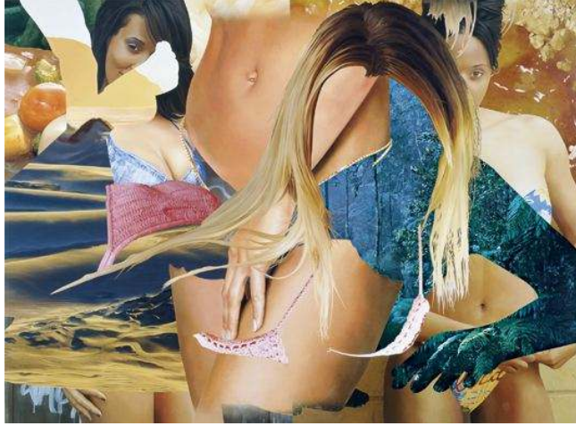
Fig 3. Jeff Koons, "Prison (Venüs)", 259.1 x 350.5 cm, Tuval üzerine yağlı boya, 2001, Sonnabend Gallery, New York, Amerika.