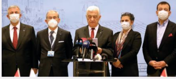
Toplantıların ardından CHP'li belediye başkanları ortak bildiri açıkladı.

Toplantı sonrası 11 büyükşehir belediye başkanının imzası ile ortak açıklama yapıldı. Açıklamada İstanbul Sözleşmesi'nin fesh edilmesi eleştirilirken "Karanlık bir güne uyandık. Kadına şiddet olaylarının bu denli arttığı bir ortamda akıl almaz bir kararlar karşılaştık. Şiddetin önlenmesi, mağdurların korunması ve şiddet uygulayanların adalete teslim edilmesi, İstanbul Sözleşmesi'nin temel hedefiydi. Kaldırılma kararı insan haklarına indirilen ağır bir darbedir. Bu hatadan hızla dönülmesini talep ediyoruz" denildi. Aşılamanın hızlandırılması ve turizminin hükümetçe desteklenmesini de istendiği açıklamada şu ifadeler