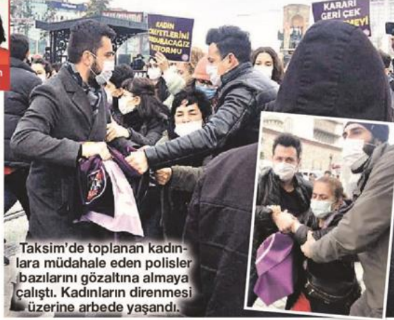
Taksim'de toplanan kadınlara müdahale eden polisler bazılarını gözaltına almaya çalıştı. Kadınların direnmesi üzerine arbede yaşandı.

tanbul Sözleşmesi'nin feshedilme kararı bizim açımızdan hükümsüzdür" deyip "Kararı geri çek, sözleşmeyi uygula!" eylemine başladı. İstanbul Sözleşmesi'nin uygulanmasını isteyen ve daha sonra oturma eylemi başlatan kadınlara polis müdahale etti, arbede yaşandı. Sosyal medyada da #KararıGeriÇek etiketi açıldı, İstanbul Sözleşmesi savunularak, kararın geri çekilmesi istendi.