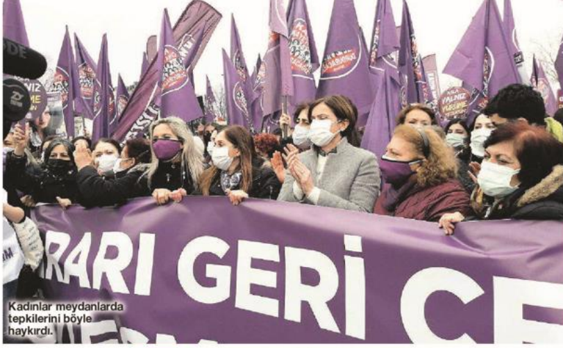
Kadınlar meydanlarda tepkilerini böyle haykırdı.

Kadını şiddetten korumaya yönelik uluslararası İstanbul Sözleşmesi'nin ilk imzacısı olan Türkiye, Cumhurbaşkanlığı kararı ile sözleşmeden çekildi