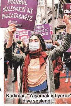
Kadınlar, "Yaşamak istiyoruz" diye seslendi...

ceğiz" dedi. Mor Çatı Kadın Sığınağı Vakfı ise yaptığı açıklamada "İstanbul Sözleşmesi'nden çekilmeyi reddediyoruz!" ifadesini kullandı. İktidara yakınlığı ile bilinen KADEM ise "Sözleşme kadına şiddetle mücadele için önemli bir girişimdi. Geldiğimiz noktada zemininden koparılmış ve toplumsal bir gerilim öznesi haline dönüştürülmüş durumda. Verilen feshi kararını da bu gerilimin neticesi olarak okuyoruz" denildi. SÖZCÜ/İSTANBUL