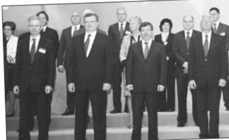
Avrupa Konseyi Bakanlar Komitesi 121. toplantısına katılan bakanlar, "Kadına Karşı Şiddet ve Aile İçi Şiddetle Mücadele ve Önlenmesi Sözleşmesi"nin imza töreninden sonra aile fotoğrafı çektiler. Anlaşmaya 13 ülke imza attı.

Toplantının Avrupa'nın yakın bölgelerinde önemli değişimlerin olduğu bir zamanda yapıldığına dikkat çekilecek Kuzey Afrika ve Ortadoğu'da demokrasi ve sosyal adalet yönündeki haklı taleplerin bulunduğu anımsatıldı. Açıklamada, "Umarız ki bu olaylar, barışçıl, istikrarlı ve demokratik toplantılara doğumuna yol açar" denildi. Konseyin temelini oluşturan değerler olmaksızın kalıcı barış ve istikrar olamayacağına dikkat çekilen bildiride, bununla birlikte bu değerlerin hiçbir zaman zararı olmadığının altı çizildi.