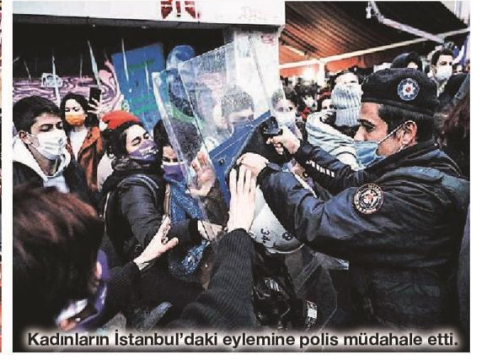
Kadınların İstanbul'daki eylemine polis müdahale etti.