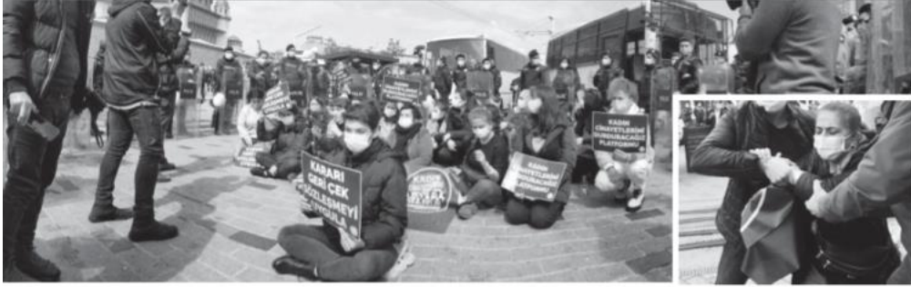
Taksim Cumhuriyet Anıtı'nın çevresinde oturma eylemi yapan kadınları, meydana yoğun güvenlik önlemi alan polisler abluka altına aldı.