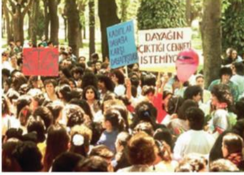
1987 yılında Dayağa Karşı Dayanışma yürüyüşüne 2 bin 500 kadın katılmıştı.

Dayağa Karşı Dayanışma Mitingi'nin üzerinden 34 yıl geçti. Ancak kadınlar dün olduğu gibi bugün de hakları için mücadele ediyor. Kadınlar "Kazanılmış haklarımızdan vazgeçmeye niyetimiz yok" diyor