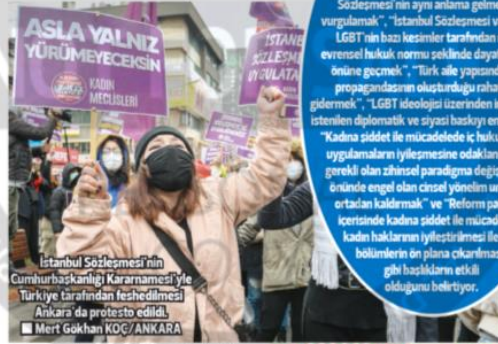
İstanbul Sözleşmesi'nin Cumhurbaşkanlığı Kararnamesi'yle Türkiye tarafından feshedilmesi Ankara'da protesto edildi.

Erdoğan, İstanbul Sözleşmesi'nin feshetme kararını, 15 Temmuz 2018'de yürürlüğe giren 9 numaralı Cumhurbaşkanlığı Kararnamesi'nin (CBK) üçüncü maddesiyle tanıyan yetkiyle dayanak verdi. Anayasa Mahkemesi daha önce CHP tarafından önüne getirilen 9 sayılı CBK'ya dönük iptal istemleri arasında yer almadığı için üçüncü maddesi tartışılmıştı. 9 sayılı CBK kararının Erdoğan'a sözleşmeleri feshetme yetkisi veren "onaylama" düzenlemesi şöyle: "Milletlerarası anlaşmaların onaylanması, bunların feshini ilah etmemek suretiyle yürürlük süresini uzatma, Türkiye Cumhuriyetini bağlayan