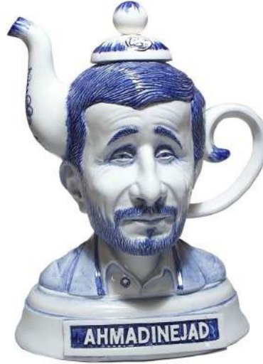
Görsel 11. Mike Leavitt ve Charles Kraftt, 2010, Ahmedinejad Delft çaydanlık, seramik.

İkili olarak çalışmalar üreten Mike Leavitt ve Charles Kraftt ise, sosyal yorumlarını farklı tasarımlar yolu ile ortaya koymaktadır. Sanatçılar, tabloid kişilikleri ve karanlık karakterleri farklı çaydanlık formlarıyla kurgulamışlardır. 2010 yılında Londra'da açılan sergisini Charles Kraftt ile oluşturmuştur. Charles Kraftt, Delft seramik resimleme tekniği ve materyallerini modern tasarımları ile birleştirmektedir. Bu iki sanatçının bu ortak projesinde ünlü karakterlerin büstleri, bu teknikle çaydanlık, fincan gibi objelere uyarlanmıştır.