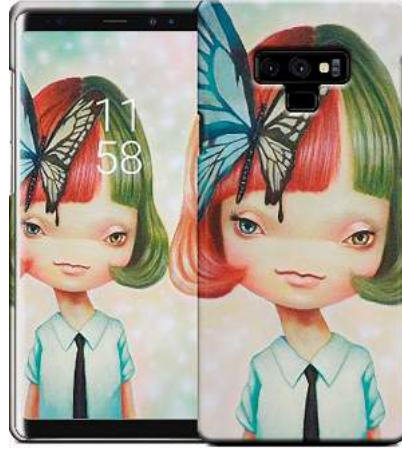
Görsel 6. Yosuke Ueno, Makas ve Kelebek/Scissors and Butterfly Gelaskin telefon uygulamaları

Gençlik yıllarında ölüm, üzüntü ve psikopatoloji gibi konularla daha olumsuz ve karanlık resimler yapan Yosuke Ueno, 20'li yaşlarından sonra daha pozitif, sevgi ve ışıkla eserler yaratmaya başlamıştır. Bu kararı, dünyada zaten yeteri kadar acı ve olumsuzluklara maruz kaldığı anlayışıyla vermiştir. Ueno'nun sanatı, 2011'de Japonya'yı harap eden Tsunami ve depremle daha da şekillendi. Bu trajediden sonra eserlerini sevgi ve umudu çağırma girişimleriyle ortaya koydu. Ueno, özellikle masum görünümlü canlı renklerle ve sembolik bir dille oluşturduğu stili ile tanınmıştır. Ueno'nun sanatında; geleneksel Japon kültüründen, Tokyo'nun sokak modasından, dünyanın dört bir yanındaki sanat eserlerine ve sanat tarihinin başyapıtlarına kadar izler görülebilmektedir. Özellikle Japon kültürü, Yosuke'nin eserlerindeki ana etkilerdir. Manga, anime, Budist heykelleri vs. konulardan oldukça etkilenmiştir. Sanatçının çok sayıda yarattığı özgün, stilize, eşsiz ve orijinal karakterleri, Japon manevi inanç sistemleriyle bağlantılıdır. Ueno'nun çalışmalarının öne çıkmasının nedenleri; ilginç bir şekilde yan yana diziler, gizli sembolizm ve yinelenen metaforlardır. Sanatçı adeta, sembolik sistemi ile alternatif bir gerçeklik, tekrarlayan karakterler ve tekrarlanan motifler içeren sıkıca örülmüş bir evren inşa etmiştir ("Widewalls", 2015).