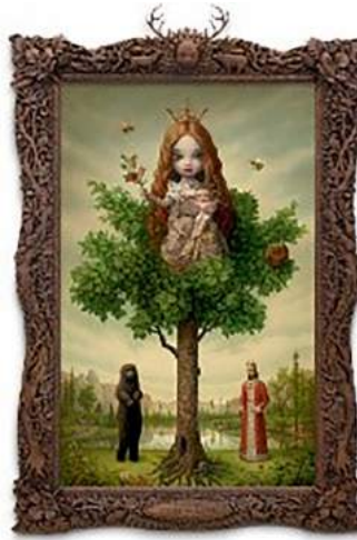
Görsel 2. Mark Ryden, 2006, Hayat Ağacı/The Tree Of Life, Tuval üzerine yağlıboya, 168x107 cm, (Michael Kohn Galerisi, ABD)

Akımın öncü sanatçılarından Mark Ryden, illüstrasyon üzerine eğitim almıştır. Resimlerinde pop kültür öğelerini sıklıkla kullanan Ryden'in diğer temaları; Hollywood yıldızları, dini sahneler, çizgi filmlerdekilere benzer karakterler, karanlık temalar, Erken Rönesans-Gotik dönem örneklerini anımsatan peyzajlardır. Bu karakterlerin oldukça çocuksu ve sempatik görünüşlerinin altında her zaman tekin olmayan bir hal vardır ve görüntülerinin tam zıttı temalarla ilgilidirler. Resimlerinde görülen sevimli olduğu kadar rahatsız edici çocukluk masumiyeti sanatçının ruhunun gizemini ortaya koymaktadır (bkz. Görsel 1-2) New York Times gazetesine göre 'Ryden'in