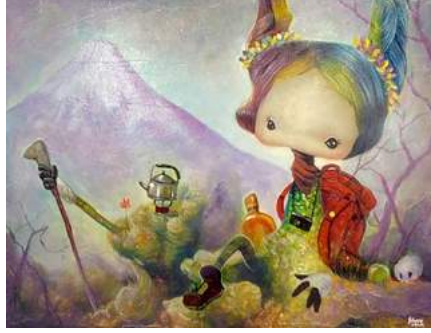
Görsel 3. Yosuke Ueno, 2012, Dağ Oluyorum/I Become Mountain, Tuval üzerine akrilik, 32x24 cm

Lowbrow Sanat Hareketi, ağırlıklı olarak genç sanatçıların kendilerini gösterdiği bir platform olarak gözlemlenmektedir. Aynı şekilde, izleyici kitlesini de genç kuşak oluşturmaktadır. Popüler bir kültür oluşumu olması itibariyle, aynı dili konuşan, algısı ve yorumu paralel olan (çağdaş) insanlar arasında üretilip ve tüketilmektedir. Ancak akım, popüler kültürün sanatçıları yönlendirmesinde, güncel bir örnek olarak incelemeye değerdir. Özellikle gençler arasında, tıpkı pop müziğin ikonlaşan yüzleri gibi, sanatçıların eserleri, internet bazlı paylaşım sitelerinde, profil imajı olarak kullanılmakta, bilgisayar ve cep telefonlarını kişiselleştirmekte ve popülerize edilmektedir. Ortaya konulan eserlerde, uygulama alanı geniş ve esnektir. Eserler, farklı yüzeylere de uygulanabilmektedir. Bu uygulama ile eser, sanatsal değerinden bir şey kaybetmez, tam tersi, bu şekilde oluşturulan bir sergiye, canlılık ve zenginlik katmış olur (Başkent, 2010, s. 62-80).