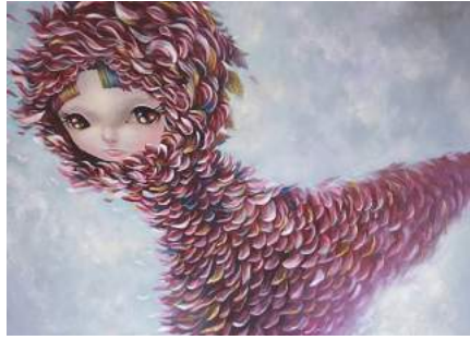
Görsel 4. Yosuke Ueno, 2013, Pembe Bagworm/Pink Bagworm, Tuval üzerine akrilik, 46x61 cm