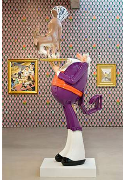
Görsel 8.Robert Williams, 2009, Keçi Kıçında Elmas/Diamond in a Goat's Ass, Yerleştirme, (Tony Shafrazi Galerisi, ABD)

Robert Williams'ın destansı, karikatüre benzeyen resimleri ve düzenlemeleri Amerikan üslûbundan ve görsel argolardan alınmıştır. Williams eserlerinde; iççiliğe, figürasyona ve popüler imgelere odaklanmıştır. Çalışmalarını, sosyal yorumları için; somut, ilişkilendirilebilir ve genellikle saçma, absürt olarak nitelendirilen görüntülere dayandırmıştır. Resimlerindeki çizgi film esprisi heykellerinde de devam etmektedir.(bkz. Görsel 7-8) Sosyal içerikli bu çalışmalarıyla sanatçı, aynı zamanda bazı yüzleşmeler ve kafa karışıklıkları da yaratmaktadır. Tüm bu ifadeler, 'yüksek' sanat dünyasına muhalif tutumlardır.