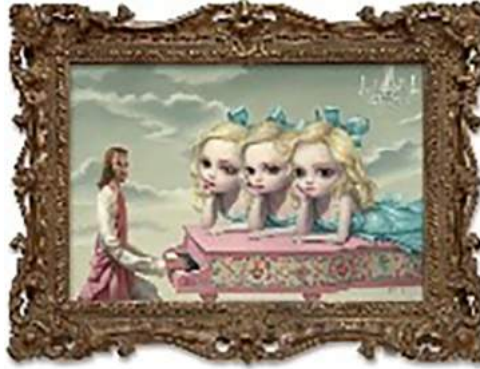
Görsel 1. Mark Ryden, 2010, Piyano Adamı/The Piano Man, Tuval üzerine yağlı boya, 51x76 cm, (Paul Kasmin Galerisi, ABD)

Pop Sürrealizm'in genel olarak anlatım tekniği resim ve illüstrasyondur; fakat hızla yaygınlaşan bu bağımsız akım özellikle günümüzde heykel, vinil oyuncaklar, seramik ve mekân yerleştirmeleri olarak da görselleştirilir. Konularını daha çok popüler kültür elemanları, grotesk biçimler, animatik karakterler ve sarkastik yaklaşımlar oluşturur. 1990'larda akım Amerika'dan sonra Avrupa ve Uzak Doğu ülkelerinde de yer bulmuş ve başta illüstrasyon sanatçıları olmak üzere çok çeşitli disiplinlerde üreten pek çok kişiyi etkisi altına almıştır. 2000'li yıllarda illüstrasyon, karakter tasarımı ve pop-sürrealist yaklaşımların reklam filmlerinden, animasyona, basılı tasarım işlerinden üç boyutlu yapıtlara kadar her alanda yer aldığı görülebilir. 2000'den sonrası bu sanat hareketinin altın çağı olarak anılmaktadır (Ergen, 2015, s. 176).