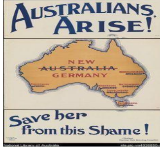
Resim 3: Anzak Savaş Posterleri 1