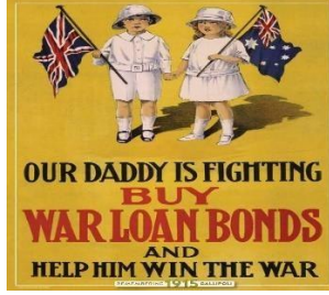
Resim 8: Anzak Savaş Posteri 6