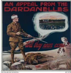
Resim 6: Anzak Savaş Posterleri 4