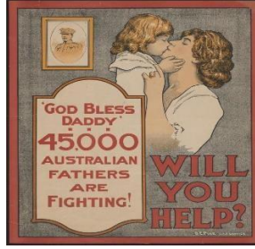
Resim 7: Anzak Savaş Posteri 5