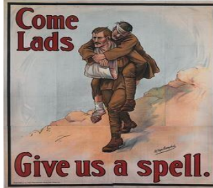
Resim 9: Anzak Savaş Posteri 7