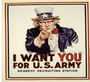
Resim 1: Sam Amca Posterleri