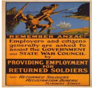
Resim 10: Anzak Savaş Posteri 8