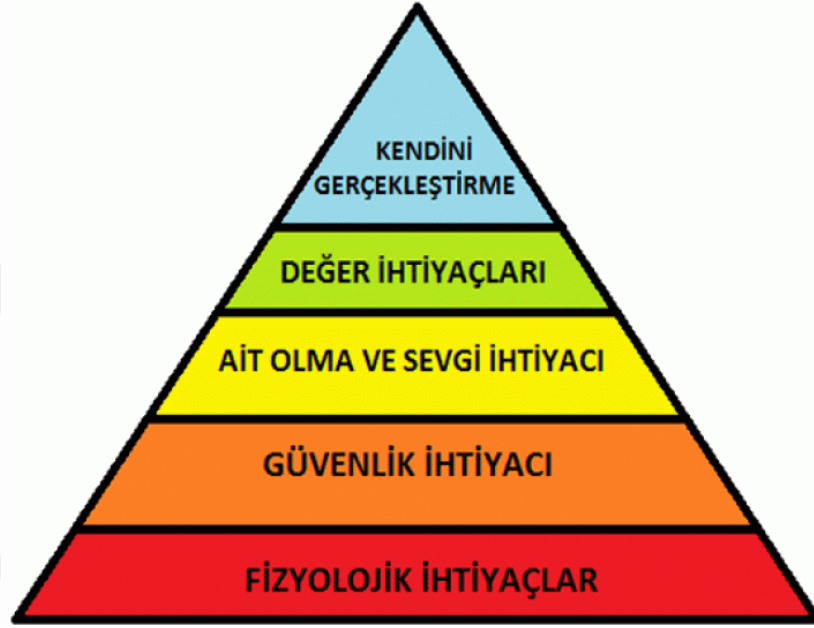
Şekil 4: Maslow’un İhtiyaçlar Hiyerarşisi

Bu hiyerarşide alt ihtiyaçlar giderildikçe üstteki ihtiyaçların giderilmesi gerçekleşebiliyor. İlk iki ihtiyaç hayatta kalmak için gerekli ihtiyaçlardır. İlk iki basamaktan sonraki ihtiyaçlar bireyin benlik saygısına etki eden ihtiyaçlardır. Kişinin hayatta kalması adına temel ihtiyaçları karşılanmadığı zaman üst kademelerdeki ihtiyaçları da karşılanamaz ve yüksek benlik saygısıyla karşılaşılması güç bir hal alır.