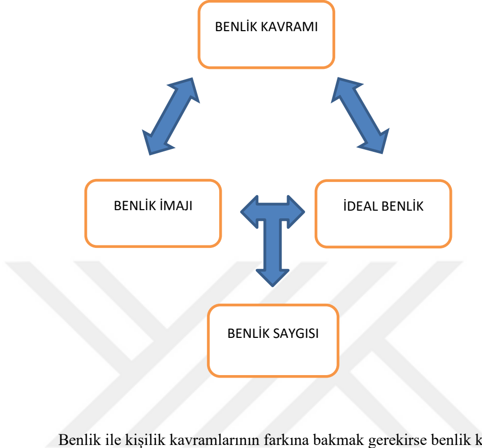
Şekil 3: Kaynak: Lawrence, D. (2000:2)

Benlik ile kişilik kavramlarının farkına bakmak gerekirse benlik kişinin kendini algılayış biçimi olarak karşımıza çıkarken, kişilik ise bireyi başkalarından ayıran tüm özelliklerdir.