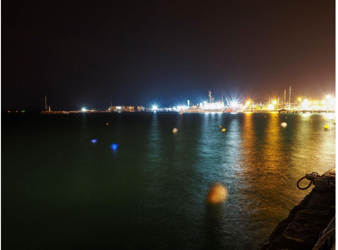
Görsel-7 Yıldız Etkisi