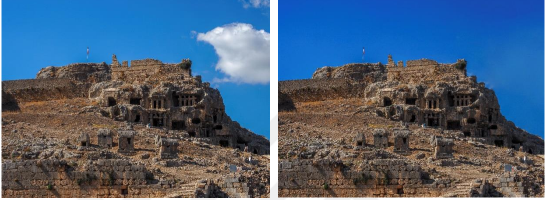
Görsel-8 Nesne Silme

Üretilen program ve uygulamalarla fotoğraf çekildikten sonra da manipüle edilmesini kolaylaşmaktadır. Bu doğrultuda fotoğraf çekildikten sonra yapılan manipülasyonların başında rötuş gelmektedir. Rötuş ise kendi içinde nesne ekleme ve silmeyi de barındırmaktadır.