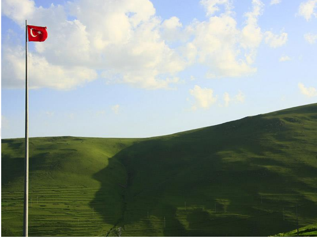
Görsel-3 Ardahan Damal Atatürk Silueti

estetik görüneceğinin ön görülmesi fotoğraf çekilmeden önceki manipülasyonlar olarak değerlendirilmektedir. (Ege, 2017: 119).