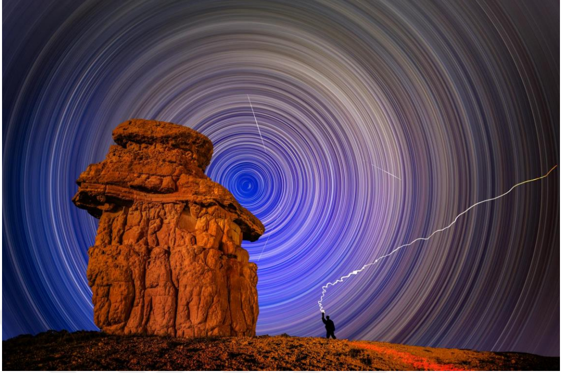
Görsel-10 Hakan Hatay Fotoğrafi (2)