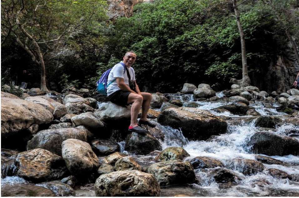
Görsel-4 Kısa Pozlama 1/160 Saniye