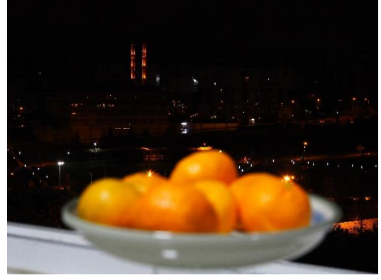
Görsel-6 Bokeh Etkisi