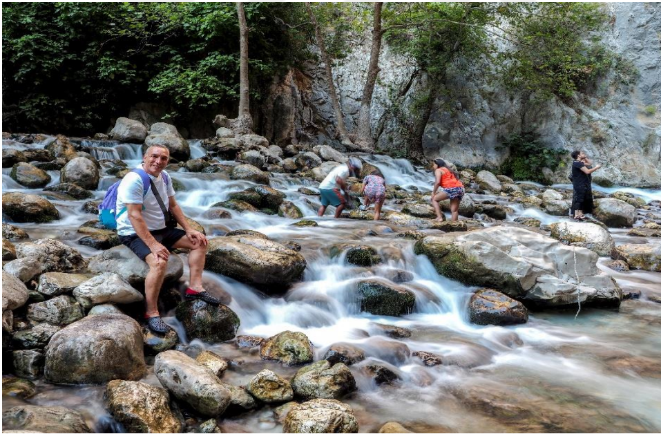
Görsel-5 Uzun Pozlama 1/3 Saniye