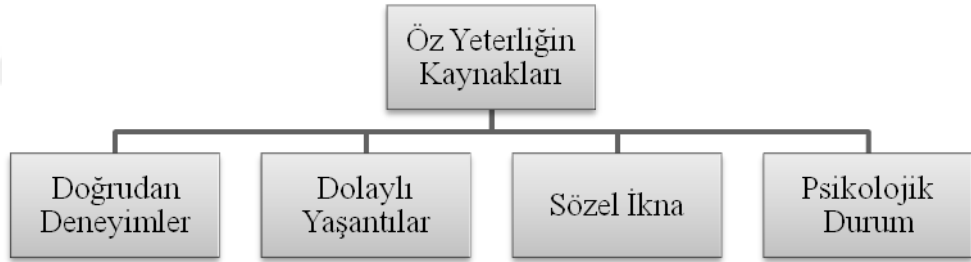
Şekil 3: Öz Yeterliğin Kaynakları

Öz yeterlik algısı, kişinin kendine ilişkin algılarıyla yakın ilişkilidir. Dolayısıyla öz-yeterlik, bireyin geleceğe yönelik bir yargıda yetkinlik algısını ifade etmektedir (Hoy ve Spero, 2005). Bu bağlamda bireyin öz yeterlik inancının oluşmasına kaynaklık eden süreçlerin belirlenmesi önemli olmaktadır. Bireyin öz yeterlik inancının dört kaynaktan beslendiği kabul edilmektedir (Şekil 3).