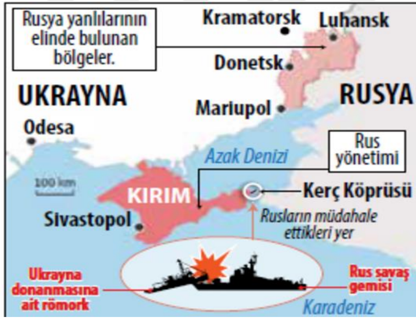
Şekil:8 Krizin yaşandığı nokta

Mart 2018'de Ukrayna, Rus bayraklı balıkçı gemisini işgal altındaki bölgeye girmek suçundan, Azak Deniz'i açıklarında yakalamış ve içerisinde bulunan personeli gözaltına almıştır. Donbass yasa tasarısının kabulünün ve gelişen olayların ardından Rusya'dan karşı hamle beklenmekteydi ("Rusya, AB'yi Ukrayna konusunda uyardı: Donbass yasa tasarısı feci sonuçlar doğurabilir", 2018). O hamle, kasım ayında Rusya'nın Ukrayna donanmasına ait üç gemiye ateş açılarak, el konulması ile yapıldı. Rusya, Ukrayna gemilerinin deniz sularına yasa dışı yollarla girdiğini söylemiştir. ("Tension escalates after Russia seizes Ukraine naval ships", 2018) Bu durum aslında savaş sebebidir ve iki ülke arasında büyük krize yol açmıştır.