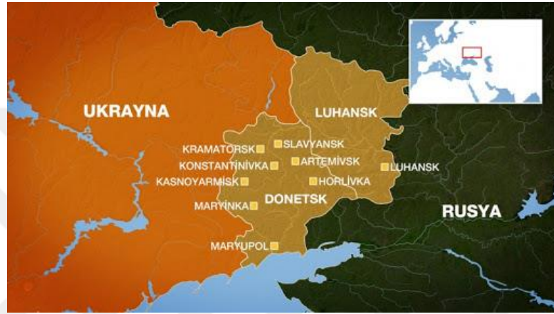
Şekil 6: Ukrayna Doğusunda 2014 yılı Çatışmasının olduğu bölge

Ukrayna'nın doğusunda Rus nüfusunun çok olması, Rusya'nın bölge üzerinde etkisini artırmasına yardımcı olmuştur. Donetsk'te %56,9 Ukraynalı, %38,2 Rus, Luhansk'ta %58 Ukraynalı, %39 Rus nüfusu bulunmaktadır ("State Statistics Committee of Ukraine", 2001). Rusya sınırına yakın bulunan bu bölge, kültürel olarak Ukrayna'nın batısına göre farklılık göstermektedir. Sovyetler Birliği döneminde bu bölge sanayi bölgesi olarak görülmüş, 1930'lu yıllarda bölgeye etnik Rusların göçü başlamıştır. Ukrayna'nın bağımsızlığından sonra bile bölge üzerinde Rusya'nın baskısı olmuş, Rusça yaygın olarak konuşulmuştur.