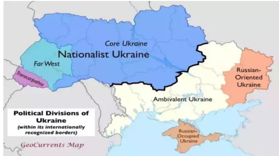
Şekil 3: Ukrayna İçindeki Farklılıklar

Ukrayna, bağımsızlığını ilan ettikten sonra kapitalist dünya ile ilişkilerini kurmaya başlamıştır. Ukrayna, bağlarını güçlendirerek Batı ile ilişkilerini istikrara kavuşturmak istemiş ve ilişkileri kesmeden Rusya’nın etkisini zayıflatmaya çalışmıştır. 1991-1997 yıllarında Rusya ile karşılıklı bağımlı olmalarına rağmen aralarındaki soğuk ilişkiler nedeniyle, AB ile yakınlaşmak Ukrayna’ya kazandıracaktır. Ancak Ukrayna’nın Doğusu ile Batısı arasında farklılıklar vardır. Bu farklılıklar, AB ile Rusya arasındaki konumu etkilemiştir.