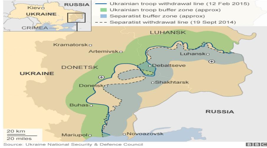
Şekil 7: Minsk Protokollerinde Oluşturulan Bölge Haritası