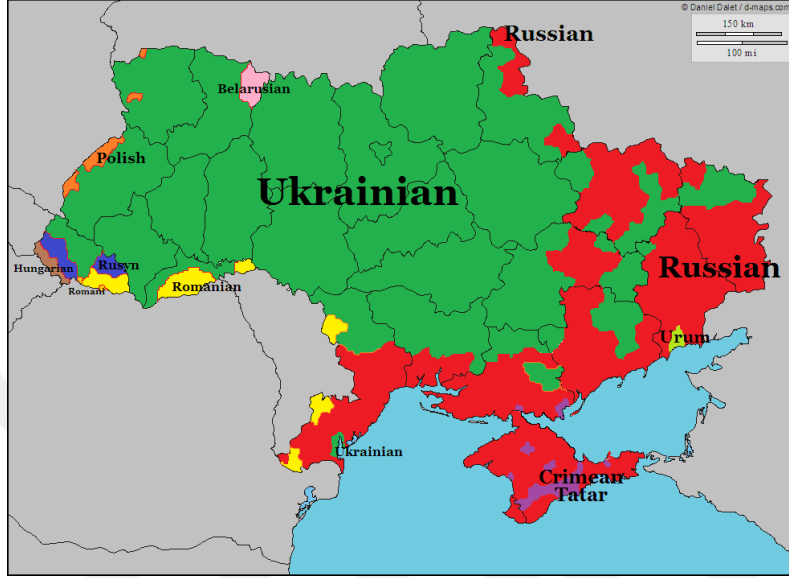
Şekil 2: Ukrayna’da Nüfus Dağılımı

Başkanı Vladimir Litvin, yasaya karşı olduğunu söyleyerek istifa etmiştir (“Ukrayna’da ‘Rusça’ gerginliği”, 2012). Ancak Rusya-Ukrayna ilişkilerinin sonraki dönemde kötüleşmesiyle, dil konusu 2017 yılında yeniden tartışmaya sunulmuş; yeni eğitim kanununda, 5-12. sınıflar arasında yabancı dillerden Rusçanın çıkarılması kabul edilmiştir (“Ukrayna’da bütün Rus dilli maktəblər ləğv edildi”, 2020).