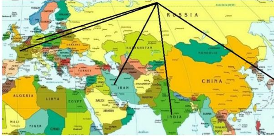
Şekil: 1. Rusya'nın Jeopolitik Konumu

Avrasya'nın kuzeyinde yer alan Rusya, Doğu'da Kuzey Kore, Batı'da Finlandiya ile komşudur. Yüz ölçümü açısından dünyanın en büyük ülkesidir. Jeopolitik açıdan çok büyük öneme sahiptir. Jeopolitik kavramının anlamı, bir devletin bir bölgede uyguladığı politika ile o yerin coğrafyası arasında bulunan ilişkidir. Diğer bir deyişle coğrafi konum, ülkelerin politika ve stratejilerine yön vermektedir (Flint, 2006, s. 7-9; Özey, 2018, s. 8-10).