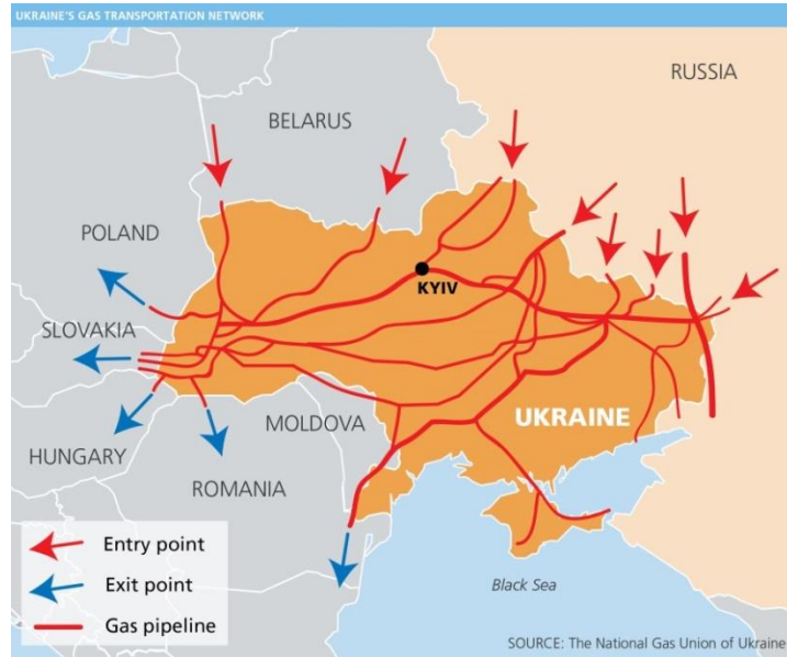
Şekil 4: Ukrayna Üzerinden Geçen Doğal Gaz Boru Hatları

2005 yılında Rusya, Ukrayna üzerinden Orta ve Batı Avrupa’ya giden doğal gaz hattını kesmiştir. Bu durumdan ilk etkilenen ülkeler Macaristan, Polonya ve Avusturya olmuştur. Rusya, Ukrayna’nın doğal gaz çaldığını belirtmiş ve bu durumun düzelmesi için AB’nin Ukrayna’ya baskı yapması gerektiğini savunmuştur. Krizden önce, Ukrayna ve Rusya arasındaki doğal gaz fiyatı 50 dolar, krizden sonra ise bu rakam 230 dolar olmuştur. Krizden sonra, sevkiyat ve taşıma bedeli gibi konularda sıkıntılar yaşanmıştır. Transit ücreti olarak da Ukrayna, Rusya’ya kriz sonrasında 1000 m 3 için 0.56 dolar ödemeyi kabul etmiştir.