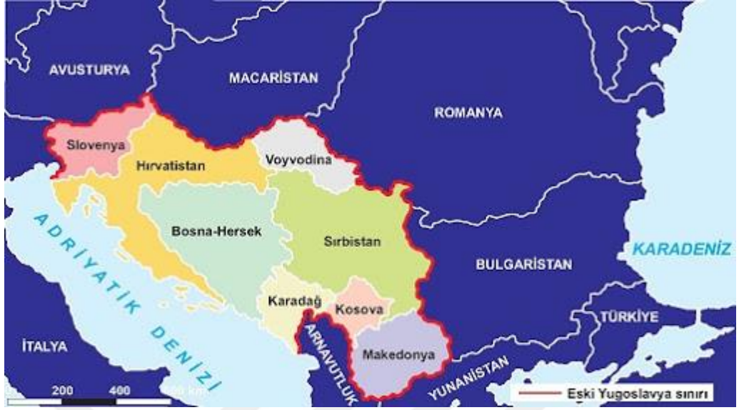
Harita- 3 Yugoslavya dağıldıktan sonra oluşan devletler 251

Balkanlar coğrafyasında din, dil, ırk ve kültür açısından oldukça çeşitli ve iç içe geçmiş demografik bir yapının olması, bu bölgenin en önemli sorunu olmuştur. Bölgenin dağlık coğrafik yapısı, farklı toplumların iletişimini ve kültürlerin kaynaşmasını olumsuz yönde etkileyen fiziki bir engel niteliğindedir. İletişimin ve kaynaşmanın zayıf olması ortak bir resmi dil oluşumunu engellemiş Arnavutça, Bulgarca, Hırvatça, Sırpça, Slovence, Türkçe ve Yunanca gibi dillerin ayrı ayrı resmi dil olarak kabul edilmesine yol açmıştır. Bölgede yaşayan birbirinden farklı toplumsal unsurlar, millet olabilmek için hangi değerler etrafında birleşmek gerektiğini tam olarak yorumlayamamış, bu durum toplumsal yapı kültür ve ekonominin dini inanışlar çerçevesinde şekillenmesine neden olmuştur. Yine bu coğrafyada ortak bir kimlik inşa edilememiş, farklı toplumsal unsurların nüfus kayıtlarının etnik kökene göre yapılması dağılma sürecine katalizör etkisi yapmıştır. Bütün bunlarla birlikte, geçmişten günümüze kadar çok çeşitli etnik unsurların bir arada yaşadığı bu coğrafyanın, gerçek anlamda sınırlarının nasıl çizilmesi gerektiği Balkanlar siyasetinin en önemli çıkmazı olmuştur. 252