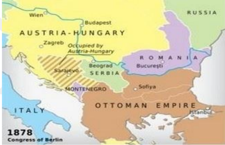
Harita-1 Osmanlı Dönemi Balkanlar (Rumeli) 146

Yine bu coğrafyayı tanımlamak için kullanılan, Balkanlar kelimesinin kökeni ise Türkçedir. Bu kelime, yüksek ve sık ormanlarla kaplı sıradağlar, bataklık, sazlık bölge anlamına gelmektedir. Doğu Avrupa bölgesini coğrafik olarak isimlendirmek için kullanılan Balkanlar kelimesi, bölgede uzun yıllar yaşanan olumsuzluklar neticesinde kargaşa, bölünmüşlük ve etnik çatışma gibi anlamları çağrıştıran ifadeler şeklinde kullanılmaya başlanmıştır. 147 Balkanlar'da Osmanlı İmparatorluğu'na