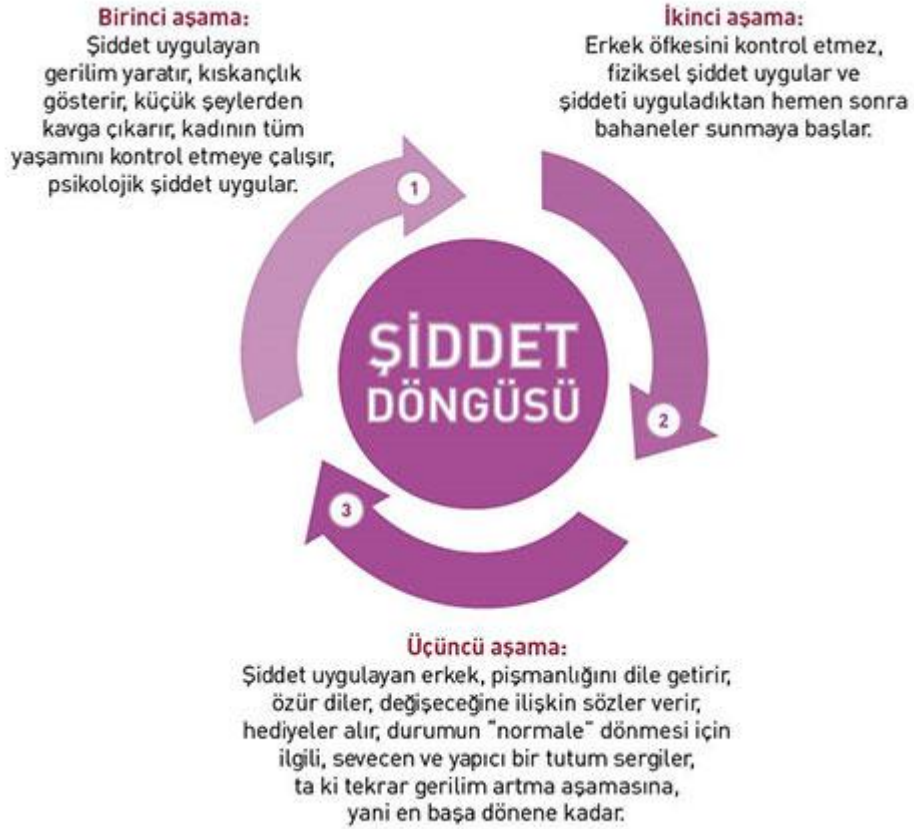
Şekil-1. Kadına Şiddet Döngüsü 8