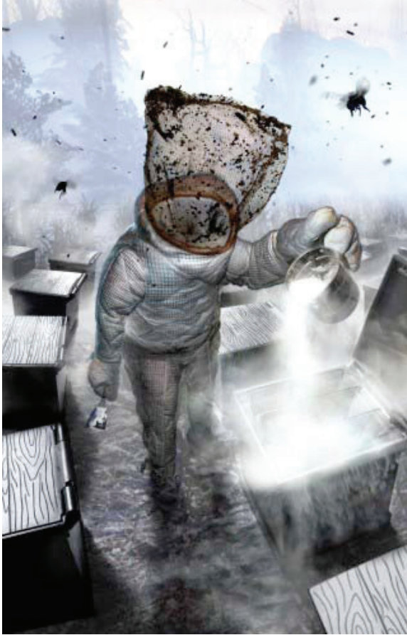
Resim 6. Ansen Atilla , “Göçebe”, 180 x 116 cm, C-Print, 2011.

Ansen Atilla'nın çalışmaları genel olarak, insan ve güç kavramlarına odaklanmaktadır. Ayrıca, mekân ve zaman farklılıklarına rağmen sabit kalan, yasak, suç, yargı ve savaş kavramlarını görünür ya da görünmez niyetler çerçevesinde incelemektedir. Çalışmalarda çeşitli tarihsel olaylar ve güç ilişkilerine dayalı sahneler, dijital medya programlarında bulunan filtrelerden geçerek bir görselleştirmeye tabi tutulmuştur. Bu türden görselleştirmelerin, Photoshop ya da Painter gibi imaj manipülasyon programlarının ustaca kullanımını gerektirmektedir. Dijital medyanın araçsallaştırılarak görselleştirilmesi, bu imgeleri yeni medya sanatı yapmaya yetmemektedir. Daha açıkça belirtmek gerekirse, yeni medya sanatı tarihsel olgular veya güç ilişkileriyle değil, “gizini açmanın bir yöntemi” olan teknikle uğraşmaktadır (“Yeni medya sanatı”, t.y.).