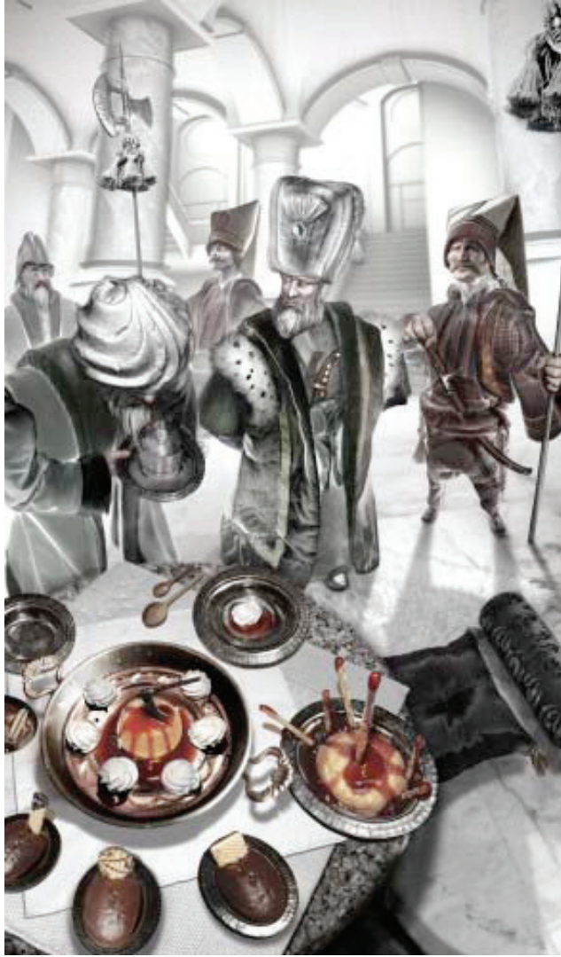
Resim 5. Ansen Atilla , “Öğle yemeğinde tuzlama”, 186 x 110 cm, C-Print, 2011.

Bazen Yeni Medya çalışmalarında; teknik ve malzeme, içerik ve bağlamdan ayrıştırılmıştır. Bu bağlamda, örneğin Ansen Atilla'nın dijital ortamda oluşturduğu tekniği, ele aldığı tarihsel olguyu, insan ve güç ilişkisini vs. gibi kavramları görselleştirmek gayesiyle araçsallaştırılmıştır. Burada bu kavramları görselleştirmek amacıyla bir medya kullanılmıştır. Buradaki tehlike, bu göstergelerin kendi bağlamından kopuk olması ve yapılan manipülasyon tekniğinin bir efekt yaratabilme ihtimalinin olmasıdır.