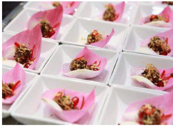
Fotoğraf 4. Çekirge lotus yaprağı snack (Halloran, Flore & Mercier, 2015a)