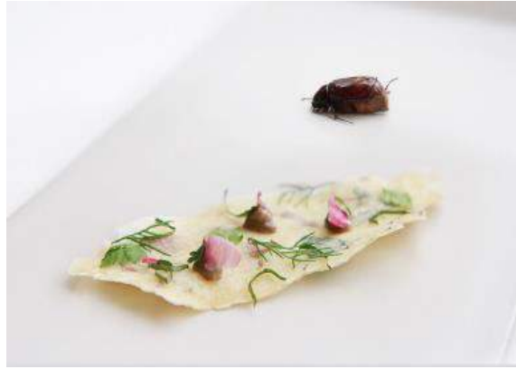
Fotoğraf 2. Cockchafer (Mayıs böceği) tereyağı ve gevrek bitki (Halloran, Flore & Mercier, 2015a)