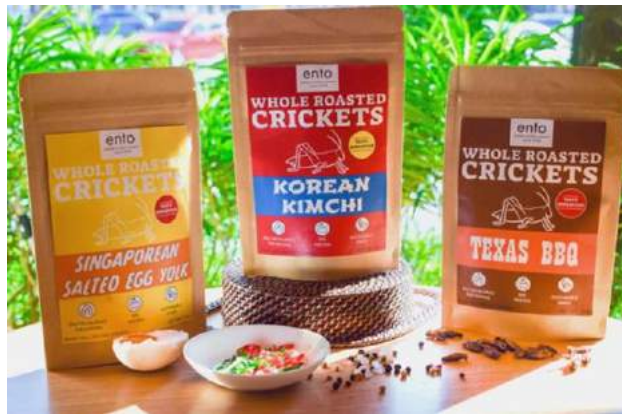
Fotoğraf 7. Çeşitli cırcır böcekleri (Çeşitli cırcır böcekleri, t.y.)

Bir başka çalışma olan Yen (2009)'a göre; böcekleri hem yerli toplumlarda insanlar için bir besin kaynağı olarak hem de batı toplumlarının gıda üretimi ile ilgili çevresel ayak izlerinin boyutunu küçültme ihtiyacı açısından entomofajinin rolünün kabul edilmesi gerektiği belirtilmiştir. Aynı çalışmada batı toplumlarının gıda güvenliği ve gıda güvenilirliği açısından entomofajinin risk taşıdığı ya da ekonomik durumlarının kötü gözükeceği kaygılarından