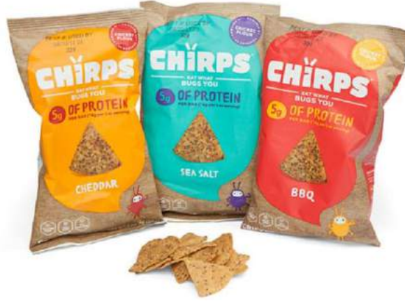
Fotoğraf 6. Kriket unuyla yapılan cipsler (Kriket unuyla yapılan cipsler, t.y.)