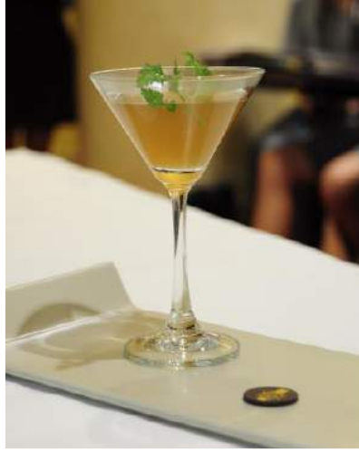
Fotoğraf 1. Kriket infüzyon suyu (Halloran, Flore & Mercier, 2015a)

değerlendirmelerinin alındığı çalışmada aktarılmıştır. Etkinliğe şefler, uygulayıcılar, girişimciler ve bilim adamları katılım göstermiş ve gerçekleştirilen sunumun ardından katılımcıların % 93'ünün tekrar böcek yemek istedikleri sonucu elde edilmiştir. Tüm katılımcılar menü ve tamamlayıcı sunumları ilginç bulduklarını, gelecekteki çalıştaylar ve bilgi paylaşımları için bilgi almak istediklerini belirtmişlerdir. Bu çalışmadan yemek okullarının ve gastronomi yayılımı ile ilgili kuruluşların, böcek yemenin yaygın olduğu bölgelere bunun gibi olayları tanıtmasının ne kadar önemli olduğu sonucu çıkmaktadır. Çalışma ile gastronomik tekniklerin geliştirilmesi ve yemeklerin hazırlanması, tartışılan bölgenin kültürel bilgi birikimine bağlı açık bir bilimsel bakışla tamamlanmıştır (Halloran, Flore & Mercier, 2015a, s. 241). Çalışmada yer alan ürünlere ait görseller aşağıda yer almaktadır: