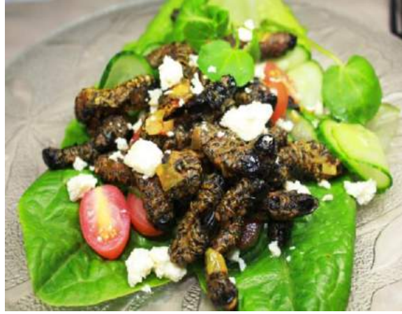
Fotoğraf 5. Mopan kurtçuk salatası (Mopan kurtçuk salatası, t.y.)

yemek hazırlama süreçlerinde yer almak isteklerinin olduğu tespit edilmiştir (Caparros Megido, Sablon, Geuens, Brostaux, Alabi, Blecker & Francis, 2014, s. 14). Literatürde bahsedilen bazı yenilebilir böceklere ait örnek görseller aşağıda verilmiştir: