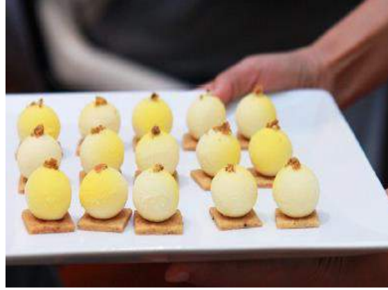
Fotoğraf 3. Bambu solucan ve kokulu böcek lokması (Halloran, Flore & Mercier, 2015a)