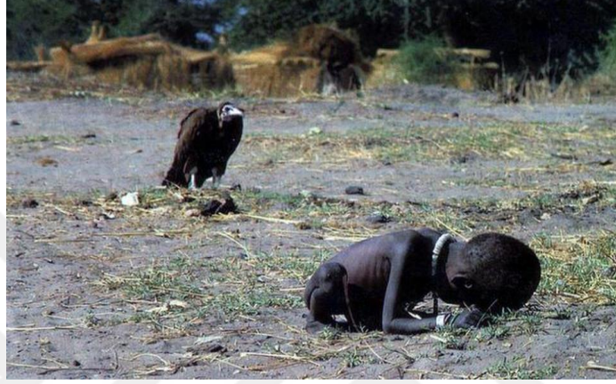
Açlıktan Ölen Çocuk ve Akbaba