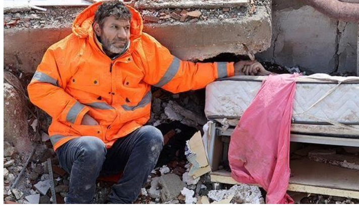
Kahramanmaraş Depremi -2023

Her sanat eserinde temel özelliğın estetik olduđu söylenebilir (Timuçin ve Türer, 2018). Ancak bu estetik ilgili eserin her zaman mutluluk vereceđi anlamına da gelmemektedir. Önemli olan dramatik ya da trajik bir durumun da estetize edilebilmesi, çarpıcı ve akılda kalıcı olabilmesidir. Fotoğraf sanat ilişkisi açısından ve farklı fotoğraf türlerinde yakalanan anların sanat olmasında bu deđişkenler etkilidir. Çünkü tek bir fotoğrafla sayfalarca anlatılan metinlerden çok daha etkili bir anlatım