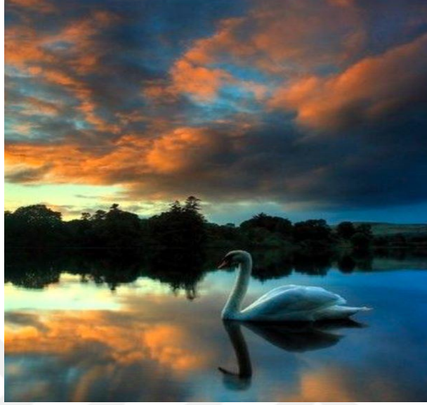
Kuğu - Suzan Ustabas Çöl