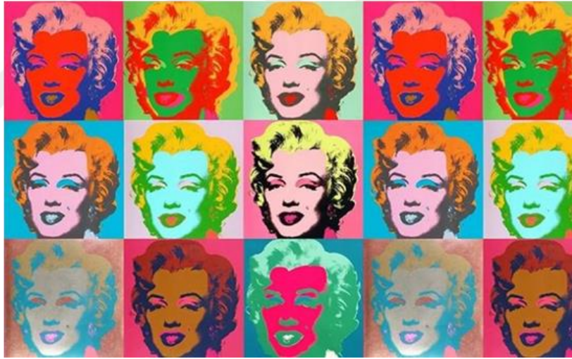
Marilyn Monroe Portresi

Sanatın fotoğrafın seri üretim kapasitesine tamamen teslim olması ise Andy Warhol i ile mümkün olmuştur. Warhol kolaj estetiğini terk eder ve tekli ya da çoklu birimler halinde sergilenen merkezi temsilleri kolaj estetiğinin yerine koyarak fotoğrafın resim