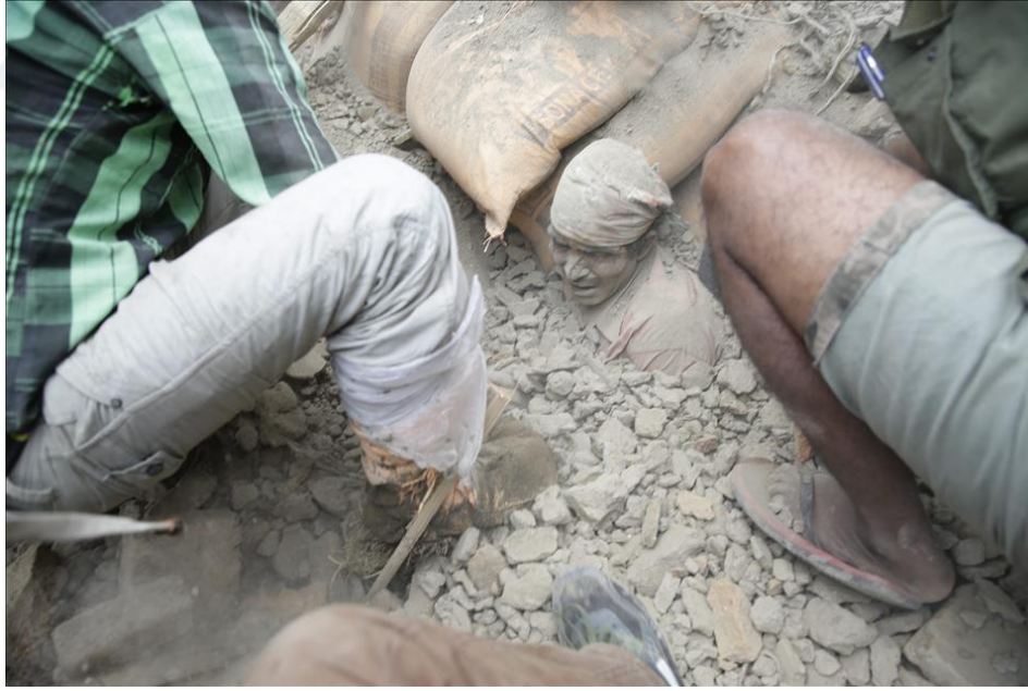
(Nepal Depremi)

Estetik ve sanatsal fotođrafların yanı sıra, bu tür fotođrafların belgesel deđeri de vardır. Deprem sonrası estetik ve sanatsal fotođraflar, yıkımdan sonra kalan izleri belgelemek,