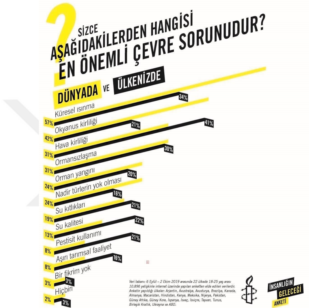
Şekil 3. İnsanlığın Geleceği Anketi

çizerek sürdürülebilir şehirler, iklim değişikliği, kuraklıkla mücadele, bio-çeşitliliğin korunması gibi çevre konuları sürdürülebilir kalkınma gündemine alınmıştır ( https://www.mfa.gov.tr/surdurulebilir-kalkinma.tr.mfa ).