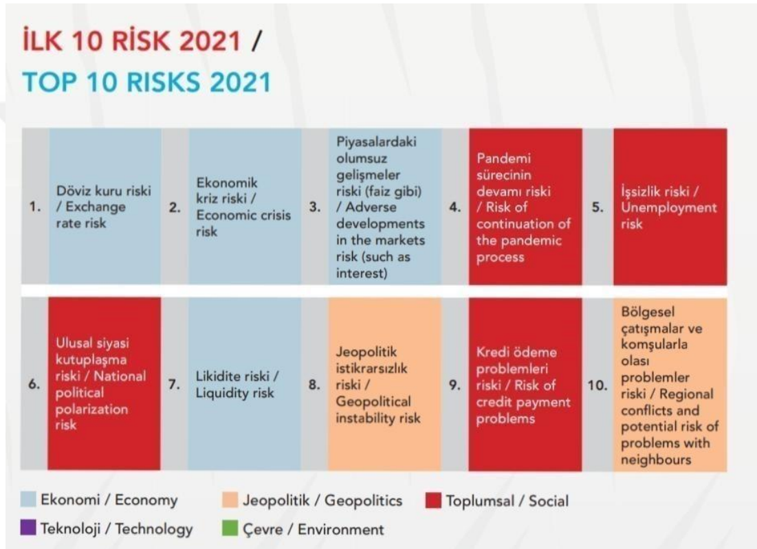
Şekil 2. Türkiye Risk Raporu 2021 İlk 10 Risk

Küresel dünya riskleri her geçen yüzyıl artarak ilerleyen bir seyir izlenmektedir. Bu risklere ekolojik, kimyasal, biyolojik, ekonomik, siyasal, sosyal güvenlik açıkları, düşman olarak algılanan nesne ve olguların çoğalması, risklerin yeni alanları, risklerin belirsizliği ve daha pek çok alanda rastlandığı görülmektedir. Bu bölümde güncel olması bakımından son yayınlanan ‘‘2021 Türkiye Risk Raporu’’ dikkate alınıp içinde bulunulan 21. Yüzyıl’ın küresel risklerine yerelden başlayıp uluslararası ilişkilere etkisi incelenip kısaca aktarılmaya çalışılmıştır.