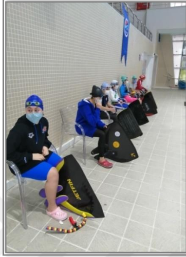
Resim 3. Organizasyon sırasında objektifime yansıyanlar

yöneticileri tarafından dikkate alınıp tedbirler kapsamında uyarılara dâhil edilmiştir. Sporcuların konforunu sağlamak üzere çıkış yapacak olan sporcuların sekizer kişilik gruplandırma ile üçe bölünmüş 8+8+8=24 formülü uygulanmıştır. Sporcuların oturacağı ayrı ayrı sandalyeler eklenmiş ve bir buçuk metre sosyal mesafe oluşturulmuştur.