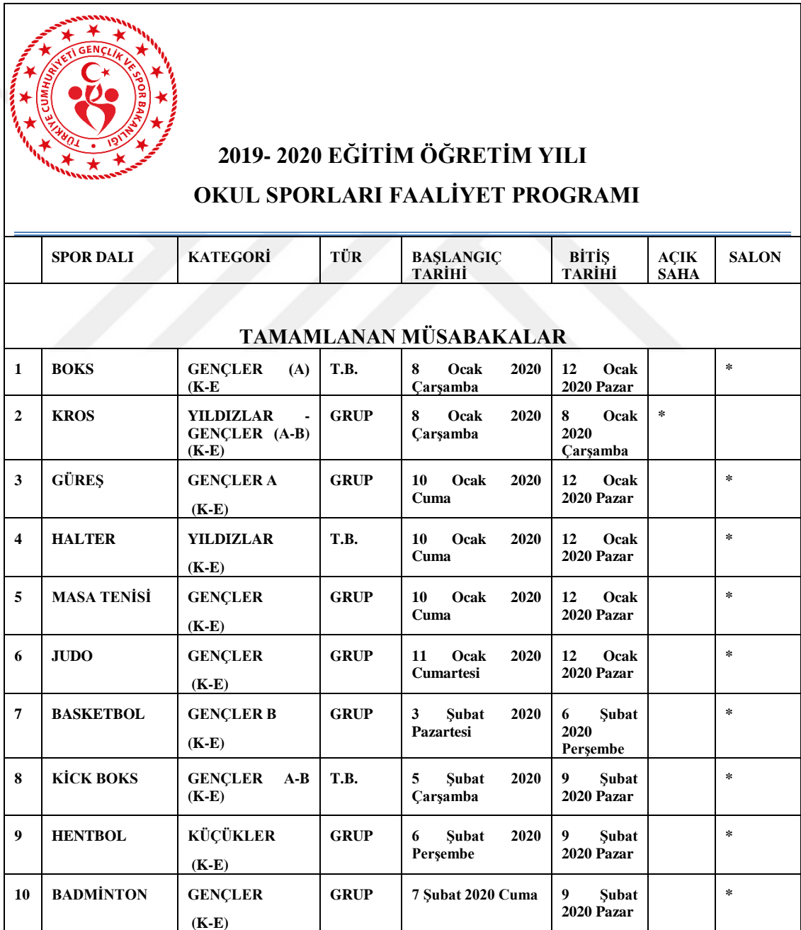
Tablo 4. 2019-2020 Eğitim ve öğretim okul sporları faaliyet programı

2019-2020 Eğitim Öğretim yılı okul sporları Eylül-Ekim aylarında mahalli yarışlarla başlamış, devam eden süreçte Covid-19 Pandemisi nedeniyle 13 Mart 2020 tarihinde tüm illerde organizasyonların ertelenmesi ve devamında iptal nedeniyle yarışmalar yapılamamıştır. Bu bağlamda açık alan ve kapalı alan spor organizasyonlarının tamamlanan ve tamamlanamayan müsabakaları detaylı bir şekilde iki farklı tablo kullanılarak gösterilmiştir.