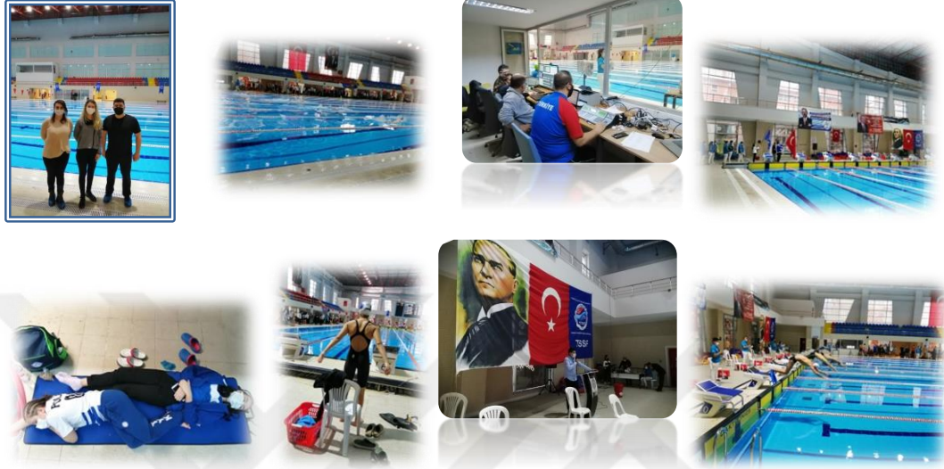
Resim 5. Organizasyon sırasında objektifime yansıyanlar

mesafelerde oluşu sebebiyle sorun yaşamadıklarını, valiliğin belirlediği metrekareye düşen insan sayısının hesaplayarak kişileri aldıklarını örneğin 25-40 kişinin girdiği jimnastik salonuna 10 kişi alındığı belirtilmiştir. Bu kısımda birimlerin uzak mesafeli oluşu bir karmaşaya sebebiyet oluşturmamaktadır ifadesi kullanılmıştır.