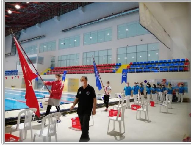
Resim 1. Organizasyon sırasında objektifime yansıyanlar