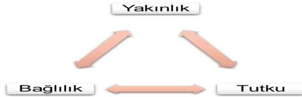
Şekil 1. Sternberg'in Aşk Üçgeni

Stenberg (1986) ise üçgen aşk yaklaşımı olarak adlandırılan yaklaşımı öne sürmüştür. Bu yaklaşıma göre aşk yakınlık, tutku ve bağlanma olarak adlandırılan üç farklı yapıdan oluşmaktadır. Bireyin öznel deneyimlerine bağlı olarak oluşan üçgen aşk biçimsel olarak bir üçgen ile ifade edilmektedir. Bu üçgenin tepe noktasında yakınlık, sağ köşede bağlılık ve sol köşede tutku yer almaktadır. Yakınlık bireyin aşk ilişkisinde kendini açması, karşısındakine kendini yakın hissetmesi ve bağlanması ile ilişkilidir. Yakınlık bileşeni, sevgi dolu ilişkilerde yakınlık duygularını ifade eder. Bu nedenle, esasen sevgi dolu bir ilişkide sıcaklık deneyimine yol açan duyguları kapsar. Bağlılık bireyin aşık olmaya ilişkin kararı ve ilişkiyi devam ettirmek için harcadığı çabalarla ilişkilidir. Bağlılık bileşeni, sevgi dolu bir ilişkinin varlığı ve olası uzun vadeli bağlılığı hakkında karar vermede yer alan bilişsel unsurları kapsamaktadır. Tutku ise bireyin partnerini cinsel yönden çekici bulması, ona karşı yoğun duygular hissetmesi ve romantizm ile ilişkilidir. Tutku bileşeni, sevgi dolu bir ilişkide tutku deneyimine götüren motivasyon kaynaklarını ve diğer uyarılma biçimlerini kapsamaktadır (Eren, 2019; Steinberg, 1986).