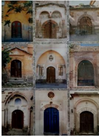
Şekil 4. Sinasos Kapıları

Estetik olgusu göreceli ve tartışmaya açık bir kavramdır. Bu sebeple birçok kesime göre bu değer değişiklik göstermektedir. Bu konuda bilirkişiler tarafından yapılmış çeşitli değerlendirmeler mevcuttur. Birçok kaynakta belirtildiği gibi bu ölçüt için yapı ve çevrelerinin güzel olması özelliği esas alınmaktadır. Nesnel bir değerlendirme olmamakla birlikte her zaman tartışmaya açık bir konudur. Değişebilir bir ölçüt olması ile birlikte, konusunda uzman kişiler tarafından değerlendirme yapılması her zaman daha doğru kabul edilmektedir.