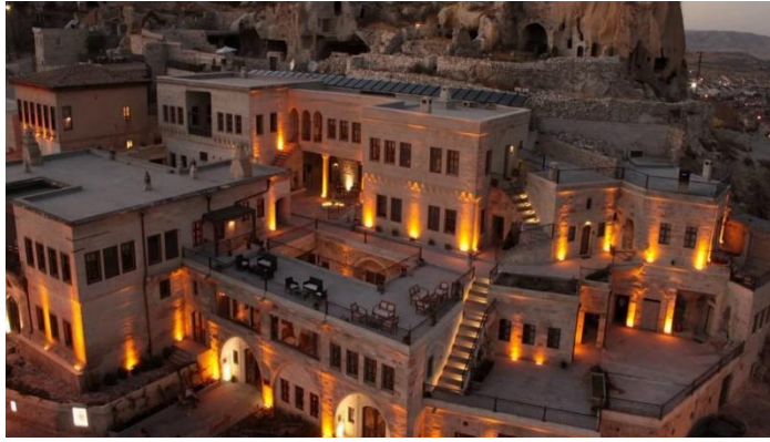
Şekil 8. Fresco Cave Suites (Fresco Cave Suites, 2020)

Bu bağlamda grup değeri olarak Ürgüp'de Fresco Cave Suites olarak bilinen yapı örnek olarak incelenebilir. Otel, 3 farklı konağın bir araya getirilmesiyle oluşturulmuştur. Mimari yapı, 18. Yüzyıl Osmanlı Mimarisi özelliklerini taşımaktadır. Yaklaşık 150 yıllık orijinal fresklerle bezenerek yapının özgünlüğü korunmuştur (Şekil 8).