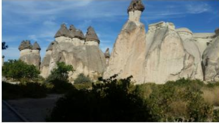
Şekil 12. Peribacaları

sertleşmiştir. Bu bağlamda peribacalarının oluşumuna ilk olarak bu lavlar sebep olmuştur. Mitolojiye göre, Göreme yöresinde eski zamanlarda peribacalarında perilerin yaşadığına inanılmaktadır. Burada yaşayan perilerin ise insanların gündelik yaşamlarındaki işlerine yardımcı olduğuna dair bir takım efsaneler olduğu bilinmektedir (Şekil 12).