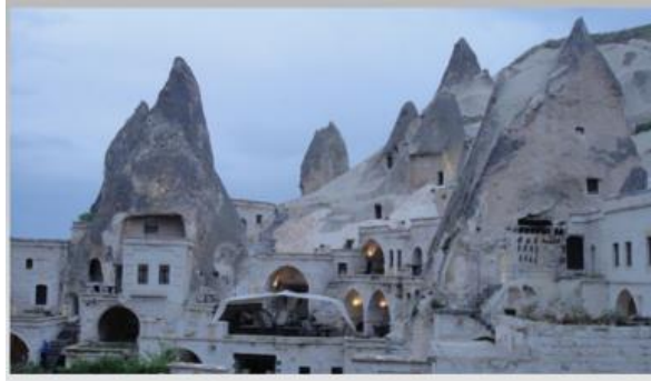
Şekil 7. Peri Bacaları Inn Hotel (Peri Bacaları Inn Hotel, 2020)

Kapadokya Bölgesi'ndeki tüm yapılar teklik değerine sahiptir. Bölgedeki teklik değere bir örnek olarak Peri Bacaları Inn Hotel olarak söz edilen yapıdan bahsedilebilir. Yapım koşulları ve doğal oluşum koşullarının yaşam şekillerini yönlendirmesi özellikleri teklik değeri oluşturmaktadır. Yüzlerce yıl önce oyulmuş peribacaları korunarak ve süreklilikleri sağlanarak bugün Peri Bacaları Inn Hotel olarak günümüzde varlığını sürdürmektedir. Kapadokya Bölgesi'nin özgün yerleşim yörelerinden biri olan Göreme'de yer almaktadır (Şekil 7).