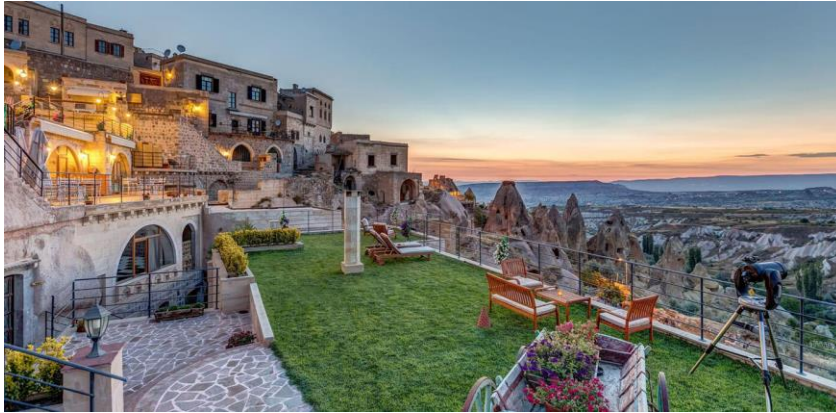
Şekil 5. Taşkonaklar (Taşkonaklar, 2020)

Bu ölçüt bağlamında Uçhisar'da Güvercinlik Vadisi'nin yamacında Taşkonaklar olarak bilinen yapı süreklilik değerine örnek olarak gösterilebilir. Yapı binlerce yıllık mağara ve taş evlerden oluşum göstermektedir. Yapının birbirinden bütünüyle farklı 24 odası bulunmaktadır. Bu odaların orijinal görüntüsü yenileme sürecinde tamamen korunmuştur. Hatta bazıları tamamen el işçiliğiyle bölgeye bağlı kalınarak şekillendirilmiştir. İnşaat sırasında her yapı parçası korunarak odaların geçmiş özelliklerinin günümüze aktarılmasına yardımcı olunmuştur (Şekil 5).