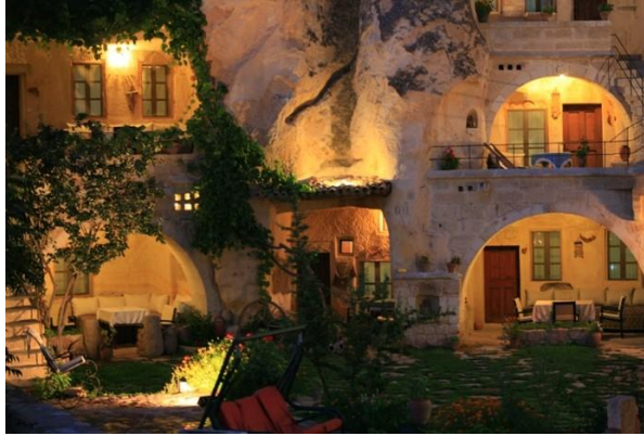
Şekil 3. Elkep Evi (Elkep Evi Cave Hotel, 2020)

Kapadokya bölgesindeki birçok yapı tarihi belge değer ölçütü kapsamına girmektedir. Ürgüp'te Elkep Evi olarak bilinen yapı bunlardan biridir. Geçmişte insanlar bu yapıyı barınma amacı ile yapmışlardır. Yapının 14 tarihi kayaya oyma odası bulunmaktadır. Yapı geçmiş dönemde konut olarak kullanılırken günümüzde butik otel işleviyle varlığını sürdürmektedir. Cephe yüzeylerinde kesme taş işçiliği hâkimdir. İç mekânı ise dönemin tarihini yansıtır şekilde düzenlenerek geçmişle günümüz arasında bir bağ kurmaktadır. Eski olma özelliği taşıyan bu değer ölçütü yapının tahrip birlikte yok olmasına göz yumulmayarak titizlikle restorasyon sürecinden geçirilmiştir. Eski kimliği bozulmayarak yeni döneminde varlığını sürdürmesi sağlanmıştır (Şekil 3).