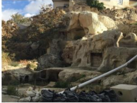
Şekil 11. Oyma Mekânlar

Kapadokya Bölgesi'ndeki yığma, oyma, yarı oyma oluşumların her biri teknik değer özellikleri taşımaktadır. Yapılan oyma mekânlar o dönemde yaşayan insanların kendi el emeği ile oyularak ortaya çıkarttıkları yaşam alanlarıdır. Yığma yapılarda ise pencere ve balkon demirlerinde yapılmış motif desenler, kapı kolları, duvar freskleri bu değer içerisinde incelenebilmektedir (Şekil 11).