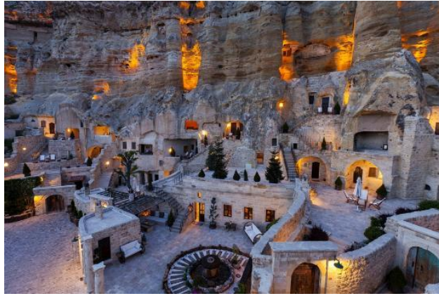
Şekil 9. Yunak Ev (Yunak Ev, 2020)

Kapadokya Bölgesi'ndeki tüm yapılar geleneksel değer ölçütüne sahiptir. Bu değere bir örnek olarak bölgedeki Yunak Ev verilebilir. Yapı, yamaçlardaki kayalıklara oyularak inşa edilmiştir. Yunak Ev, bölgeye has tuf ve kesme taş ile yapılan yapılar ile benzerlik göstermektedir. Gerek dış gerek iç düzenlemeler olarak bölgenin geleneksel kimliğini günümüzde de yansıtmaktadır. Geçmişin her bir ayrıntısı aynı şekilde şimdiki işlevine uyarlanarak günümüzde de kullanılmaktadır (Şekil 9).