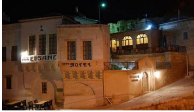
Şekil 10. Efsane Konağı (Efsane Konağı, 2020)

Kapadokya Bölgesi'ndeki eski konakların hepsi anı değeri taşımaktadır. Bu konakların birçoğu önce Rum halka daha sonra mübadele ile birlikte Anadolu'ya gelen mübadil Türklere ev sahipliği yapmıştır. Efsane Konağı olarak bilinen yapı anı değeri açısından incelenebilmektedir. 1800'lü yılların sonlarında yapılmış olan bu konağın eskiden bir Rum aile tarafından kullanıldığı bilinmektedir. Zamanla deformasyona uğrayan yapı renove edilerek otele dönüştürülmüştür. Bu konak mübadele olayına tanıklık etmiştir. Bu sebeple anı değeri taşımaktadır (Şekil 10).