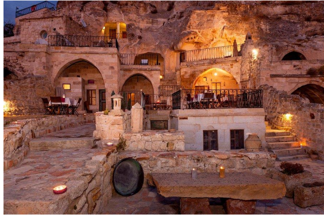
Şekil 6. Cappadocia Palace Hotel (Cappadocia Palace, 2020)

Özgünlük değer ölçütüne Cappadocia Palace Hotel örnek olarak gösterilebilmektedir. Otel Kapadokya Bölgesi'nde 19. Yüzyıl sonuna kadar bir kilisenin misafirhanesi olarak hizmet vermeye devam etmiştir. Günümüz şartlarında ise özgünlüğü tamamen korunarak bir otel işlevi kazandırılmıştır (Şekil 6).