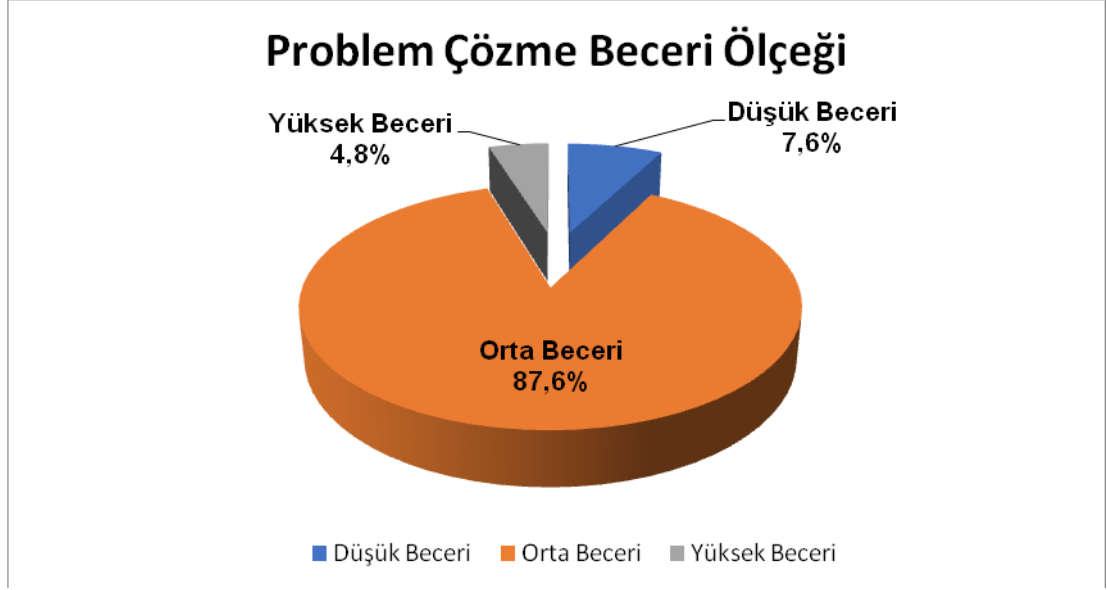
Grafik 5.1: Katılımcıların Problem Çözme Beceri Ölçeğine Göre Dağılımı