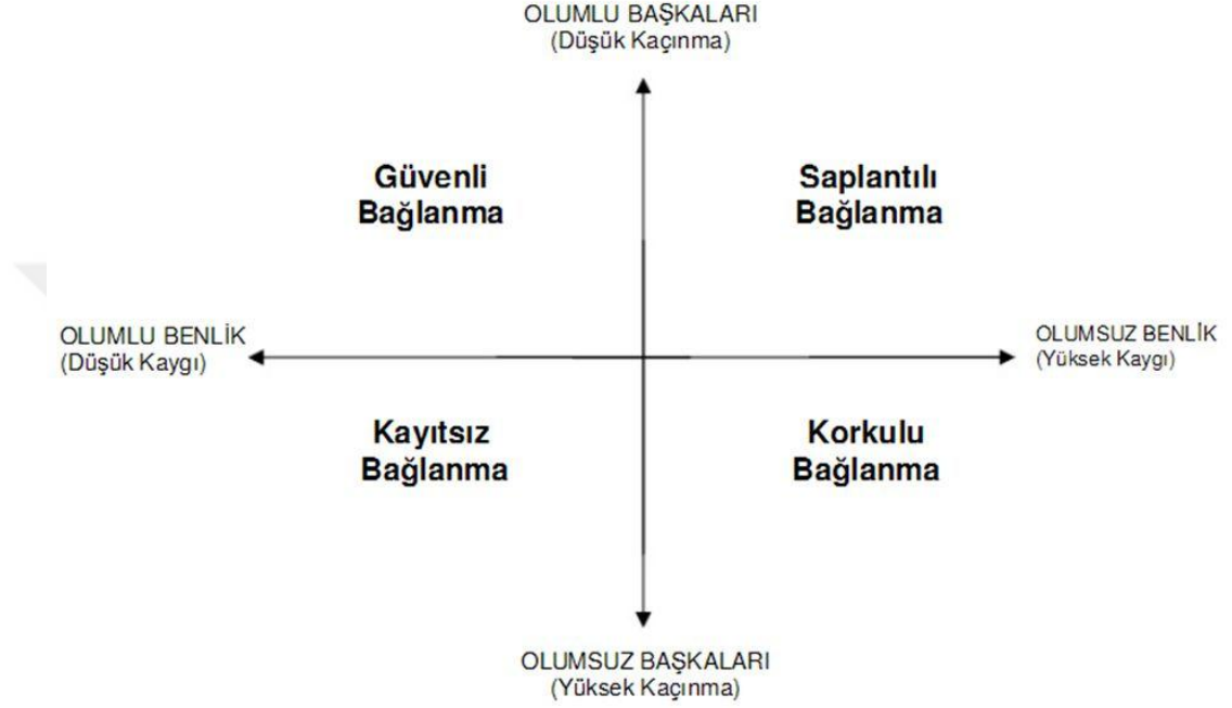
Şekil.2: Dörtlü Bağlanma Modeli 47