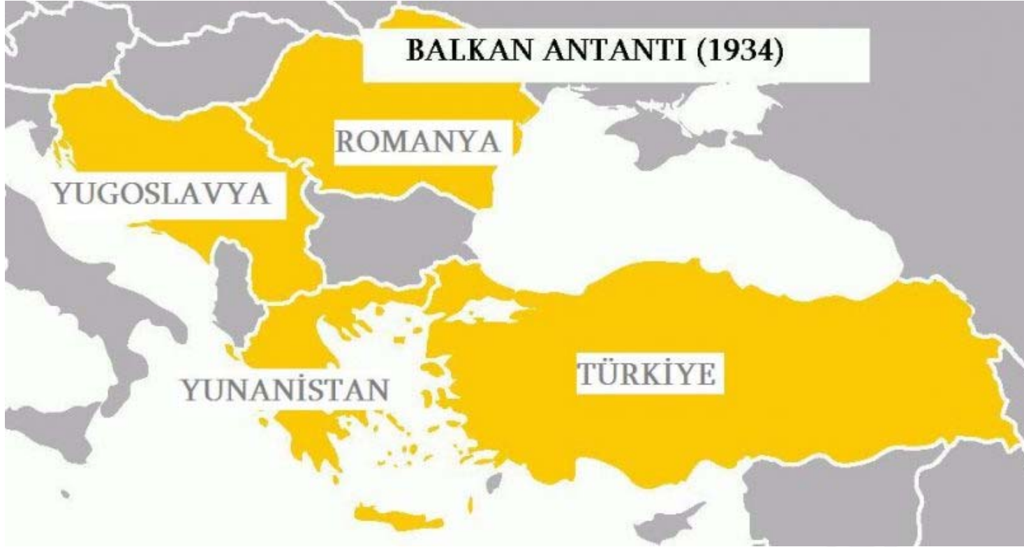
Balkan Antantı üye ülkeleri