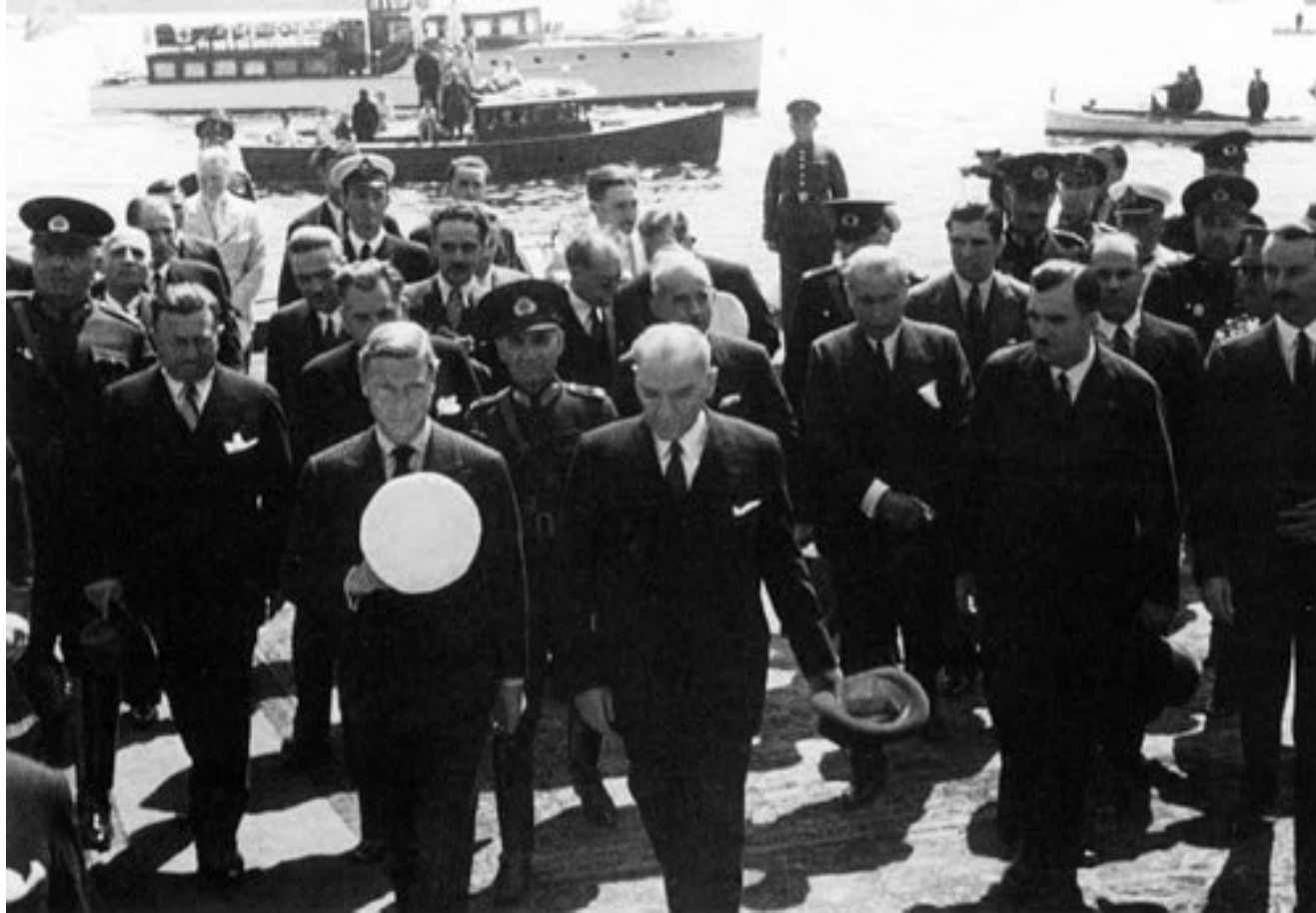
Atatürk ve İngiltere Kralı VIII. Edward, İstanbul, 4 Aralık 1936