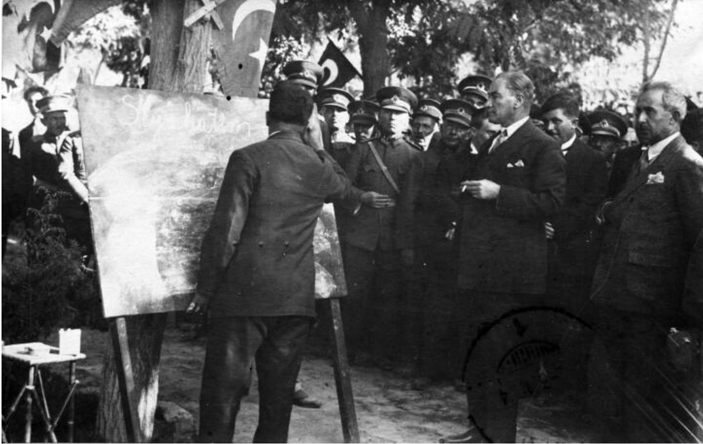
Başöğretmen Gazi Mustafa Kemal Sivas'ta yeni alfabeyi öğretiyor, 1928.