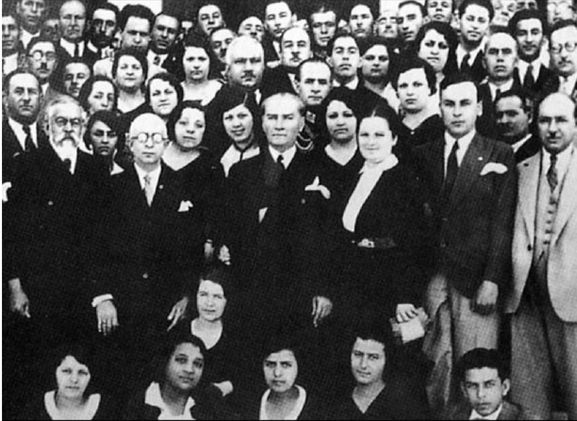
Türk Tarih Kurumu'nun kuruluşu 1931