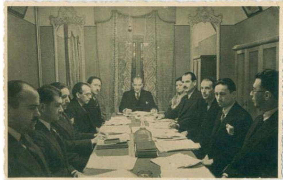
Türk Dil Kurumu toplantısı, 1933.