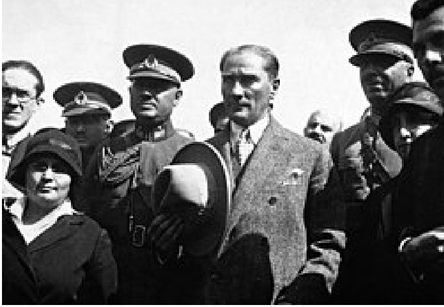
Gazi Mustafa Kemal şapkanın tanıtımı için İzmir'de 11 Ekim 1925