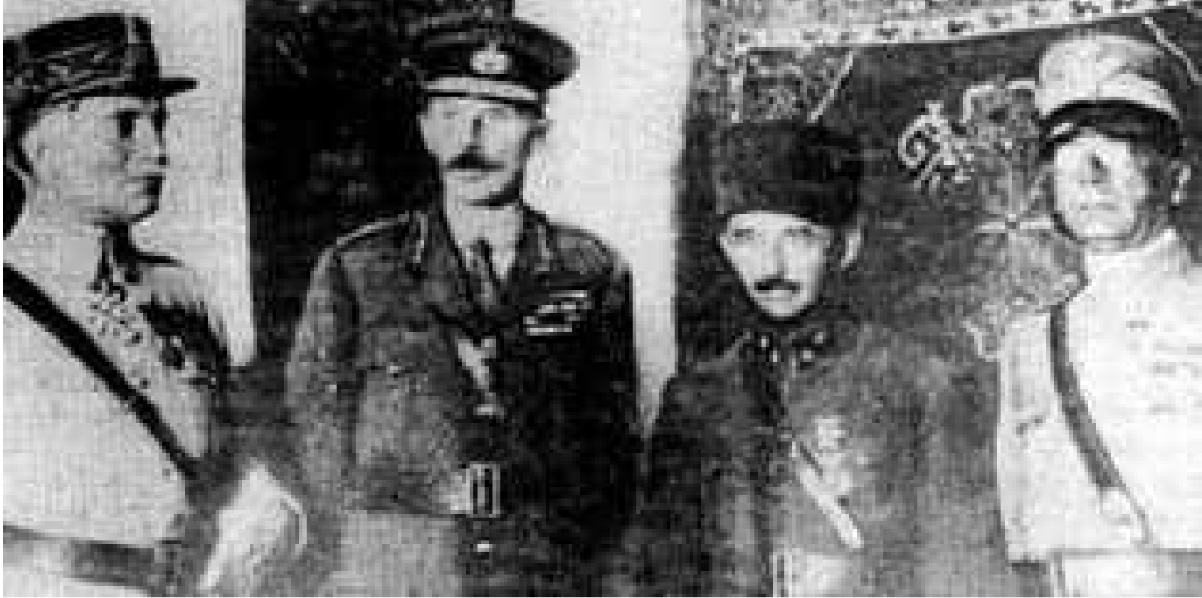
Mudanya Ateşkes Antlaşması'nı imzalayan heyet başkanları