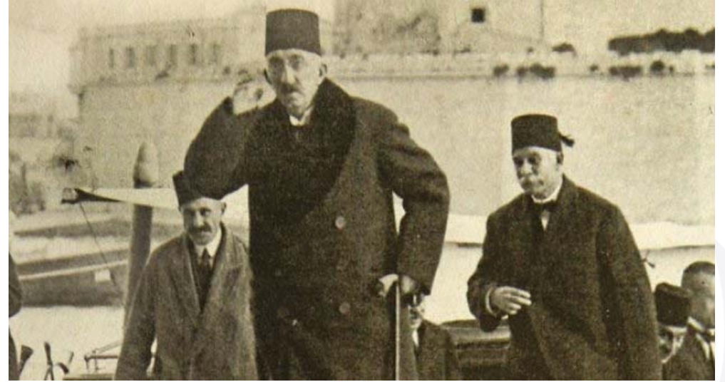
Son Osmanlı sultanı Vahdettin