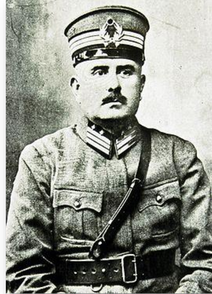
Doğu Cephesi Komutanı Kâzım Karabekir Paşa