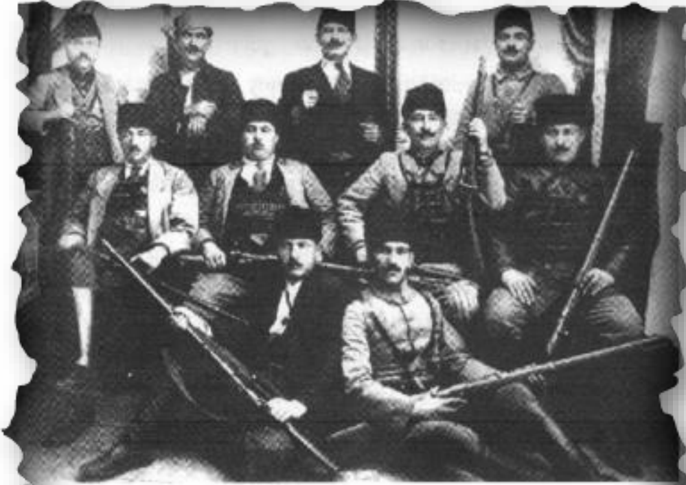
Kuvâ-yi Milliyecilerden Bir Grup

Kuvayi Milliye teşkilâtı önce Güney Cephesi'nde Fransızlara karşı, daha sonra İzmir'de Yunan işgaline karşı örgütlenmiştir.