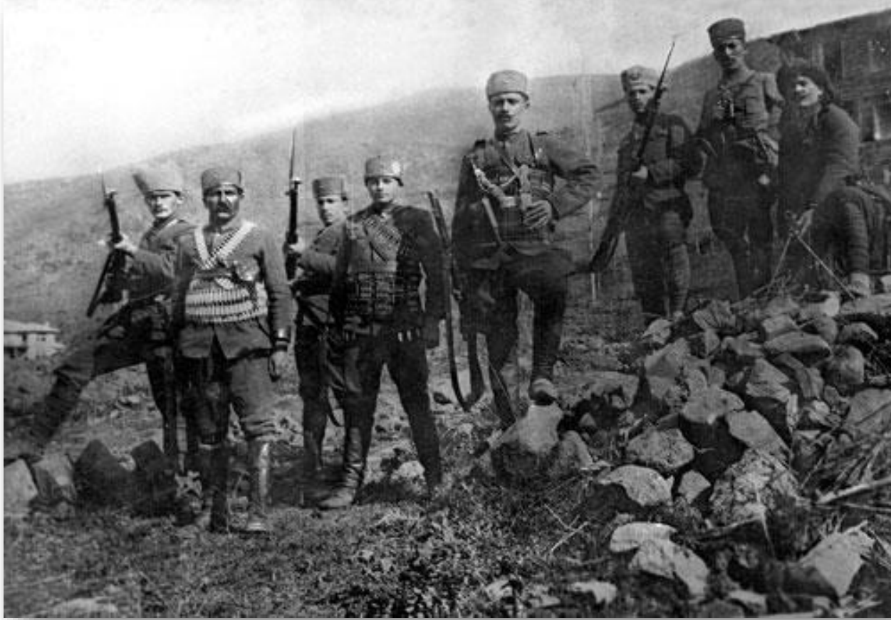
Anadolu'nun işgaline karşı kurulan Kuvâ-yi Milliye milisleri.

Mustafa Kemal Paşa Kuva-yi Milliye'nin kuruluşunu şöyle açıklar: