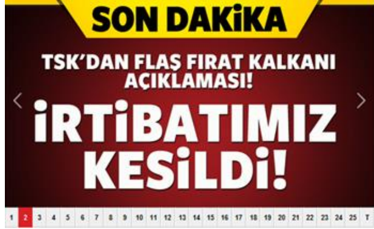
Resim-68 haber7.com, 29.11.2016

Aynı haberin Hürriyet internet sitesindeki başlığında ise, irtibat kesilen 2 askerden açık bir ifade ile bahsedilmektedir. (Bkz. Resim-69)