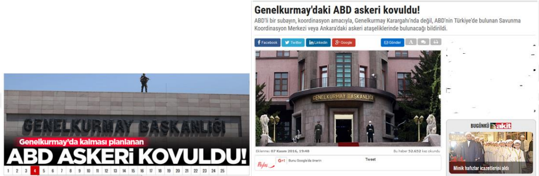
Resim-14 yeniakit.com.tr, 07.11.2016 Resim-15 yeniakit.com.tr, 07.11.2016 (1)

zaten bulunmamaktadır. Yeni Akit buna rağmen başlığında “Genelkurmay’da kalması planlanan ABD Askeri kovuldu” biçiminde bir ibare kullanmıştır. Haberin içeriği için tıklandığında ise, sitenin kendisinin de açık şekilde başlığı tekzip eden bir yazı ortaya çıkmaktadır. Resim 15’te verilen bu içerikte subayın Genelkurmay’da zaten hiç bulunmadığı açık bir dille belirtilmektedir. Dolayısıyla haberin başlığında yer alan kovulmak kelimesinin ne haberle ne de haberin sitede yer alan içeriğiyle bir ilgisi olmadığı görülmektedir. Kovuldu! ibaresi balığa eklenerek sansasyonel bir hava oluşturulmuştur.