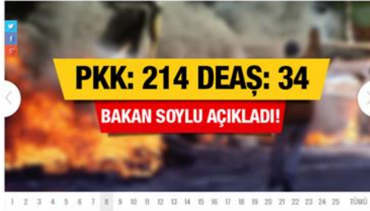
Resim-63 internethaber.com, 23.11.2016

23 Kasım 2016 tarihinde İçişleri Bakanı Süleyman Soylu tarafından 2016 yılı içinde engellenen terör saldırıları hakkında bir açıklama yapılmış ve engellenen DEAŞ ve PKK saldırıları hakkında sayısal veriler verilmiştir. İnternethaber internet sitesinde bu haberin başlığı şu şekilde yer almıştır: “PKK: 214 DEAŞ: 34 Bakan Soylu açıkladı” Bu başlığın fonunda ise özellikle bulanıklaştırılmış bir patlama görüntüsü kullanılarak haberin içeriği ile görsel arasında bir anlam ilişkisi kurulmaya çalışılmıştır. Ancak haberin başlığı yeterince açık değildir. Verilen rakamların ne olduğunu kestirmek ise oldukça güçtür. (Bkz. Resim-63)