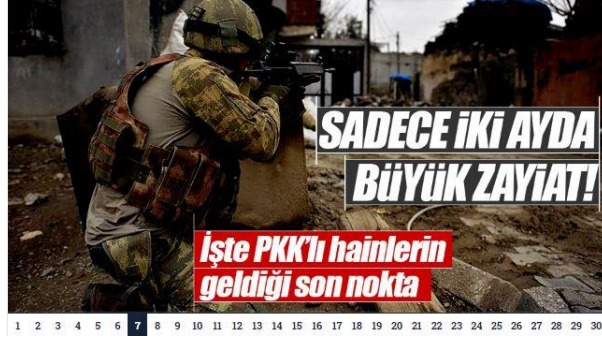
Resim-2 sabah.com.tr, 01.11.2016

1 Kasım 2016 tarihli Milliyet internet sitesi haber başlıklarında “ Bakan’dan Flaş Açıklama... Her Şeye Hazır Olmalıyız... ” şeklinde bir başlık yer almıştır. Başlıktan açıklamayı yapan Bakan’ın kim olduğu ve ne konuda hazırlıklı olunması gerektiği hiçbir şekilde anlaşılmamaktadır. Ayrıca başlıkta konuyla ilgili çağrışım yapacak görsel bir öğeye de yer verilmemiştir. “ Her şeye hazır olmalıyız... ” yazısı siyah fon üzerine sarı renkle yazılarak dikkat çekmesi ve merak uyandırması sağlanmaya çalışılmıştır. (Bkz. Resim 3) Açıklamayı yapan Bakan’ın Milli Savunma Bakanı Fikri Işık ve haberin konusunun da Türkiye’nin güney sınırlarında yaşanan askeri hareketlilik sebebiyle sınıra sevk edilen askeri birlikler olduğu, başlığa tıklanıp haberin yer aldığı sayfaya girilince ortaya çıkmaktadır. Onlarla ifade edilen sayıda bakanın bulunduğu ülkemizdeki her bakanın sorumluluk sahası düşünüldüğünde haberin neyle ilgili olduğunu kestirmek oldukça zorlaşmaktadır.