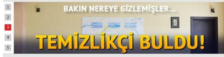
Resim-45 hurriyet.com.tr, 18.11.2016

Hürriyet internet sitesinde verilen bu başlığın bir benzeri de bir gün sonra 19 Kasım 2016 tarihli Haber 7 sitesinde yayınlanmıştır. Haberin başlığından ise, bulunan şeyin okul binasında ve lamba içine gizlenen bir şey olduğu anlaşılmaktadır. (Bkz. Resim-46) Fakat yine de, haberin içeriğindeki önemli bilginin terör örgütü olduğu düşünüldüğünde içeriği kısmen, fakat yeterince yansıtmadığı, daha çok merak uyandırmaya dayalı tık gazeteciliğine hizmet ettiği görülmektedir.