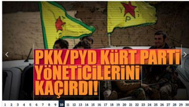
Resim-41 sabah.com.tr, 17.11.2016

Aynı haber 17 Kasım 2016 tarihli Sabah gazetesi internet sitesinde ise kaçırma eylemini yapan terör örgütünün ismi ve kaçırılan siyasetçilerin milliyetleri açıklanarak verilmiştir. Diğer yandan başlıkta kullanılan fotoğraf kaçırma eylemini gerçekleştiren PYD terör örgütünü net bir biçimde ortaya koymaktadır. (Bkz. Resim-41)