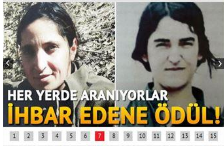
Resim-52 hurriyet.com.tr, 19.11.2016

Sabah gazetesi internet sitesi ise haber başlığında hem iki teröristin fotoğraflarını kullanmış hem de hangi örgüte üye olduklarını belirtmiştir. Sabah gazetesi internet sitesi ayrıca bu iki teröristin polis tarafından arandığını da haber başlığında yazıyla belirtmiştir (Bkz. Resim-53). Bu durumda Haber 7 sitesinde tamamen ve Hürriyet gazetesi sitesinde kısmen içeriği yansıtmayan biçimde oluşturulan haber başlığının Sabah gazetesi internet sitesinde içeriğe uygun bir enformasyon ile servis edildiği söylenebilir.