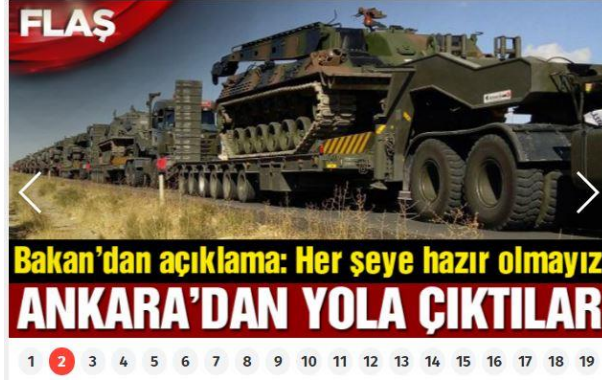
Resim-4 sozcu.com.tr, 01.11.2016

3 Kasım 2016 Ensonhaber internet sitesi haber başlığında “Kasım’da bir daha deneyeceğiz dedikleri de bu, tüm plan deşifre oldu” biçiminde verilen ve arka planda kullanılan şema ile de 15 Temmuz darbe girişimine gönderme yaptığını düşündüren bir habere yer verilmiştir. Oysa başlığa tıkladığında; haberin konusunun FETÖ üyesi oldukları gerekçesiyle tutuklu bulunanların hapisshaneden kaçış planları olduğu ortaya çıkmaktadır. Resim 5’i ele aldığımızda başlığın büyük kısmını kaplayan ve ne olduğu tam olarak anlaşılabilen bir taslak çizim dikkat çekmektedir. Ülke gündemini 15 Temmuz 2016 tarihinden beri işgal eden yeni bir kalkışma ihtimali basının gündeminde önemli oranda yer kaplamış ve toplumda endişeli bir bekleyiş oluşturmuştur. Ensonhaber internet sitesinin bu haber başlığı bu toplumsal kaygı üzerinden tıkl sayısı oluşturma çabası olarak açıklanabilir. Bu haber başlığından tutukluların firar tasarısını çıkarmak çok mümkün görünmemektedir.