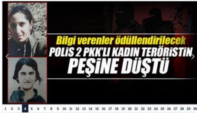
Resim-53

Sabah gazetesi internet sitesi ise haber başlığında hem iki teröristin fotoğraflarını kullanmış hem de hangi örgüte üye olduklarını belirtmiştir. Sabah gazetesi internet sitesi ayrıca bu iki teröristin polis tarafından arandığını da haber başlığında yazıyla belirtmiştir (Bkz. Resim-53). Bu durumda Haber 7 sitesinde tamamen ve Hürriyet gazetesi sitesinde kısmen içeriği yansıtmayan biçimde oluşturulan haber başlığının Sabah gazetesi internet sitesinde içeriğe uygun bir enformasyon ile servis edildiği söylenebilir.