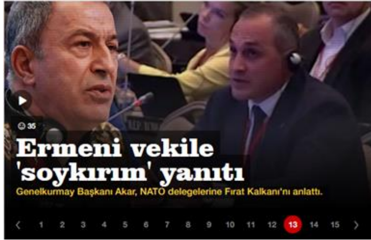
Resim-56 yenisafak.com, 20.11.2016

Tıpkı Yeni Şafak internet sitesi gibi Ensonhaber internet sitesi de bu haberin başlığını içeriğe uygun bir şekilde okuyucuya yansıtmiş ve görseli de haber retoriği ile uyumlu bir şekilde kullanmaktadır. ( Bkz. Resim-57)