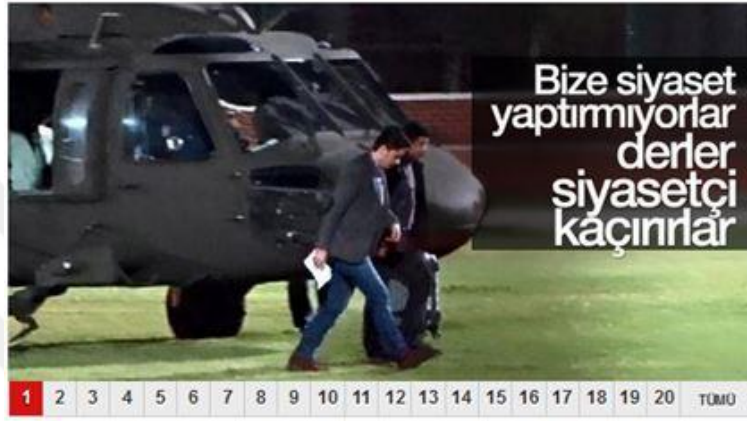
Resim-40 ensonhaber.com, 17.11.2016

17 Kasım 2016 Ensonhaber internet sitesinde tutuklu HDP başkanı Selahattin Demirtaş'ın bir görevliyle çekilmiş fotoğrafının yanında "Bize siyaset yaptırmıyorlar derler siyasetçi kaçırlılar" yazısıyla verilen haberde bahsedilen kaçırılmış siyasetçilerin, Kuzey Suriye'de faaliyet gösteren Yetiki partisi yetkilileri olduğu ve kaçırılan örgütün de PYD olduğu medyadaki diğer kaynaklardan anlaşılmıştır. Resim 40'ta verilen haber başlığında kullanılan fotoğraf ve yazının içeriği gerek PYD örgütünü, gerek de Kuzey Suriye'de bulunan siyasal partiyi açıklamaktan son derece uzak bir niteliğe sahiptir.