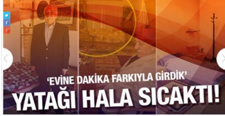
Resim-30

Bilindiği üzere 15 Temmuz darbe girişiminden sonra ABD’de bulunan veya darbe sonrası bu ülkeye kaçan FETÖ mensupları haber mecralarında önemli oranda yer bulmuşlardır. Bu isimler çoğunlukla vatan haini olmakla suçlanmış, FETÖ’ye verdikleri destekten vazgeçip Türk adaletine sığınmaları gerektiği dile getirilmiştir. ABD’de spor yaşamını sürdüren Türk basketbolcu Enes Kanter’de bu süreçte FETÖ üyesi olmakla suçlanan medyatik bir isim olarak haberlere sıklıkla konu olmuştur. 13 Kasım 2016 günü Haber 7 internet sitesinde “Kafası çalışmıyor demişim, beni haklı çıkardı” ibaresiyle yer alan haber başlığında Enes Kanter’in yakın plan resmi kullanılmıştır. Bu başlıktan yola çıkarak, başlıkta kullanılan yazının Enes Kanter tarafından bir başkası için mi, yoksa başka birisi tarafından Enes Kanter için mi söylendiği belirsizdir. Resim 31’de verilen başlığa tıklanıp haber sayfasına gidildiğinde ise; bu sözün Türkiye Basketbol Federasyonu Başkanı Hidayet Türkoğlu tarafından söylendiği anlaşılmaktadır. Haber başlığı belirsizlik oluşturarak merak uyandırma çabası içine girmiş, fakat haberin içeriğini büyük oranda yansıtmaktan uzaklaşmıştır.