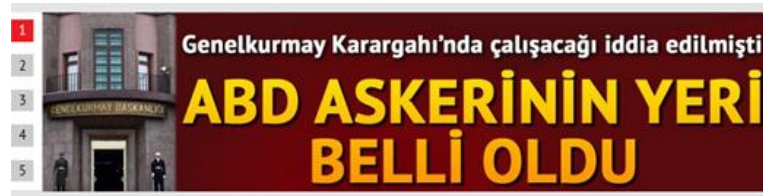
Resim-16 hurriyet.com.tr, 07.11.2016

Bu haber için diğer internet sitelerine bakıldığı zaman, subayla ilgili Türk Genelkurmay’ında bir görevlendirme yapılmadığı açıkça ortaya çıkmaktadır. Örneğin, Resim 16’da görülen 7 Kasım 2016 tarihli Hürriyet internet sitesinin haber başlığında ABD’li subayın Genelkurmay’da görevlendirilmediği anlaşılmaktadır. Yeni Akit’in haber başlığını tekzip eden bir başka örnek olarak Yeni Şafak internet sitesinin bu konudaki haber içeriği yeterince açıklayıcıdır. Resim 17’de verilen haber içeriğinde, subayın Genelkurmay’da görev yapacağı bilgisinin bir iddiadan ibaret olduğu açıkça ortaya konmaktadır.