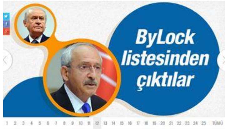
Resim-48 internethaber.com, 19.11.2016

İnternethaber internet sitesinde 19 Kasım 2019 tarihinde yayınlanan bir haberden CHP lideri Kemal Kılıçdaroğlu ve MHP lideri Devlet Bahçeli'nin korumalarının FETÖ'nün şifreli haberleşme programı olan ByLock kullanıcıları arasında olduklarının tespit edildiği anlaşılmaktadır. Fakat Resim 48'den yola çıkarak haber başlığının Devlet Bahçeli ve Kemal Kılıçdaroğlu'nun fotoğraflarının yanına "ByLock listesinden Çıktılar" yazısıyla birlikte verildiği görülmektedir. Gerçekte ByLock listesinde isimleri yer alanlar ise bu iki liderin korumalarıdır. Ancak haberin başlığındaki tasarım her iki parti liderinin adı geçen bu programı kullandıklarını ima edecek biçimdedir. Buradan yola çıkarak bu haber başlığında içeriğin uygun yansıtılmadığı söylenebilir.