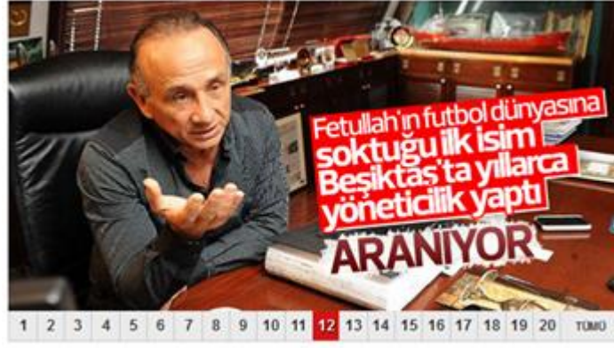
Resim-62 ensonhaber.com, 22.11.2016

23 Kasım 2016 tarihinde İçişleri Bakanı Süleyman Soylu tarafından 2016 yılı içinde engellenen terör saldırıları hakkında bir açıklama yapılmış ve engellenen DEAŞ ve PKK saldırıları hakkında sayısal veriler verilmiştir. İnternethaber internet sitesinde bu haberin başlığı şu şekilde yer almıştır: “PKK: 214 DEAŞ: 34 Bakan Soylu açıkladı” Bu başlığın fonunda ise özellikle bulanıklaştırılmış bir patlama görüntüsü kullanılarak haberin içeriği ile görsel arasında bir anlam ilişkisi kurulmaya çalışılmıştır. Ancak haberin başlığı yeterince açık değildir. Verilen rakamların ne olduğunu kestirmek ise oldukça güçtür. (Bkz. Resim-63)