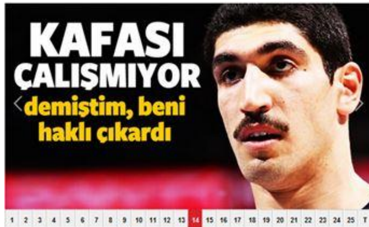
Resim-31 haber7.com, 13.11.2016

Bilindiği üzere 15 Temmuz darbe girişiminden sonra ABD’de bulunan veya darbe sonrası bu ülkeye kaçan FETÖ mensupları haber mecralarında önemli oranda yer bulmuşlardır. Bu isimler çoğunlukla vatan haini olmakla suçlanmış, FETÖ’ye verdikleri destekten vazgeçip Türk adaletine sığınmaları gerektiği dile getirilmiştir. ABD’de spor yaşamını sürdüren Türk basketbolcu Enes Kanter’de bu süreçte FETÖ üyesi olmakla suçlanan medyatik bir isim olarak haberlere sıklıkla konu olmuştur. 13 Kasım 2016 günü Haber 7 internet sitesinde “Kafası çalışmıyor demişim, beni haklı çıkardı” ibaresiyle yer alan haber başlığında Enes Kanter’in yakın plan resmi kullanılmıştır. Bu başlıktan yola çıkarak, başlıkta kullanılan yazının Enes Kanter tarafından bir başkası için mi, yoksa başka birisi tarafından Enes Kanter için mi söylendiği belirsizdir. Resim 31’de verilen başlığa tıklanıp haber sayfasına gidildiğinde ise; bu sözün Türkiye Basketbol Federasyonu Başkanı Hidayet Türkoğlu tarafından söylendiği anlaşılmaktadır. Haber başlığı belirsizlik oluşturarak merak uyandırma çabası içine girmiş, fakat haberin içeriğini büyük oranda yansıtmaktan uzaklaşmıştır.