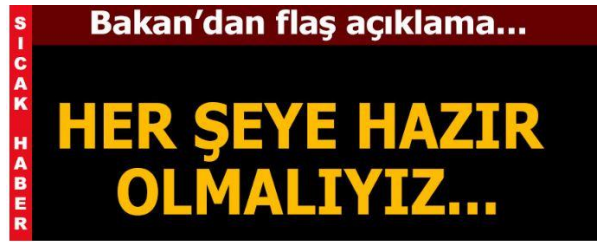
Resim-3 milliyet.com.tr, 01.11.2016

1 Kasım 2016 tarihli Milliyet internet sitesi haber başlıklarında “ Bakan’dan Flaş Açıklama... Her Şeye Hazır Olmalıyız... ” şeklinde bir başlık yer almıştır. Başlıktan açıklamayı yapan Bakan’ın kim olduğu ve ne konuda hazırlıklı olunması gerektiği hiçbir şekilde anlaşılmamaktadır. Ayrıca başlıkta konuyla ilgili çağrışım yapacak görsel bir öğeye de yer verilmemiştir. “ Her şeye hazır olmalıyız... ” yazısı siyah fon üzerine sarı renkle yazılarak dikkat çekmesi ve merak uyandırması sağlanmaya çalışılmıştır. (Bkz. Resim 3) Açıklamayı yapan Bakan’ın Milli Savunma Bakanı Fikri Işık ve haberin konusunun da Türkiye’nin güney sınırlarında yaşanan askeri hareketlilik sebebiyle sınıra sevk edilen askeri birlikler olduğu, başlığa tıklanıp haberin yer aldığı sayfaya girilince ortaya çıkmaktadır. Onlarla ifade edilen sayıda bakanın bulunduğu ülkemizdeki her bakanın sorumluluk sahası düşünüldüğünde haberin neyle ilgili olduğunu kestirmek oldukça zorlaşmaktadır.