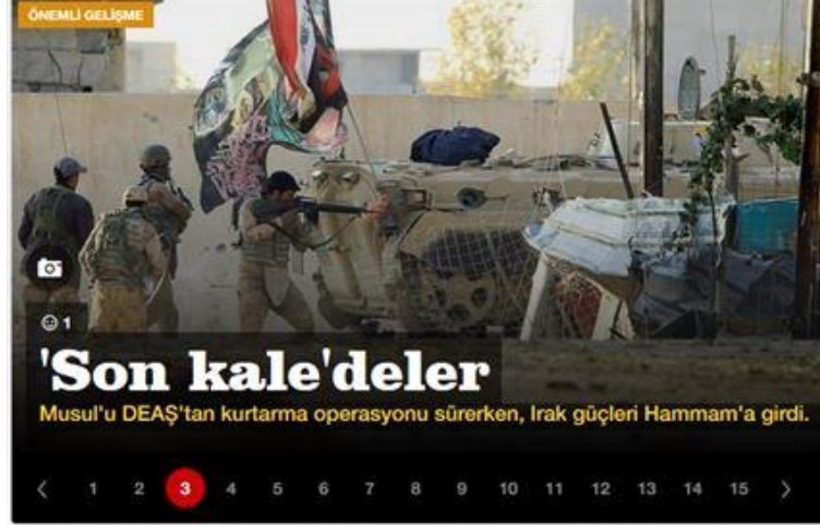
Resim-10 yenisafak.com, 05.11.2016

Haber 7 internet sitesindeki başlıktaki bilinmezlik hali, Yeni Şafak internet sitesindeki başlıkta yerini netliğe bırakmaktadır.