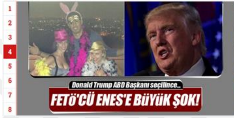
Resim-23 sabah.com.tr, 09.11.2016

Resim 23'e bakıldığında haberin başlığında kullanılan yazı şöyledir: "Donald Trump ABD Başkanı Seçilince... FETÖ'cü Enes'e Büyük Şok" Başlığa tıkladığında ise günün spor olaylarının tamamını barındıran bir içerik karşımıza çıkmaktadır. Diğer yandan başlıkta kullanılan fotoğrafta Enes Kanter sporcu kimliği yerine bambaşka bir fotoğrafla yansıtılmıştır. Oysa haberde vurgulanan içerik, siyaset ve sporla ilgilidir. Başlıkta kullanılan fotoğraf ise magazin fotoğrafı niteliğindedir. Bu bakımdan değerlendirildiğinde Enes Kanter'in fotoğrafı içerikten bağımsız durmaktadır. Üstelik başlıkta belirtildiği gibi Enes Kanter için bir şok durumu söz konusu olmayıp daha ziyade bunun bir beklenti ve temenni olduğu anlaşılmaktadır.