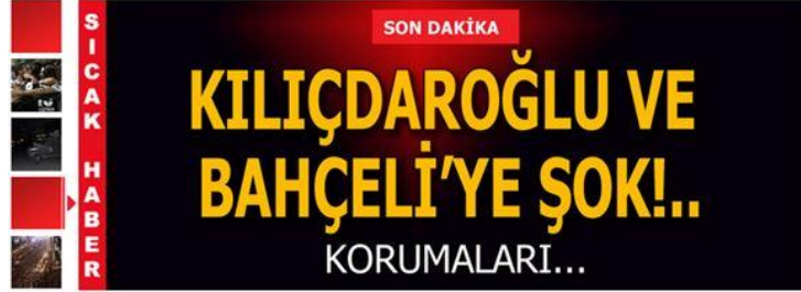
Resim-49

ifadelerine yer verilmekle birlikte; alt başlıkta geçen “Korumaları...” yazısı haberin kişilerinin direkt bu iki parti lideri olmadığını açıklar mahiyettedir. Bununla birlikte haberin asıl konusunun ByLock programı kullanımı olduğu düşünüldüğünde, Milliyet internet sitesindeki haber başlığının, İnternethaber sitesindeki kadar olmamakla birlikte içeriği yansıtmaktan yine de yoksun olduğu ifade edilebilir.