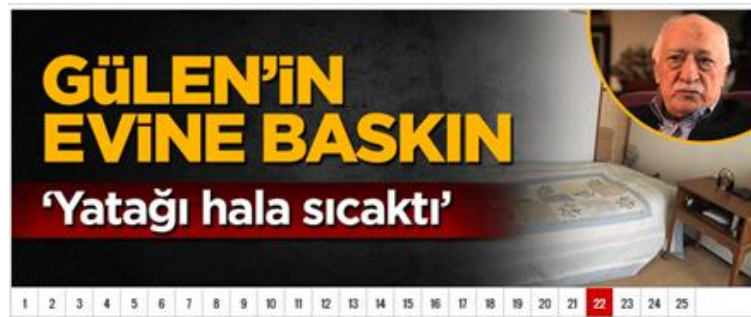
Resim-29 yeniakit.com.tr, 11.11.2016