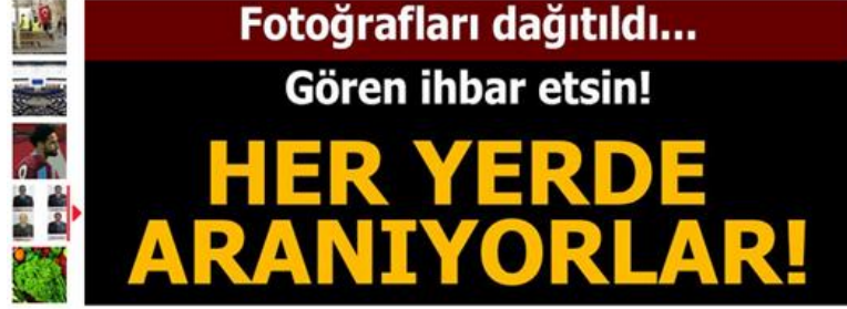
Resim-58 milliyet.com.tr, 21.11.2016

etsin! Her yerde aranıyorlar! " ibaresi kullanılmıştır. Bu ifadelerden de haberin içeriği hakkında aydınlatıcı bir bilgiye ulaşmak mümkün olmamakta, muğlak bir durum oluşmaktadır.