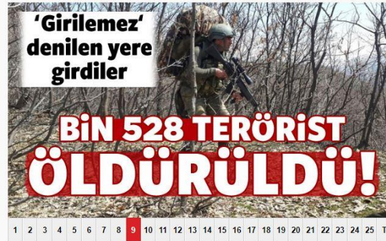
Resim-1 haber7.com, 01.11.2016

Haber 7 internet sitesinin 1 Kasım 2016 tarihli haberleri içinde “ Girilemez denilen yere girildiler, Bin 528 Terörist öldürüldü ” şeklinde bir başlığa yer verilmiştir. Resim 1’de görüldüğü üzere görsel olarak bir operasyon sırasında çekilen eli tetikte tam teçhizatlı asker fotoğrafı kullanılmıştır. Askerin civarındaki ağaçlarda yaprak bulunmaması görüntünün kullanıldığı tarihle tezat oluşturmayarak inandırıcılığını olumlu etkilemektedir. Haber başlığının yazısında öldürülen terörist sayısına dikkat çekmek için kırmızı renkli gölge efekti kullanılmıştır. Metni okuduğumuzda yapılan bir operasyonla girilemez denen bir bölgeye girilerek 1528 teröristin öldürüldüğü anlaşılmaktadır. Başlığa tıklandığında ise bu sayının Eylül ve Ekim 2016 tarihlerini kapsayan 2 ay boyunca öldürülen teröristlerin sayısı olduğu anlaşılmaktadır. Haber başlığı okuyucuda daha önce gerilmemiş bir bölgeye girilerek çok sayıda teröristin etkisiz hale getirildiği izlenimi uyandırmaktadır. Haberin içeriği ise tamamen yalan olmamakla birlikte gerçeği tam olarak yansıtmamaktadır. Başlık okuyucuda yüksek bir beklenti oluşmasına yol açmaktadır. Haber takipçisinin belki de daha önce onlarca kere okuduğu bu haberi bir istatistik veri olarak yeniden sunmaktadır.