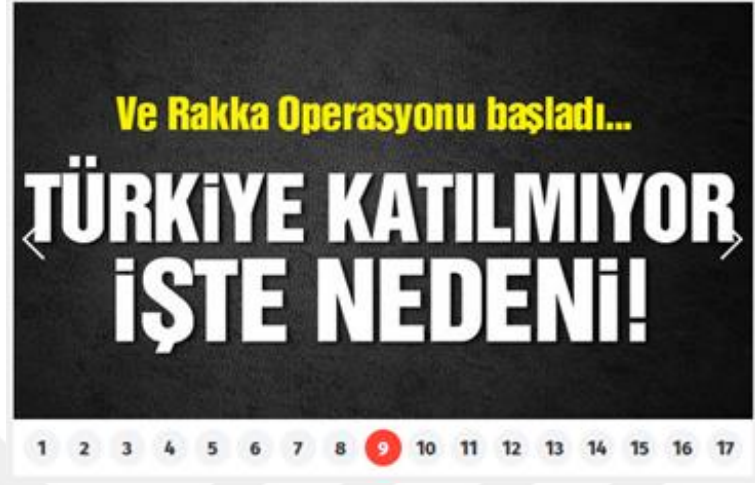
Resim-12 sozcu.com.tr, 06.11.2016

Aynı gün Sözcü internet sitesinde bu haber operasyonun hangi şehre yapıldığını açıkça yazarak içeriği başlıkta yansıtmıştır. Resim 12 incelendiğinde Operasyonun Rakka şehrine yönelik yapıldığı anlaşılmaktadır.