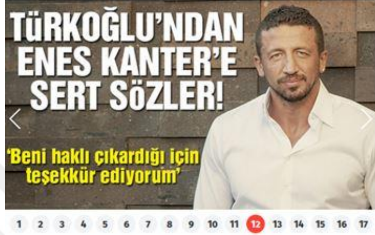
Resim-32 sozcu.com.tr, 13.11.2016

Hidayet Türkoğlu tarafından basketbolcu Enes Kanter için söylenen bu sözler araştırmanın örneklemimi oluşturan diğer haber sitelerinde de haber başlıklarına taşınmıştır. Resim 32'ye baktığımızda Sözcü'deki başlıkta sözleri söyleyen Hidayet Türkoğlu'nun ismi, resmi ve söylemi birlikte kullanılmıştır. Sözcü'de kullanılan bu başlık ise haberin içeriğini okuyucuya yansıtmaktadır.