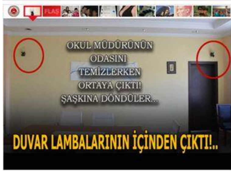
Resim-47

İnternethaber internet sitesinde 19 Kasım 2019 tarihinde yayınlanan bir haberden CHP lideri Kemal Kılıçdaroğlu ve MHP lideri Devlet Bahçeli'nin korumalarının FETÖ'nün şifreli haberleşme programı olan ByLock kullanıcıları arasında olduklarının tespit edildiği anlaşılmaktadır. Fakat Resim 48'den yola çıkarak haber başlığının Devlet Bahçeli ve Kemal Kılıçdaroğlu'nun fotoğraflarının yanına "ByLock listesinden Çıktılar" yazısıyla birlikte verildiği görülmektedir. Gerçekte ByLock listesinde isimleri yer alanlar ise bu iki liderin korumalarıdır. Ancak haberin başlığındaki tasarım her iki parti liderinin adı geçen bu programı kullandıklarını ima edecek biçimdedir. Buradan yola çıkarak bu haber başlığında içeriğin uygun yansıtılmadığı söylenebilir.