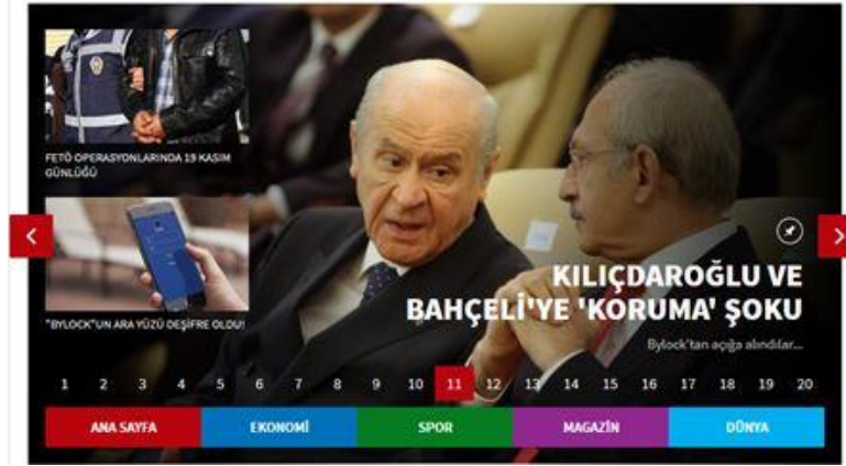
Resim-50 haberturk.com, 19.11.2016

ByLock haberi Habertürk gazetesi internet sitesinde ise içeriği yansıtacak biçimde oluşturulmuştur. Resim 50’de görüldüğü üzere fotoğraf olarak Bahçeli ve Kılıçdaroğlu’nun yan yana oturduğu bir resim kullanılmış, ayrıca başlık çerçevesi içine sol tarafta oluşturulan iki küçük pencere ile FETÖ ve ByLock ile ilintili resimler yerleştirilmiştir. Ayrıca başlık yazısı olarak da “Kılıçdaroğlu ve Bahçeli’ye Koruma Şoku” yazılmış; alt başlık olarak “ByLock’tan Açığa Alındılar...” ifadesi kullanılarak haber içeriği düzgün ve doyurucu bir biçimde yansıtılmıştır.