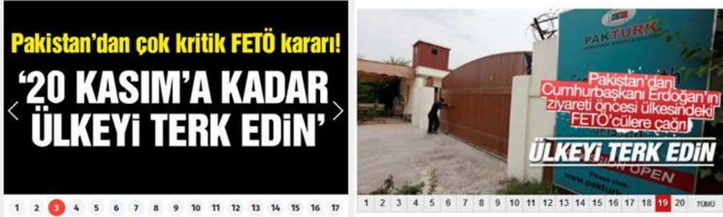
Resim-36 sozcu.com.tr, 15.11.2016 Resim-37 ensonhaber.com, 16.11.2016

16 Kasım 2016 günü Milliyet gazetesi internet sitesinde DEAŞ Terör örgütünün Irak'ın Nemrut kentinde tahrip ettiği heykellerle ilgili bir haber servis edilmiştir. (Bkz. Resim-38) Haberin başlığında "Şoke Eden Fotoğraflar... Bu Haliyle İlk Kez!" yazısı kayalar arasında poz vermiş bir savaşçı fotoğrafıyla birlikte verilmiştir. Kullanılan fotoğraf ve yazılardan yola çıkarak haberin konusunun DEAŞ'ın Tahrip ettiği heykellerle ilgili olduğunun tahmin edilmesi son derece güç olacaktır. Dolayısıyla kullanılan bu haber başlığı ile haber metni arasındaki ilişkinin oldukça sınırlı olduğu söylenebilir.