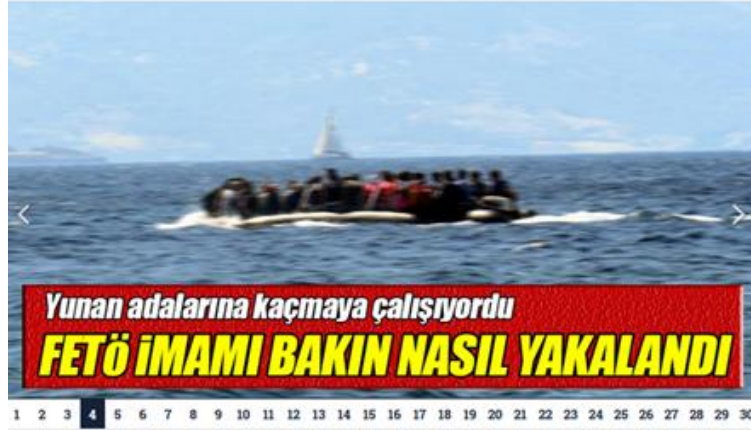
Resim-28