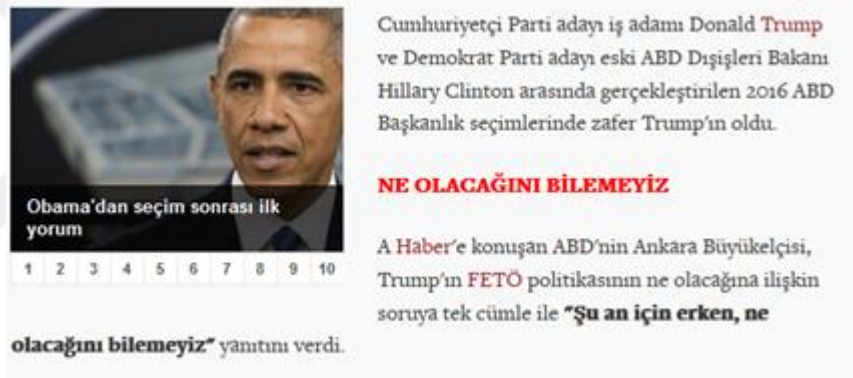
Resim-25 haber7.com, 09.11.2016 (1)

Gene Trump ve FETÖ ilişkisi Yeni Akit sitesinde de başlığa taşınmıştır. "Trump FETÖ'ye ne yapacak? ABD'den ilk Açıklama" yazısı ve Trump fotoğrafıyla verilen haber başlığından yola çıkarak okuyucuda Trump'un neler yapacağı beklentisi oluşturulmaktadır. (Bkz.Resim-26) Oysa başlığa tıklandığında haberin gövdesinde bunun bilinmediği ifade edilmektedir. Bu başlık okuyucuda hayal kırıklığı yaratmaktan başka bir anlam taşımamaktadır. Başlığa bakıldığı zaman okuyucu üzerinde yönlendirici bir etkisinin olduğu düşünülebilir.