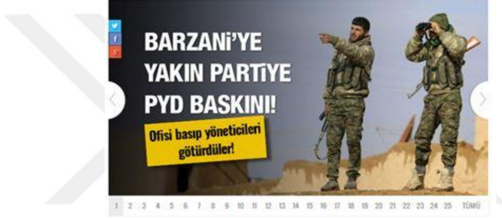
Resim-42 internethaber.com, 17.11.2016

Yine aynı haber İnternethaber internet sitesinde “ Barzani’ye Yakın Partiye PYD baskını, Ofis Basıp Yöneticileri Götürdüler ” yazısıyla haber başlığı yapılmış ve yazının arka planında ise 2 askerin yer aldığı bir fotoğrafa yer verilmiştir. (Bkz. Resim-42) İnternethaber bu başlığıyla Ensonhaber sitesinin aksine haberin başlığı ile içeriği arasında okuyucuyu bilgilendirecek ve yönlendirecek doyurucu bir ilişki oluşturmaktadır. Diğer taraftan Ensonhaber ’in kullandığı yazı ve fotoğraf ise anlam ve içerik karmaşası yaratmaktadır. Demirtaş’ın Türkiye’de tutuklanıp ceza evine konulmasıyla PKK ve PYD terör örgütlerinin tüm eylemleri arasında ilişki kurulmaya çalışılmıştır. Her iki terör örgütünün işlediği suçlar adeta Selahattin Demirtaş üzerine yıkılmıştır. Suriye’de meydana gelen bir kaçırma olayı bile Demirtaş’ın tutukluluğunun haklı bir delili gibi yansıtılmaya çalışılmıştır.