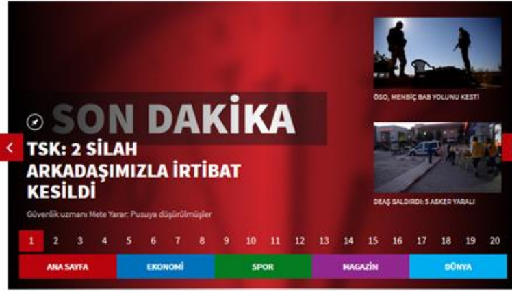
Resim-70 haberturk.com, 29.11.2016

Aynı haberin Haber 7, Hürriyet ve Habertürk internet sitelerindeki başlık kullanımlarına bakıldığında birbirinden farklılık gösterdiği görülmektedir. Bazı siteler haber değerini yansıtan başlıklar kullanmayı tercih ederken, bazı siteler ise haber niteliğini ve içeriğini yansıtmayan, eksik enformasyon içeren başlık kullanımını tercih etmektedir.