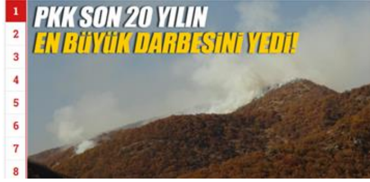
Resim-21 sabah.com.tr, 08.11.2016 (1)

Yeni Akit ve Sabah internet sitelerinde olduğu gibi bu haber Sözcü internet sitesinde de verilmiştir. Üstelik Sabah'ta yer alan görselin aynısı kullanılmıştır. Bu durum haberin ajans kaynaklı olma ihtimalini güçlendirmektedir. Resim 22'den yola çıkarak Sözcü'de kullanılan başlığın PKK kelimesi yerine Örgüt kullanılması dışında Sabah'takiyle aynı olduğu görülmektedir. Buradaki içerik yansıtma sorunu yukarıda Sabah internet sitesinde anlatılan sorunla aynıdır.