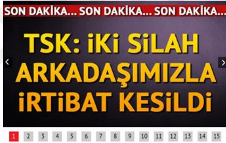
Resim-69 hurriyet.com.tr, 29.11.2016

Aynı haberin Hürriyet internet sitesindeki başlığında ise, irtibat kesilen 2 askerden açık bir ifade ile bahsedilmektedir. (Bkz. Resim-69)