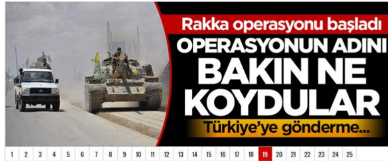
Resim-13

Sözcü internet sitesinin benzeri bir diğer başlık, Yeni Akit internet sitesinin 6 Kasım 2016 tarihli haber başlıklarından birinde yer almıştır. Yeni Akit internet sitesinin başlığında da Sözcü'de olduğu gibi Rakka isminin verildiği Resim 13'te açıkça görülmektedir.