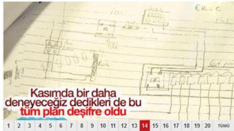
Resim-5 ensonhaber.com, 03.11.2016

3 Kasım 2016 Ensonhaber internet sitesi haber başlığında “Kasım’da bir daha deneyeceğiz dedikleri de bu, tüm plan deşifre oldu” biçiminde verilen ve arka planda kullanılan şema ile de 15 Temmuz darbe girişimine gönderme yaptığını düşündüren bir habere yer verilmiştir. Oysa başlığa tıkladığında; haberin konusunun FETÖ üyesi oldukları gerekçesiyle tutuklu bulunanların hapisshaneden kaçış planları olduğu ortaya çıkmaktadır. Resim 5’i ele aldığımızda başlığın büyük kısmını kaplayan ve ne olduğu tam olarak anlaşılabilen bir taslak çizim dikkat çekmektedir. Ülke gündemini 15 Temmuz 2016 tarihinden beri işgal eden yeni bir kalkışma ihtimali basının gündeminde önemli oranda yer kaplamış ve toplumda endişeli bir bekleyiş oluşturmuştur. Ensonhaber internet sitesinin bu haber başlığı bu toplumsal kaygı üzerinden tıkl sayısı oluşturma çabası olarak açıklanabilir. Bu haber başlığından tutukluların firar tasarısını çıkarmak çok mümkün görünmemektedir.