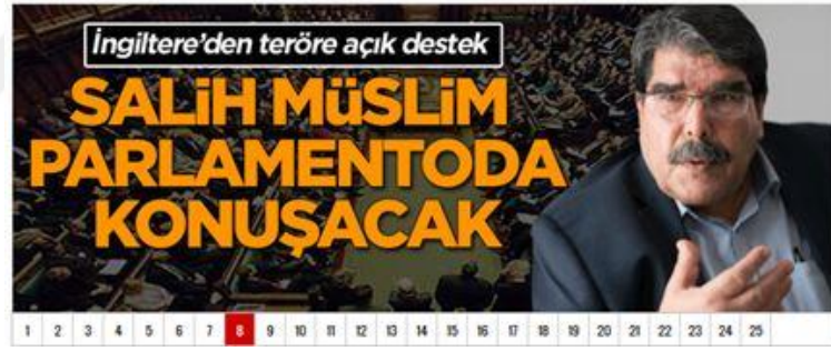
Resim-44 yeniakit.com.tr, 17.11.2016

Milliyet gazetesinde yanıltıcı biçimde başlıklandırılan Salih Müslim haberi, aynı tarihli Yeni Akit sitesinde konuşma yapacağı ülkenin ismi ve kendi isminin yer aldığı bir başlık kullanımı ile verilerek haber içeriği ile uyum sağlanmıştır. (Bkz. Resim-44)