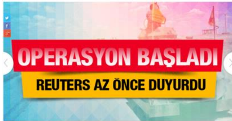
Resim-11

6 Kasım 2016 tarihli İnternethaber internet sitesinin haber başlıklarından birini oluşturan ve “Operasyon Başladı Reuters Az Önce Duyurdu” yazısıyla verilen başlığın arka planında çok dikkatli bakılmadıkça anlaşılabilen bir kamyonet ve üzerinde bir asker silüeti görülmektedir. Resim 11’e bakıldığında fondaki resmin net bir şekilde verilmeyip, renkli bir fon içinde silikleştirildiği göze çarpmaktadır. Resim hakkında tahmin yürütmek çok kolay değildir. Başlığın yazısı ise operasyonun kimler tarafından, kimlere yönelik olarak başlatıldığını açıklamaktan son derece uzaktır. Başlıkta kullanılan yazılar sarı ve kırmızı renkli dikkat çekici kalın fonlar üzerine beyaz ve siyah renkte yazılmıştır. Çarpıcı bir tasarımın hâkim olduğu başlığa tıklanıp asıl haber sayfasına geçildiğinde ise konunun DEAŞ terör örgütünün üslendiği yerlerden biri olan Rakka bölgesine yapılan operasyon olduğunu görmekteyiz. Haberin başlığı haber içeriğini yansıtmada başarılı değildir.