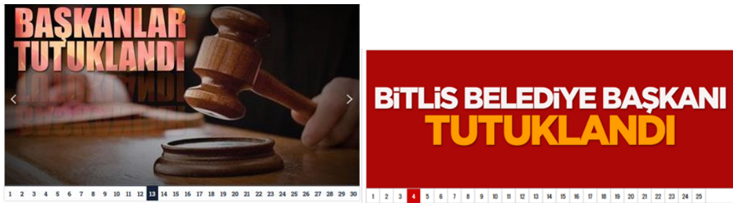
Resim-65 sabah.com.tr, 25.11.2016

25 Kasım 2016 tarihinde Bitlis Belediyesi Eş Başkanlarının tutuklanması Sabah internet sitesinde “ Başkanlar Tutuklandı ” yazısı ve adaleti simgeleyen mahkeme tokmağı görseli ile birlikte başlığa taşınmıştır.(Bkz. Resim 65) Temelde haber içeriği ile başlık arasında önemli bir farklılık bulunmamakla birlikte haberin kapsamının çok geniş tutulduğu, dolayısıyla başlığın tık haberciliğine hizmet ettiği görülmektedir. Başkanlar tutuklanmıştır, fakat bunların hangi kurumun başkanları olduğu açıklanmamaktadır. Başlığın kapsamının çok geniş tutulması haber başlığına bir muğlaklık katmaktadır. Haberin retoriğinin içerikten ziyade görselle güçlendirilmeye çalışıldığı söylenebilir. Aynı başlık Yeni akit gazetesi internet sitesinde ise “ Bitlis Belediye Başkanı Tutuklandı ” başlığı ile verilmiştir. (Bkz. Resim-66) Sabah gazetesi internet sitesindeki bilinmeyen başkan ile buradaki Bitlis Belediye Başkanı arasında sınırlılık bakımından devasa bir farklılık bulunmaktadır. Sabah gazetesi sitesindeki Başkan sınırları belirsiz bir başkandır. Bu bağlamda bu başlık kullanımı ile okuyucunun yeterli enfomasyona ulaşamadığı belirtilebilir.