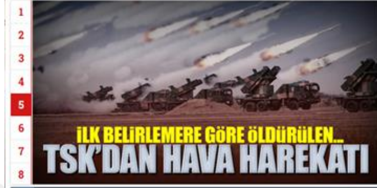
Resim-19

aksine, karadan fırlatılan roket görüntülerinin yer aldığı bir fotoğraf kullanılmıştır. Fotoğraf burada içeriği destekleyen ve açıklayan bir öge olarak kullanılmamış, yalnızca iyi bir saldırı fotoğrafı olduğu için başlıkta yer verilmiştir. Bu başlık kullanılan fotoğraf bakımından içerik ile ayrılmaktadır.