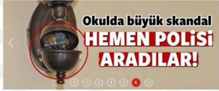
Resim-46 haber7.com, 19.11.2016

Hürriyet internet sitesinde verilen bu başlığın bir benzeri de bir gün sonra 19 Kasım 2016 tarihli Haber 7 sitesinde yayınlanmıştır. Haberin başlığından ise, bulunan şeyin okul binasında ve lamba içine gizlenen bir şey olduğu anlaşılmaktadır. (Bkz. Resim-46) Fakat yine de, haberin içeriğindeki önemli bilginin terör örgütü olduğu düşünüldüğünde içeriği kısmen, fakat yeterince yansıtmadığı, daha çok merak uyandırmaya dayalı tık gazeteciliğine hizmet ettiği görülmektedir.