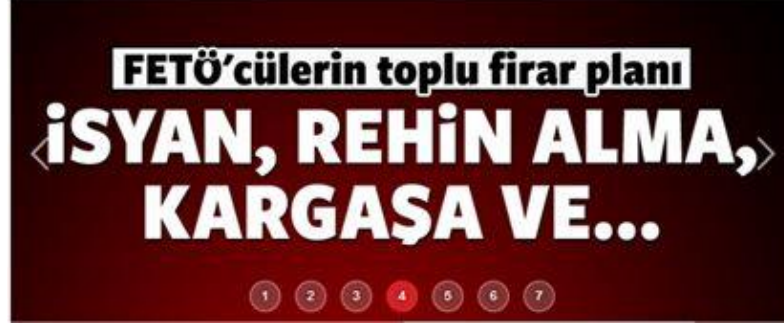
Resim-6

aşağısında yer alan “İsyan, rehin Alma, Kargaşa ve...” yazısıyla birlikte düşünüldüğünde FETÖ’cülerin hapishaneden firar edebilecekleri anlamı kolaylıkla çıkarılabilmektedir.