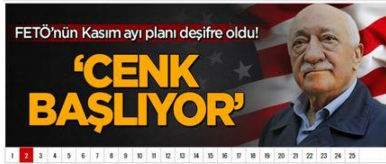
Resim-7 yeniakit.com.tr, 04.11.2016

4 Kasım 2016 tarihli Yeni Akit internet sitesi, 3 Kasım tarihinde Ensonhaber ve Haber 7 internet sitelerinde konu edilen FETÖ üyesi oldukları ve hapishaneden kaçma planı yaptıkları iddia edilen kişileri başlığa taşımıştır. Resim 7’de görüldüğü üzere başlıkta “FETÖ’nün Kasım ayı planı deşifre oldu! ‘Cenk Başlıyor’” şeklindeki yazıya yer vermiştir. Başlıkta FETÖ elebaşının resmi ve ABD bayrağı arka plan olarak kullanılmıştır. Bu başlığı incelediğimizde; Kasım ayı içinde kalkışma benzeri bir ihtimal ima edilmektedir. Oysa yukarıda da belirttiğimiz gibi haberin konusu hapishaneden firardır. Yeni Akit internet sitesinin haber başlığında, tıpkı Ensonhaber sitesinde olduğu gibi haberin içeriği yansıtılmamıştır.