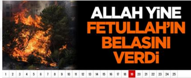
Resim-67

Bu başlıkta gerçeğin çarpıtılarak sunulduğu ve toplumun bu olay hakkında yanlış kanaat edinmesine zemin hazırladığı söylenebilir. Bu noktada haber başlığının doğruluk, tarafsızlık ve gerçeklik bağlamında etik ihlale olanak sağladığı görülmektedir. FETÖ’nün başına gelenlerle ilgili bilgi edinmek isteyen okuyucu haberi tıklayarak, İsrail’deki orman yangınının farklı bir bakış açısından sunumu ile karşılaşmaktadır. İçerikten bağımsız oluşturulan bu başlığın dezenformasyon niteliği taşıdığı söylenebilir.