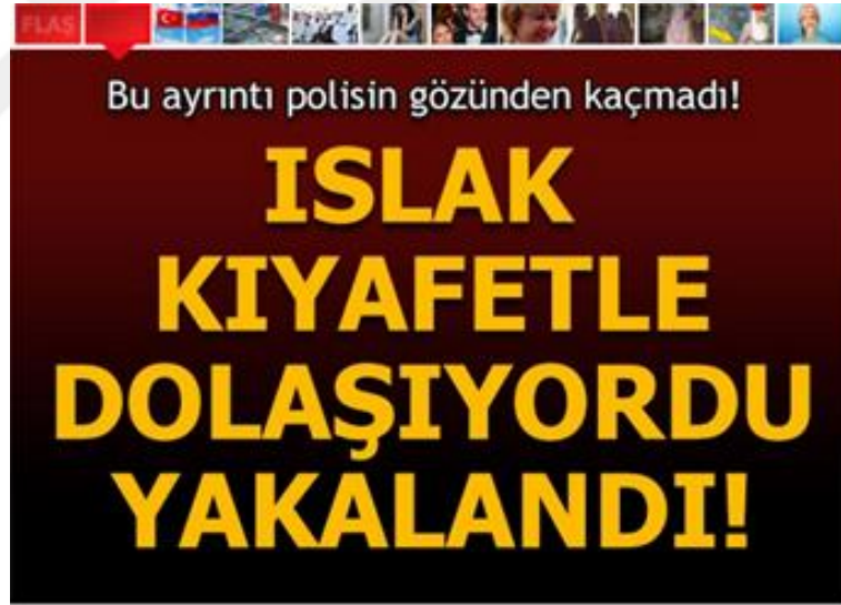
Resim-27 milliyet.com.tr, 10.11.2016

Milliyet.com.tr haber sitesinin 10 Kasım 2016 tarihli haber başlıklarından birinde “ Bu ayrıntı polisin gözünden kaçmadı! Islak kıyafetle dolaşıyordu yakalandı ” ifadesinin kullanılması haber içeriği ile başlığın birbirinden oldukça uzak bir ilişkiye sahip olduğunu göstermektedir. Resim 27’de verilen başlık tıklandığında ıslak kıyafetle dolaşan kişinin Midilli adasına kaçmak isterken bottan düşerek ıslanan sözde FETÖ imamı olduğu anlaşılmaktadır. Oysa, başlıkta bunu yansıtan yazılı veya görsel bilgiye rastlamak mümkün değildir.