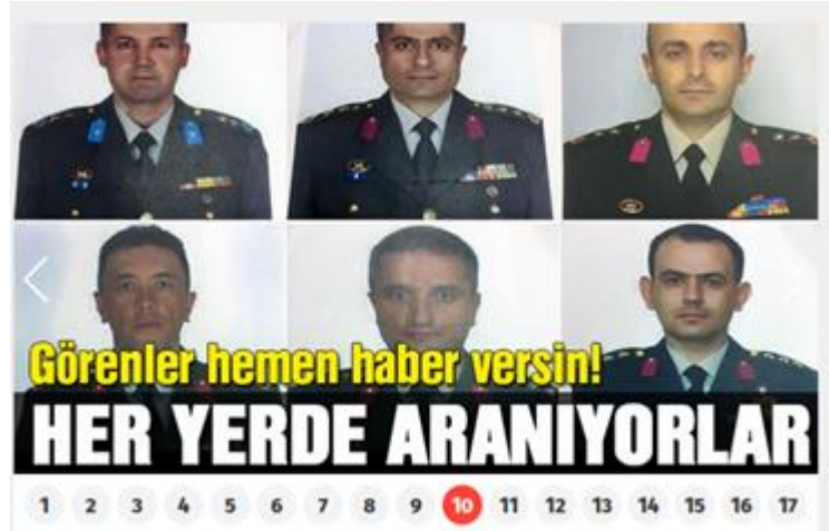
Resim-59 sozcu.com.tr, 21.11.2016

Sözcü gazetesi internet sitesinin başlığı ele alındığında; Milliyet'in aksine aranan kişilerin kimlikleri konusunda açıklayıcı bir başlık hazırlandığı görülmektedir (Bkz. Resim-59).