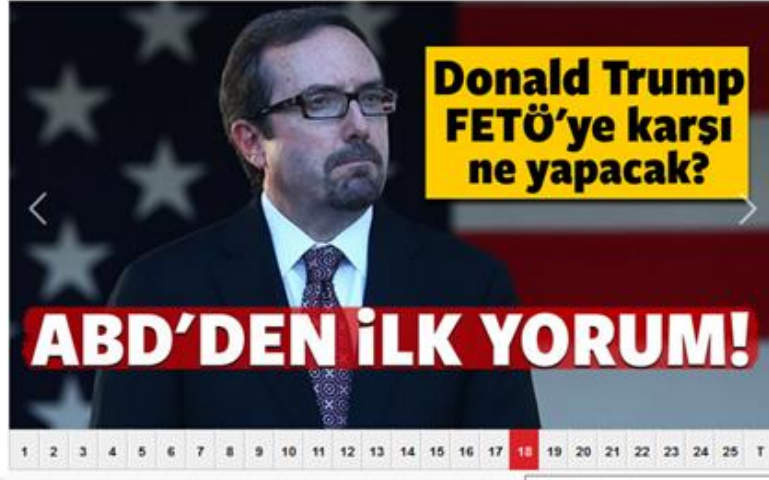
Resim-24 haber7.com, 09.11.2016

görüldüğü gibi, ABD Büyükelçisinin cevabının haber başlığındaki beklentiye cevap vermediği söylenebilir.