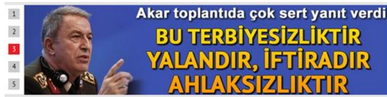
Resim-55 hurriyet.com.tr, 20.11.2016

20 Kasım 2016 Tarihli Hürriyet gazetesi internet sitesi de haberin başlığını Yeni Akit gazetesi internet sitesinde olduğu gibi içeriği yeterince yansıtmayacak biçimde hazırlamıştır. Resim 55'te Hürriyet gazetesinin fotoğraf karesi olarak Yeni Akit'le aynı fotoğrafı ve şekil olarak da neredeyse aynı tasarımı kullandığı görülmektedir. Yine bu başlık tasarımı için de, içeriği yansıtan bir enformasyona sahip olmadığı söylenebilir.