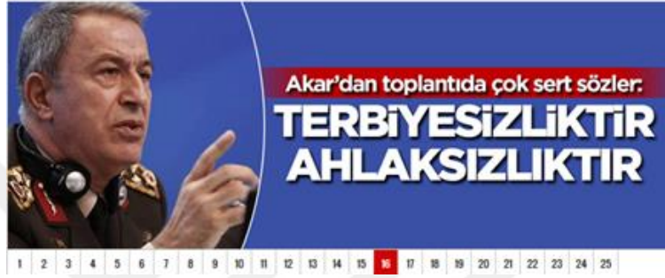
Resim-54 yeniakit.com.tr, 20.11.2016