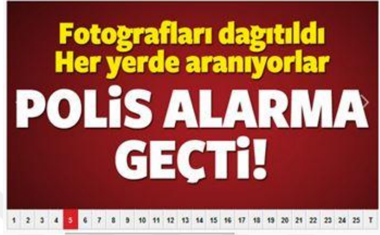
Resim-51 haber7.com, 19.11.2016

içeriği anlatmada son derece zayıf kalmaktadır. Haber başlığından polis tarafından aranan birileri olduğu anlaşılakta, fakat bu kişilerin ne türden suçlular olduğu, neden arandığı gibi bilgilere yer verilmemektedir. Bu sebeple başlığın yeterli enformasyona sahip olmadığı söylenebilir.