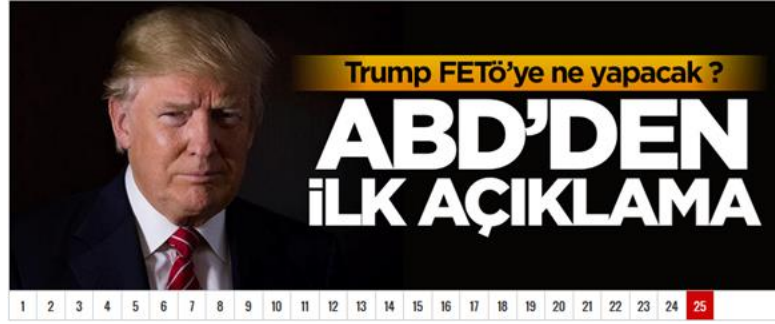
Resim-26 yeniakit.com.tr, 09.11.2016

Milliyet.com.tr haber sitesinin 10 Kasım 2016 tarihli haber başlıklarından birinde “ Bu ayrıntı polisin gözünden kaçmadı! Islak kıyafetle dolaşıyordu yakalandı ” ifadesinin kullanılması haber içeriği ile başlığın birbirinden oldukça uzak bir ilişkiye sahip olduğunu göstermektedir. Resim 27’de verilen başlık tıklandığında ıslak kıyafetle dolaşan kişinin Midilli adasına kaçmak isterken bottan düşerek ıslanan sözde FETÖ imamı olduğu anlaşılmaktadır. Oysa, başlıkta bunu yansıtan yazılı veya görsel bilgiye rastlamak mümkün değildir.