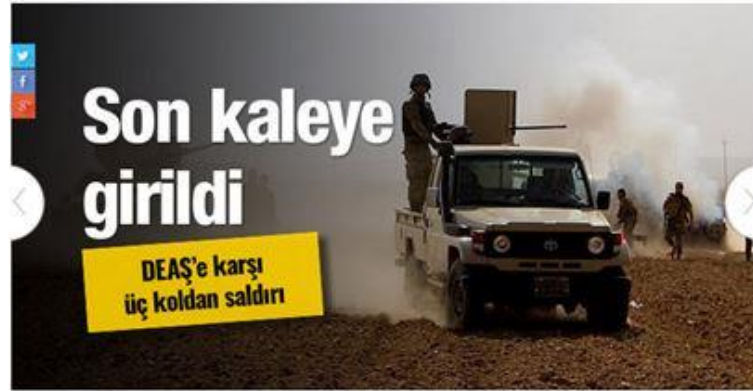
Resim-9 internethaber.com, 05.11.2016

Haber 7 internet sitesinin bu başlığına karşın, aynı gün İnternethaber internet sitesi haber başlığında hem terör örgütünün ismini vermiş, hem de kullandığı fotoğrafla yazıyı destekleyerek haberin konusu hakkında okuyucuya bilgi sağlamıştır. ( Bkz. Resim-9)