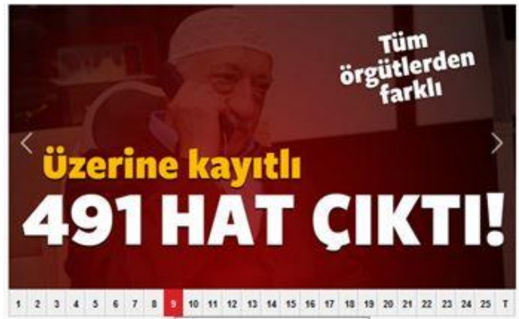
Resim-39 haber7.com, 16.11.2016