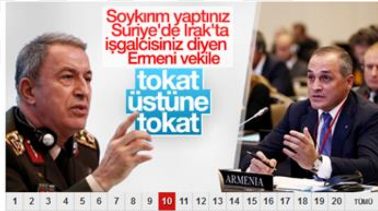
Resim-57 ensonhaber.com, 20.11.2016

Tıpkı Yeni Şafak internet sitesi gibi Ensonhaber internet sitesi de bu haberin başlığını içeriğe uygun bir şekilde okuyucuya yansıtmiş ve görseli de haber retoriği ile uyumlu bir şekilde kullanmaktadır. ( Bkz. Resim-57)