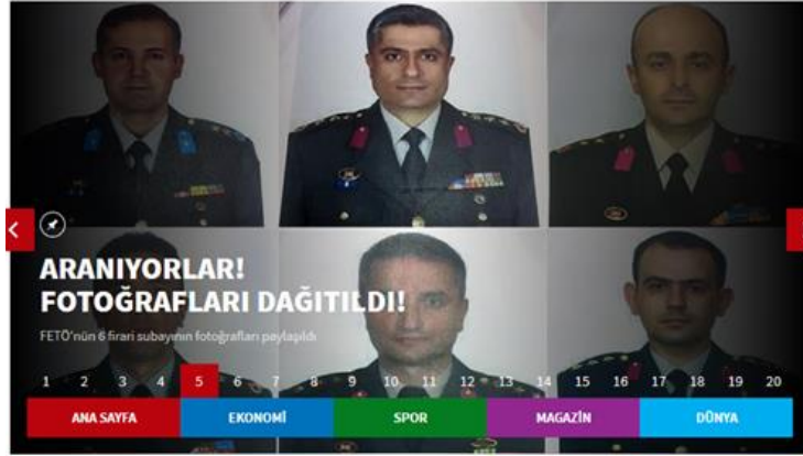
Resim-60 haberturk.com, 21.11.2016

22 Kasım 2016 tarihli haberler içinde yer alan bir haber futbol dünyasında uzun süre yöneticilik yapmış bir iş adamının FETÖ suçlamasıyla arandığıyla ilgilidir. Bu haber İnternethaber sitesinde “Ünlü İşadamına FETÖ Şoku” başlığıyla yayınlanmıştır. Resim 61’de yer alan İnternethaber’deki başlık incelendiğinde; beyaz zemin üzerine siyah kalın harfler kullanıldığı görülmektedir. Başlıkta yazıyla birlikte hiçbir görsel malzeme kullanılmamıştır. Haberin başlığından sadece aranan bir iş adamı olduğu anlaşılmaktadır. Fakat iş adamının kim olduğu noktasında herhangi bir ipucu bulunmadığı için merak duygusuna ve dolayısıyla tıklamaya hizmet ettiği görülmektedir.