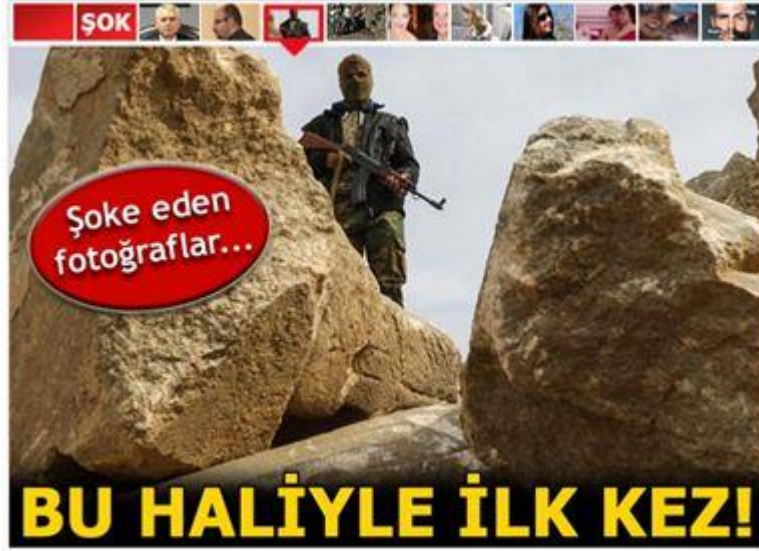
Resim-38 milliyet.com.tr, 16.11.2016