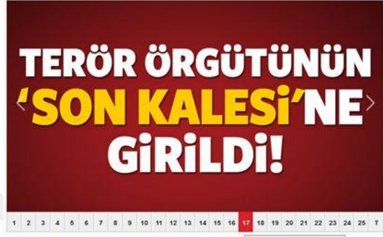
Resim-8 haber7.com, 05.11.2016

olduğunu tahmin etmek oldukça zordur. Tıklanarak haberin gerçek içeriğine ulaşıldığında ise; Irak devlet güçlerinin Musul kentinde DEAŞ terör örgütünün elinde bulunan son bölgeyi ele geçirdiği anlaşılmaktadır. Kullanılan başlıkla haberin içeriğinin tam olarak yansıtılmadığı görülmektedir.