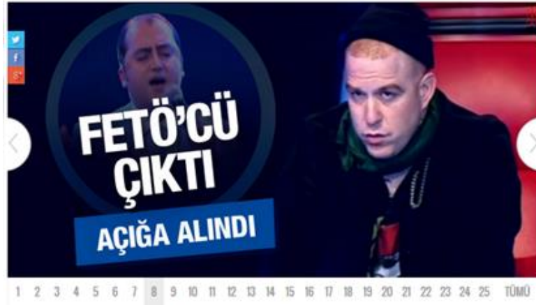
Resim-18 internethaber.com, 08.11.2016

Yine 8 Kasım 2016 tarihli Sabah internet sitesinde yer alan “İlk belirlemelere göre öldürülen... TSK’dan Hava Harekâtı” yazısıyla verilen haber başlığı haberin içeriğini kısmen yansıtmakla birlikte arka planda kullanılan görselin hava harekâtı cümlesini karşılamaktan uzak olduğu görülmektedir. Resim 19’da verilen başlık görselini incelediğimizde, bu tarz haberlerde genellikle kullanılan jet uçağı görselinin