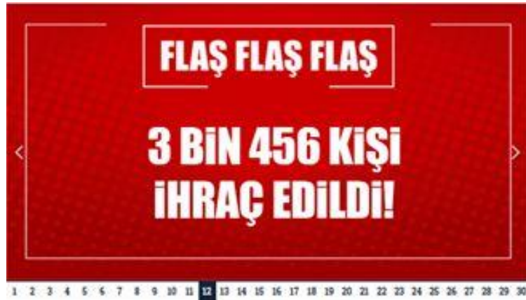
Resim-33 sabah.com.tr, 14.11.2016

14 Kasım 2016 tarihli haber başlıklarına baktığımızda Sabah gazetesi internet sitesinde yer alan bir başlığın haberin içeriğini yeterince yansıtmadığı görülmektedir. . “ FLAŞ FLAŞ FLAŞ 3 Bin 456 Kişi İhraç Edildi ” yazısı ile kırmızı fon üzerinde hazırlanan haber başlından anlaşılan tek şey, kaç kişinin ihraç edilmiş olduğudur. İhraç edilenlerin kim oldukları ve hangi suç bağlamında ihraç edildikleri hakkında bilgi verilmeyerek haberin kapsamı son derece geniş tutulmuştur. Resim 33'te başlığını verdiğimiz haberin içeriğine baktığımızda ihraç edilen kişilerin hâkim ve savcılar olduğunu anlamaktayız.