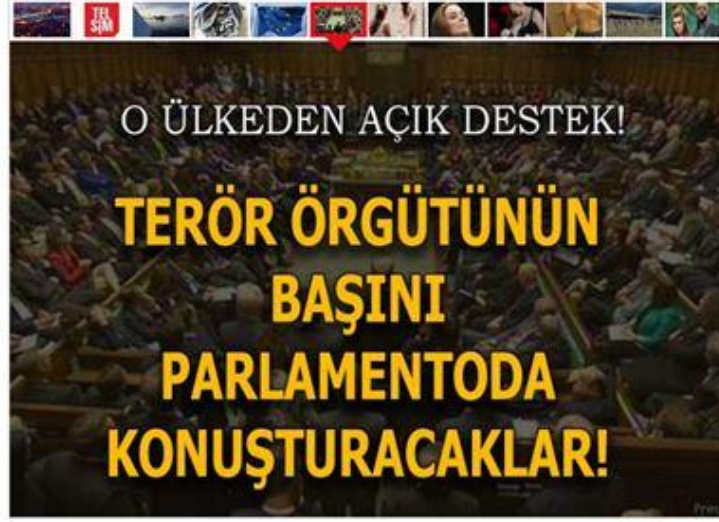
Resim-43 milliyet.com.tr, 17.11.2016