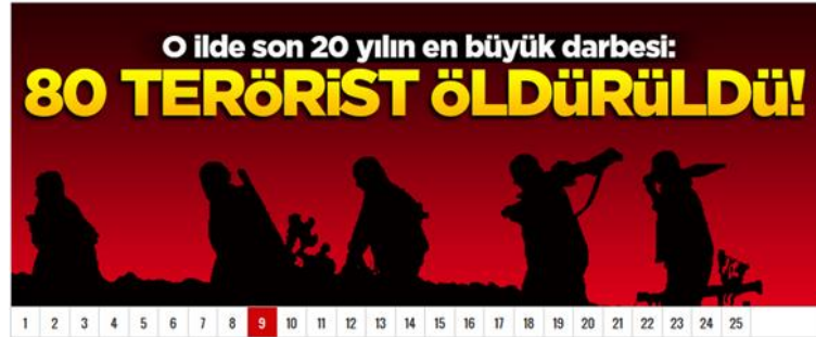
Resim-20 yeniakit.com.tr, 08.11.2016

8 Kasım 2016 tarihinde Yeni Akit internet sitesinde yer alan "O ilde son 20 yılın en büyük darbesi: 80 Terörist Öldürüldü" yazısıyla verilen başlıkta haberin içeriğinin çarpıtıldığı söylenebilir. Gerçekte öldürülen 80 terörist son 6 ayın toplam sayısını vermektedir. Oysa haber başlığında bunu açıklayan bir ifade yer almamaktadır. Okuyucu 80 teröristin tek bir saldırıda öldürüldüğü düşüncesine kapılabilir. (Bkz. Resim-20)