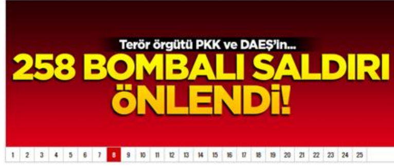
Resim-64 yeniakit.com.tr, 23.11.2016

25 Kasım 2016 tarihinde Bitlis Belediyesi Eş Başkanlarının tutuklanması Sabah internet sitesinde “ Başkanlar Tutuklandı ” yazısı ve adaleti simgeleyen mahkeme tokmağı görseli ile birlikte başlığa taşınmıştır.(Bkz. Resim 65) Temelde haber içeriği ile başlık arasında önemli bir farklılık bulunmamakla birlikte haberin kapsamının çok geniş tutulduğu, dolayısıyla başlığın tık haberciliğine hizmet ettiği görülmektedir. Başkanlar tutuklanmıştır, fakat bunların hangi kurumun başkanları olduğu açıklanmamaktadır. Başlığın kapsamının çok geniş tutulması haber başlığına bir muğlaklık katmaktadır. Haberin retoriğinin içerikten ziyade görselle güçlendirilmeye çalışıldığı söylenebilir. Aynı başlık Yeni akit gazetesi internet sitesinde ise “ Bitlis Belediye Başkanı Tutuklandı ” başlığı ile verilmiştir. (Bkz. Resim-66) Sabah gazetesi internet sitesindeki bilinmeyen başkan ile buradaki Bitlis Belediye Başkanı arasında sınırlılık bakımından devasa bir farklılık bulunmaktadır. Sabah gazetesi sitesindeki Başkan sınırları belirsiz bir başkandır. Bu bağlamda bu başlık kullanımı ile okuyucunun yeterli enfomasyona ulaşamadığı belirtilebilir.