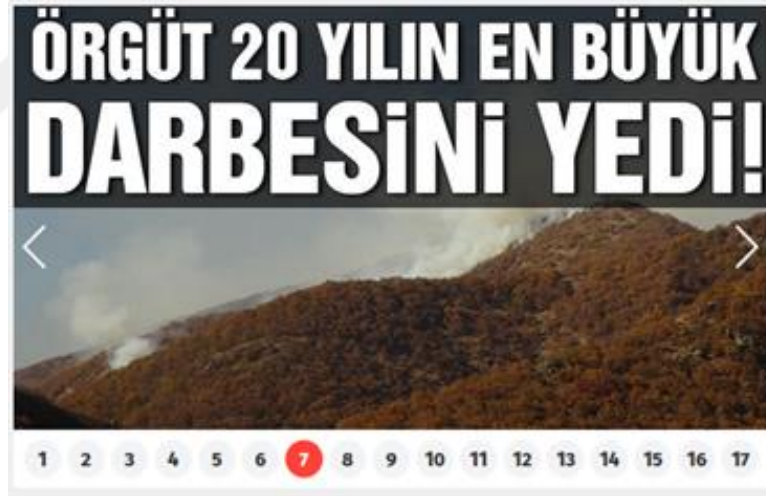
Resim-22

Yeni Akit ve Sabah internet sitelerinde olduğu gibi bu haber Sözcü internet sitesinde de verilmiştir. Üstelik Sabah'ta yer alan görselin aynısı kullanılmıştır. Bu durum haberin ajans kaynaklı olma ihtimalini güçlendirmektedir. Resim 22'den yola çıkarak Sözcü'de kullanılan başlığın PKK kelimesi yerine Örgüt kullanılması dışında Sabah'takiyle aynı olduğu görülmektedir. Buradaki içerik yansıtma sorunu yukarıda Sabah internet sitesinde anlatılan sorunla aynıdır.