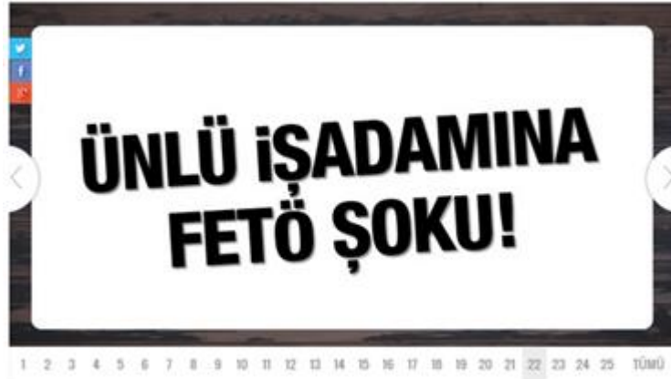
Resim-61 internethaber.com, 22.11.2016

22 Kasım 2016 tarihli haberler içinde yer alan bir haber futbol dünyasında uzun süre yöneticilik yapmış bir iş adamının FETÖ suçlamasıyla arandığıyla ilgilidir. Bu haber İnternethaber sitesinde “Ünlü İşadamına FETÖ Şoku” başlığıyla yayınlanmıştır. Resim 61’de yer alan İnternethaber’deki başlık incelendiğinde; beyaz zemin üzerine siyah kalın harfler kullanıldığı görülmektedir. Başlıkta yazıyla birlikte hiçbir görsel malzeme kullanılmamıştır. Haberin başlığından sadece aranan bir iş adamı olduğu anlaşılmaktadır. Fakat iş adamının kim olduğu noktasında herhangi bir ipucu bulunmadığı için merak duygusuna ve dolayısıyla tıklamaya hizmet ettiği görülmektedir.