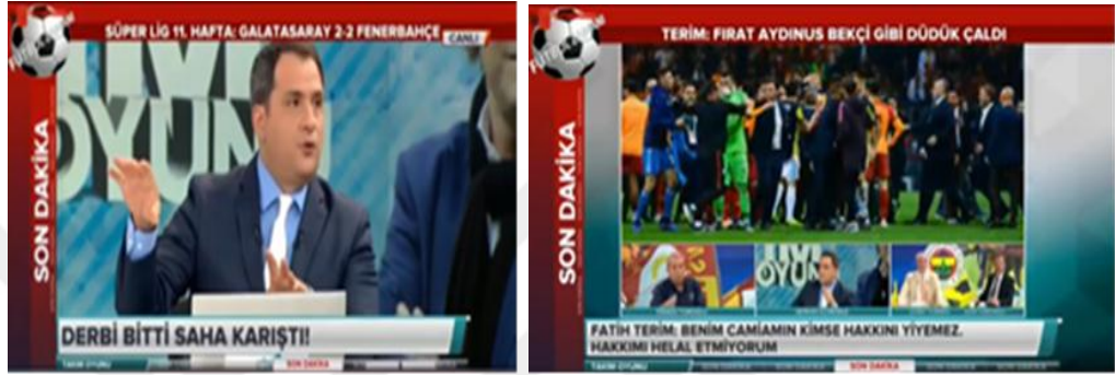
Resim 7: Galatasaray ve Fenerbahçe Derbisinde Yaşanan Kavga Görüntüleri Son Dakika Olarak Ekranda Gösterilmesi