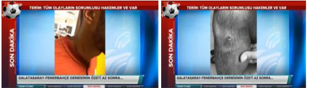
Resim 9: Takım Oyunu Programında, Galatasaray ve Fenerbahçe Derbisinde Yaşanan Şiddet Olaylarında Yaralanan Futbolcuların Fotoğraflarının Ekranda Gösterilmesi