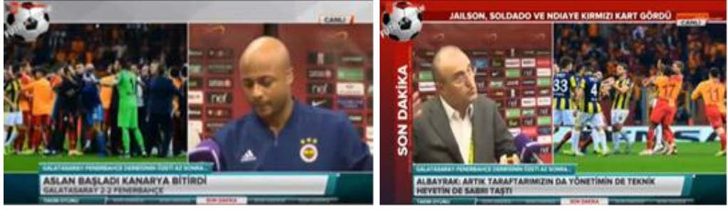
Resim 8: Takım Oyunu Programında Galatasaray ve Fenerbahçe Derbisinden Sonra Yöneticilerin ve Futbolcuların Sert Açıklamalarına Yer Verilmesi