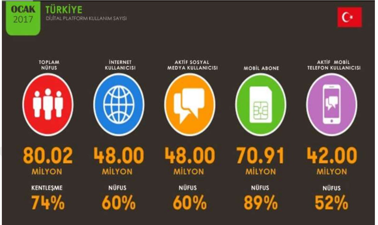
Grafik-2 Türkiye’de internet ve sosyal medyanın son durumu (2017) 148

Bu kadar yoğun kullanıldığı görülen ve sosyal medya sitelerinin yaygın olmasının insanların yalnızca içerik oluşturarak, paylaştığı ve dijital anlamda sosyalleştiği mecralar şeklinde yorumlamak yetersiz olacaktır. Facebook gibi paylaşım sitelerin küresel olarak bu kadar yaygın bir ağ olmasının yalnızca bir iletişim yöntemi şeklinde değerlendirilemeyeceğini söylemek gerekir. Bu bakımdan sosyal medya sitelerinin yalnızca sosyal ilişki yapılarını etkilemediği, bu ağları kullananların sayılarının yüksek olmasından dolayı ekonomik olarak önemli potansiyelleri vardır. 149 Bu anlamda sosyal medyanın psikolojik etkilerine de bakmak gerekmektedir.