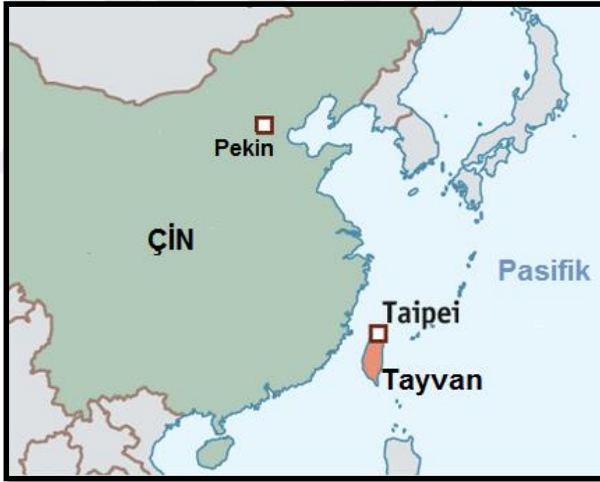
Şekil 4. Çin-Tayvan Sorunu (Nalçacı, 2020)

Bunun sonucunda uluslararası arenada Tayvan, Çin'in bir eyaleti olarak sayılmıştır. Ancak Çin ve Tayvan arasında birbirlerinin haklarını ihlal ve temsilcilik gibi krizler büyüyerek zaman içerisinde çatışmalara neden olmuştur. Müdahaleci ve yayılmacı dış ülkelerin stratejileri kapsamında müdahaleleri krizi daha da hassaslaştırmıştır.