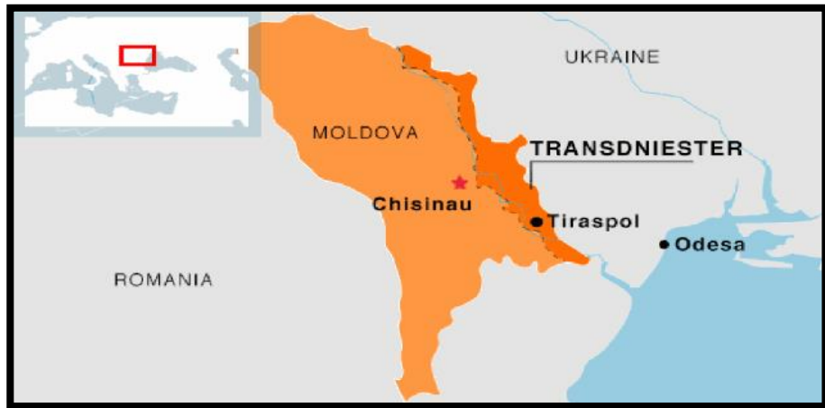
Şekil 9. Transdinyester Sorunu

Transdinyester bölgesi, Rusya ile Moldova arasında dondurulmuş çatışma olarak görülmektedir. Moldova'nın Sovyetler Birliğinden ayrımından sonra, Moldova odağını Batıya çevirdiğinden Rusya bunu bir tehdit olarak algılamış, Moldova ve Romanya'nın ittifakını engellemek amacı ile bu bölgede ki ayrılıkçı grupları kışkırtmaya başlamışlardır. Bu ayrılıkçı hareketler neticesinde bölgede iç karışıklık yaşanmış ve çatışmalar meydana gelmiştir. Bu çatışmalar sonucunda; bu bölgede Rusya ve Moldova'nın ortak gözetim yetkisi olan Ortak Kontrol Komisyonu kurulmuştur. Transdinyester bölgesi kendi için 2006 yılında referanduma giderek bağımsızlık ilan etmiştir ancak bu bağımsızlık kendisi dışında hiçbir ülke tarafından kabul edilmemiştir.