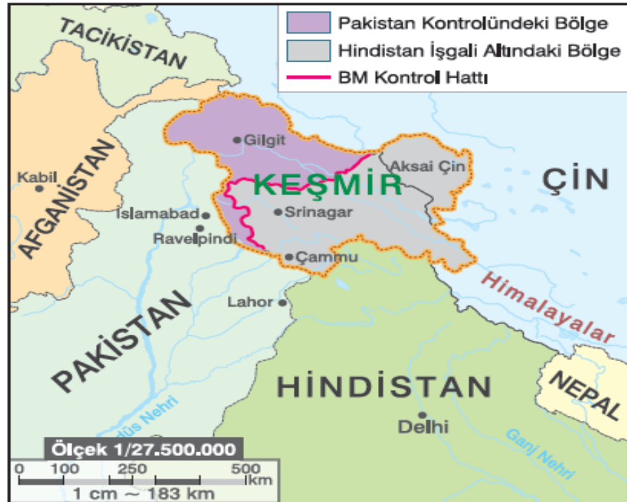
Şekil 3. Keşmir Sorunu

Müslümanların çoğunlukta olduğu bölgeler Pakistan'a, Hindu'nun yoğun olduğu yer Hindistan'a bırakılmıştır. Keşmir bölgesinde yaşayan nüfusun büyük bir kısmı İslam dinine mensuptu. Keşmir bölgesinin Hindistan'a mı yoksa Pakistan'a mı ait olacağı halkın tercihine bırakılması önerildi. Keşmiş halkı Müslüman tabanın ağırlıklı olduğu Pakistan'a bağlanmak isterken, Keşmir prensi Keşmir'in Hindistan'a bağlanmasına karar vermiştir. İki ülke arasında yıllardır süregelen bu sorun iki ülkenin de nükleer güce sahip olması nedeni ile daha tehlikeli bir kriz haline dönüştürmüştür.