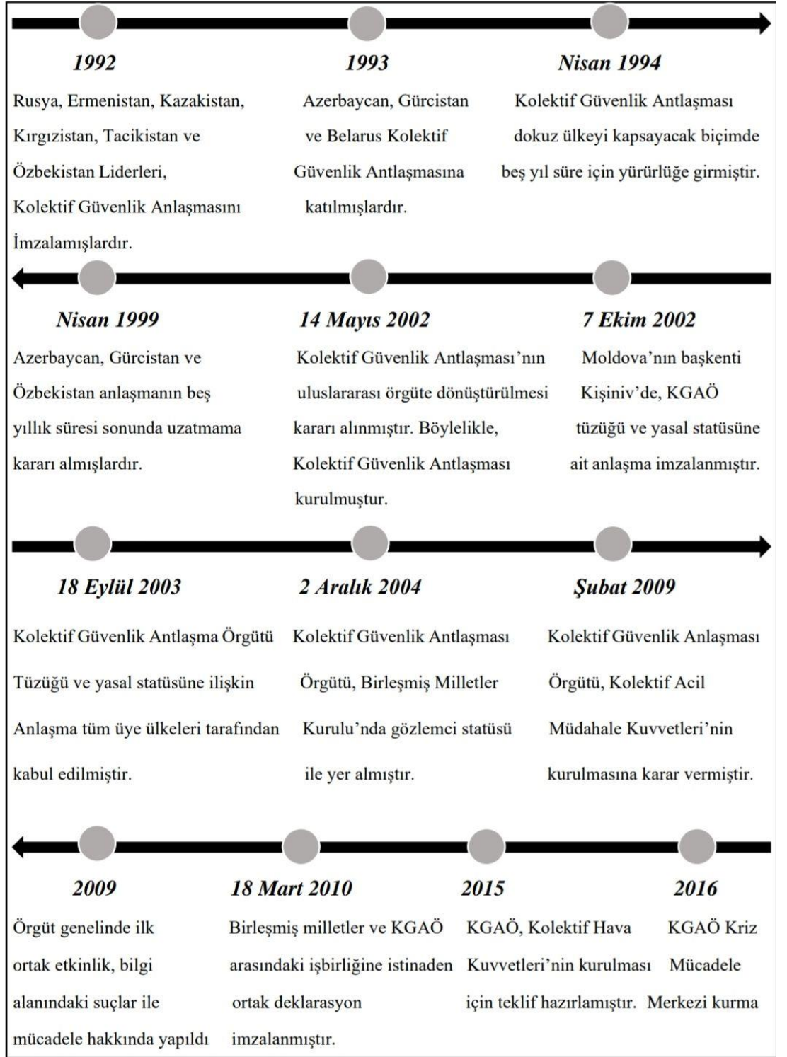
Şekil 2. Kolektif Güvenlik Antlaşması Örgütü Kısa Tarihçesi (Yalçınkaya, Tuğlu, 2019: 111-112)