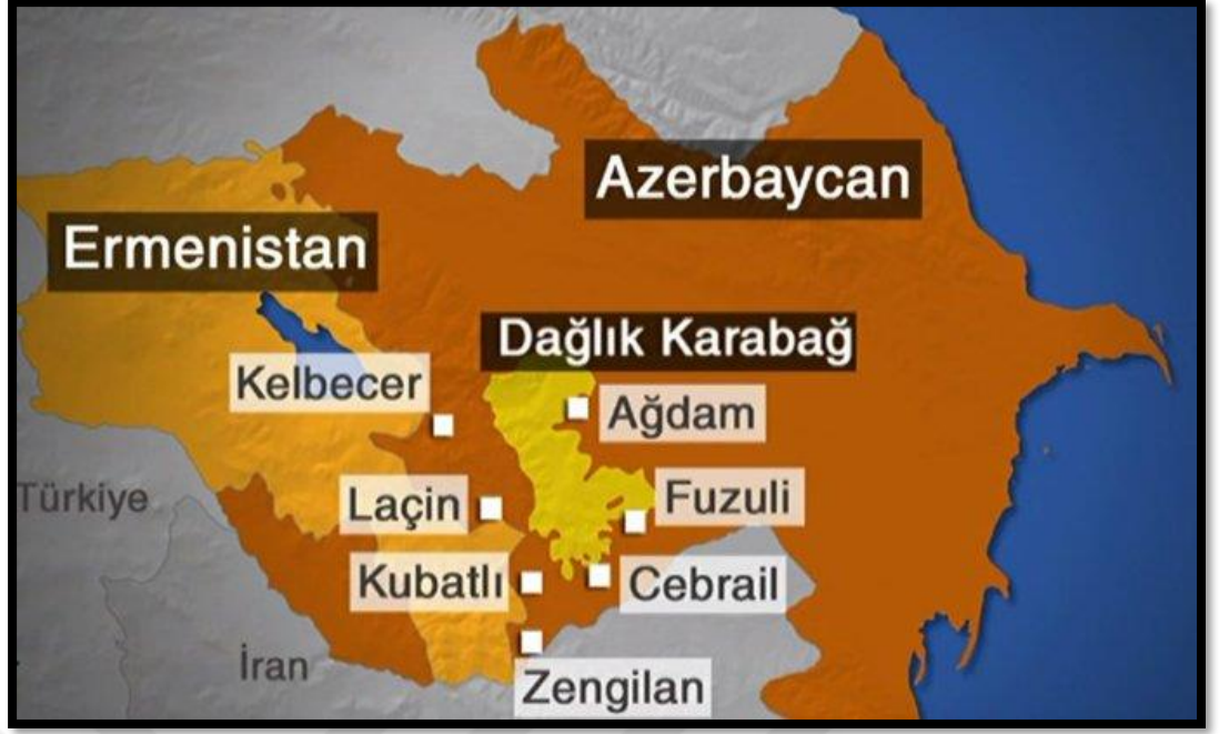
Şekil 10. Dağlık Karabağ Bölgesi (Dağlık Karabağ Çatışması Ana Hatları, 2020)

Dağlık Karabağ bölgesi çok önemli stratejik konuma sahiptir. Dağlık Karabağ bölgesinin verimli arazilerde bulunması, bu bölgenin Azerbaycan, Ermenistan ve İran topraklarına yakın mesafede olmasının getirdiği jeopolitik konum bu alanı son derece önemli kılmaktadır. Bundan kaynaklı Dağlık Karabağ bölgesi, ülkelere avantaj getirmektedir.