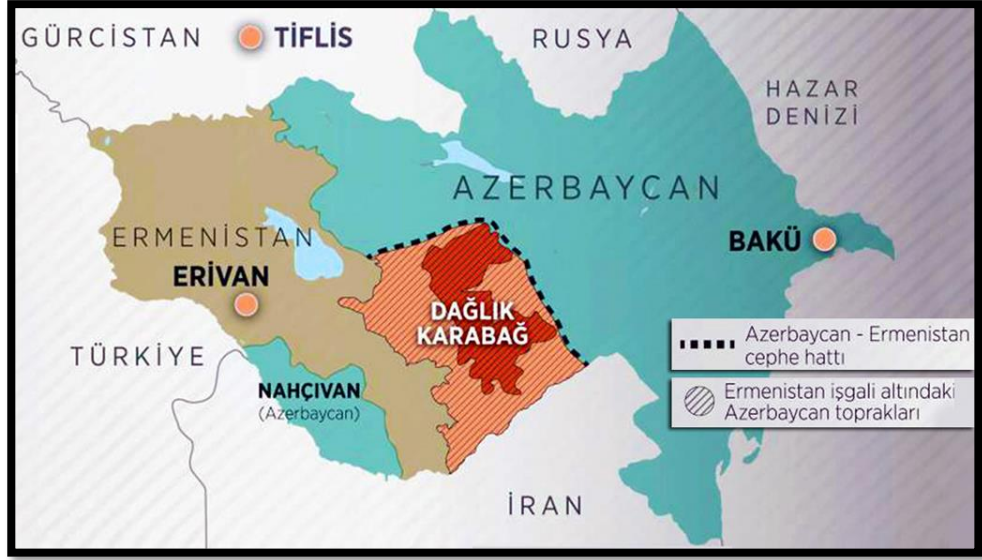
Şekil 6. Dağlık-Karabağ Bölgesi (Güler, 2020)