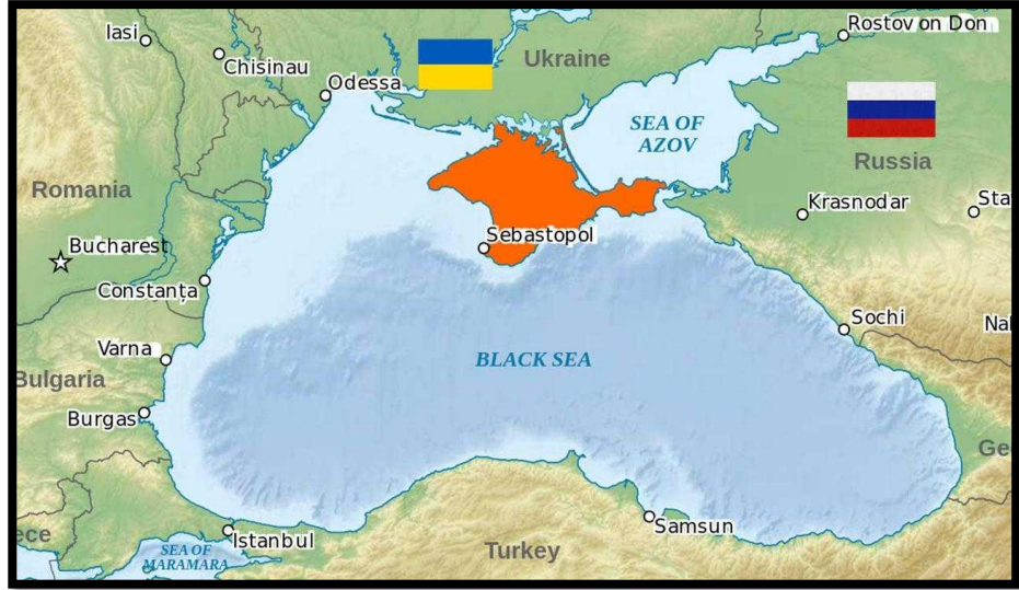
Şekil 7. Kırım Sorunu (Petek, 2020)