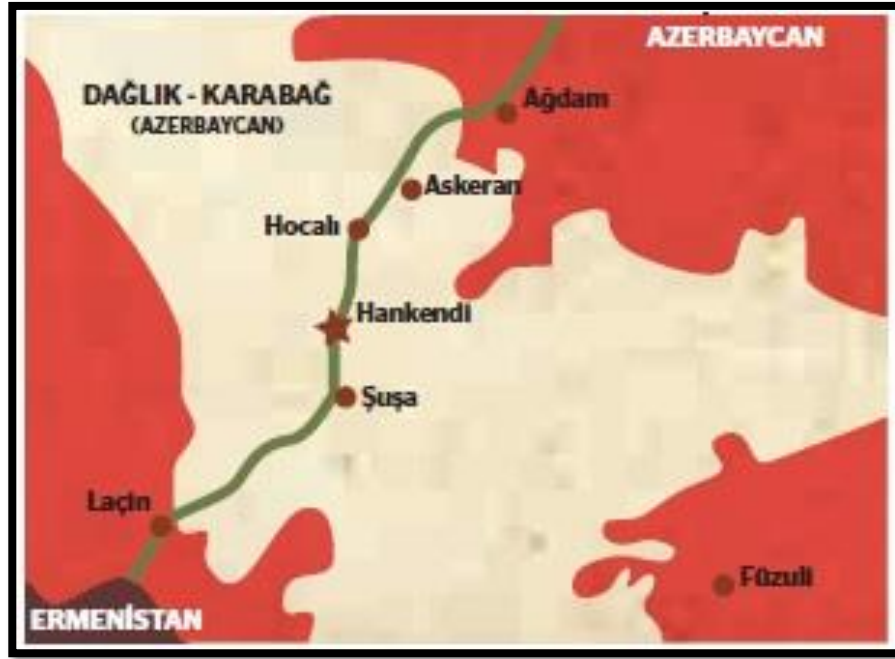
Şekil 11. Hocalı Bölgesi (Kavak, 2019)

Türkleri yaşamaktadır. Bölge aynı zamanda alanın tek havaalanı bulunan şehri konumundaydı. Aşağıda Hocalı bölgesinin haritasını gösterilmektedir;