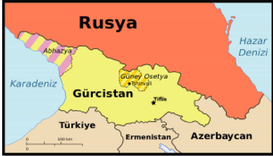
Şekil 8. Güney Osetya ve Abhazya Sorunu (Alemdar, 2019)