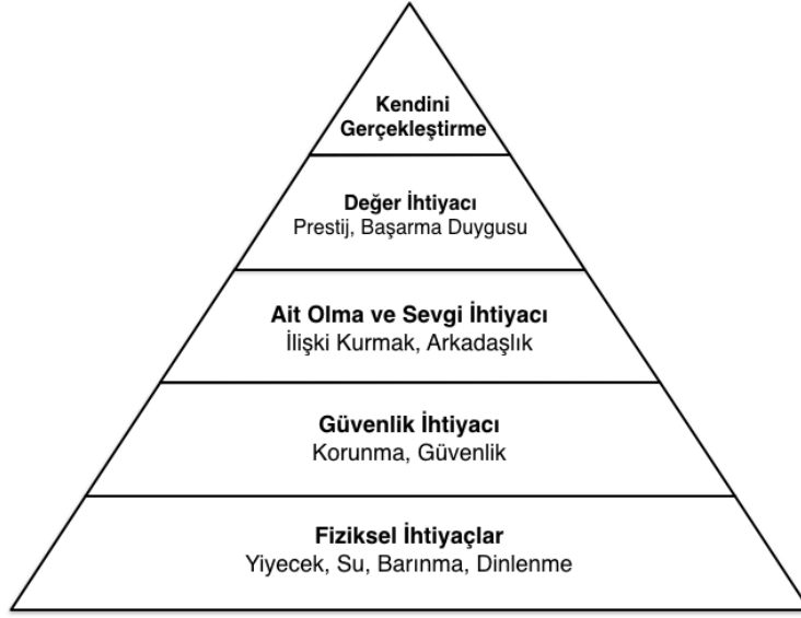
Şekil 1. Maslow İhtiyaçlar Hiyerarşisi ( 'Maslow İhtiyaçlar Hiyerarşisi' , 2021.)

Maslow, bireyin kendini gerçekleştirebilmesi için çocukluk zamanlarında yeterli sevgi ve ilk yıllarında fizyolojik ve güvenlik ihtiyaçlarının karşılanması gerektiğini düşünmüştür (Schultz, Schultz, 2020: 674).