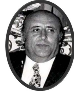
2. Parti: Süleyman Demirel, AP

2 Mart 1971'deki müdahalesi İnönü'nün parti genel sekreteri Bülent Ecevit'le anlaşmazlığa düşmesine ve Ecevit'e genel başkanlığa giden yolun açılmasına olanak vermişti. Ecevit'le yoğun bir mücadeleye giren İnönü, Mayıs 1972'de toplanan V. Olağanüstü Kurultay'da, politikasının partisince onaylanmaması durumunda istifa edeceğini açıkladı. Kurultayda parti meclisi Ecevit'in yanında yer alınca da 8 Mayıs 1972'de CHP genel başkanlığından ayrıldı. Türk siyasal yaşamında parti içi mücadele sonucunda değişen ilk genel başkan olan İnönü 4 Kasım 1972'de CHP üyeliğinden, 14 Kasım 1972'de de milletvekilliğinden istifa etti. Başvurusu üzerine tabii senatör olarak Cumhuriyet Senatosu'nda görev aldı.