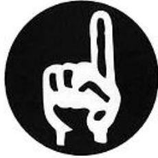
Millî Nizam Partisi'nin amblemi