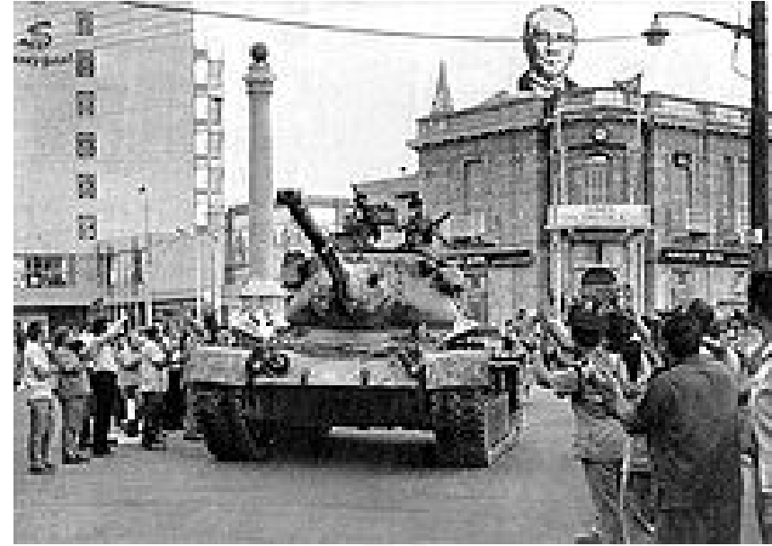
TSK'ya ait M-47 Tank, Başkent Lefkoşa'da bulunan Sarayönü Meydanı'na giriyor.