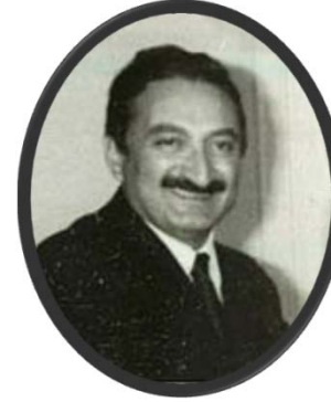
1. Parti: Bülent Ecevit, CHP