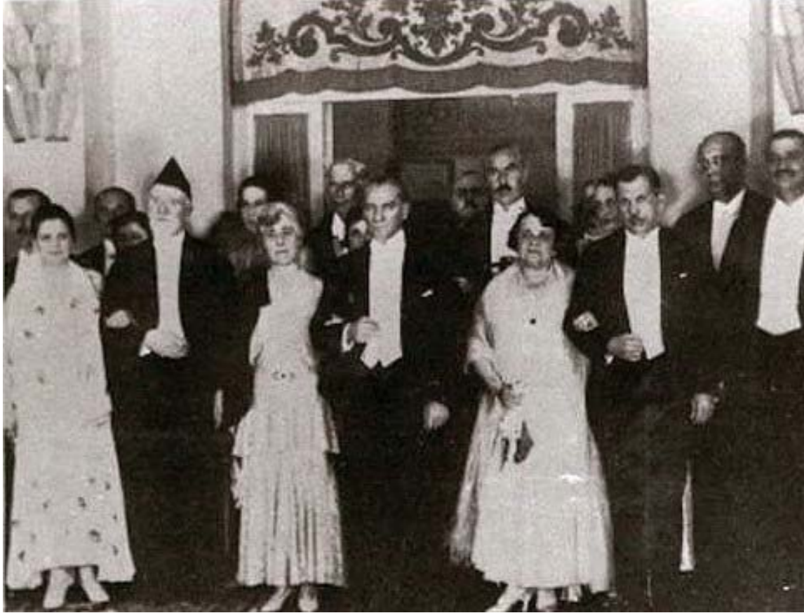
Atatürk ve Yunanistan Başbakanı Venizelos (solda) Ankara, Ekim 1932