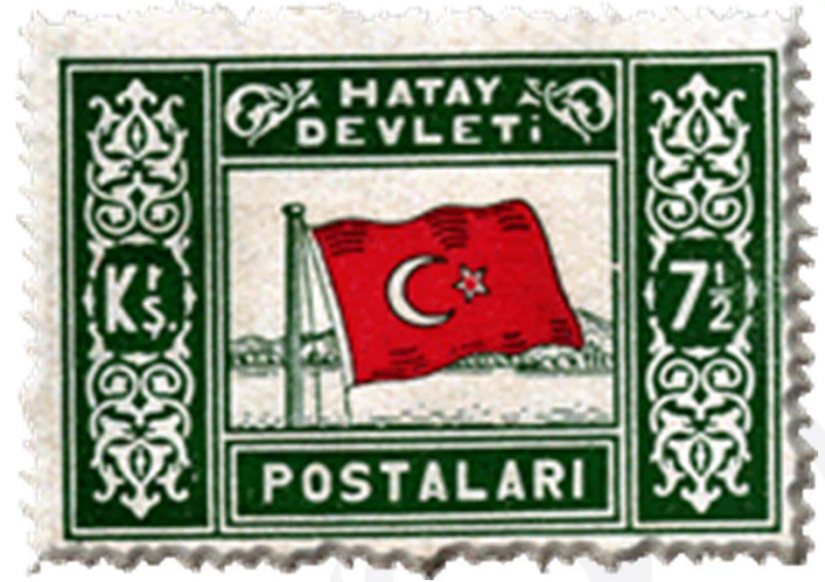
Hatay Devleti pulu