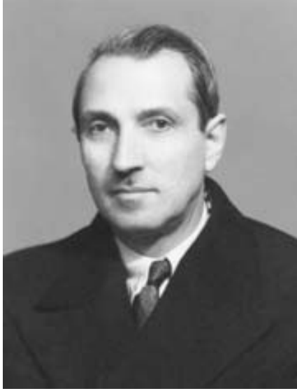
Bağımsız Hatay Devleti Cumhurbaşkanı Tayfur Sökmen