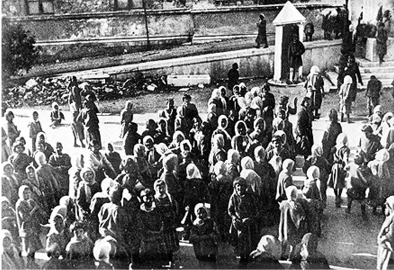
Mübadeleyle tabi tutulan Müslüman mültecilerin bir kısmı