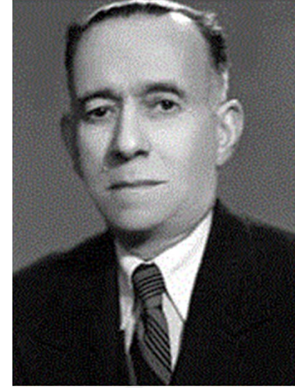
Meclis Başkanı Abdülgani Türkmen