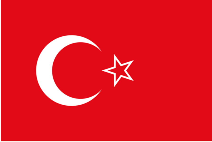
Bağımsız Hatay Devleti bayrağı