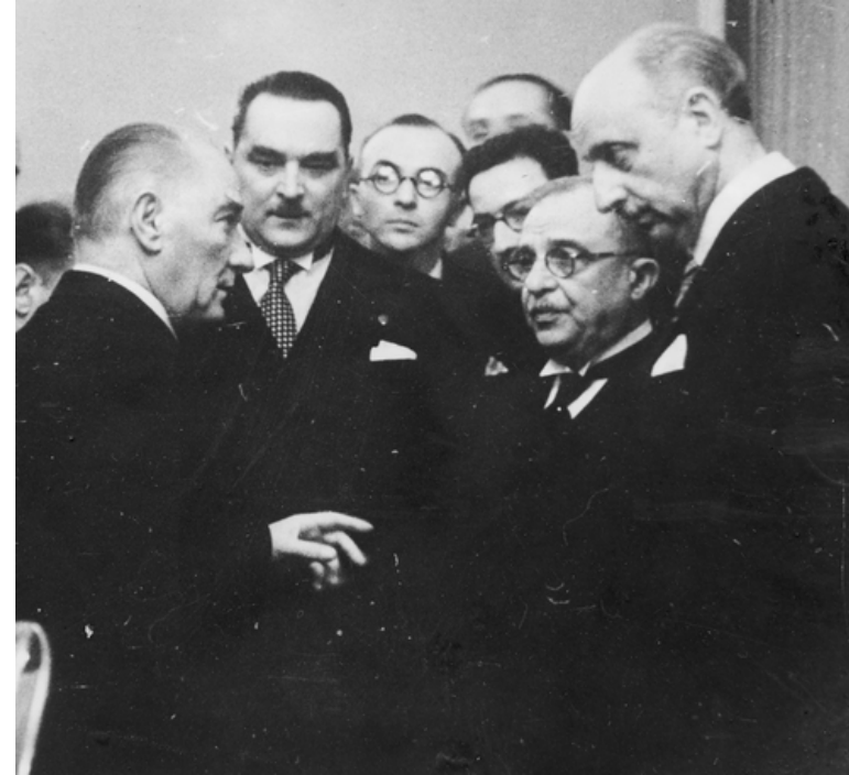
Atatürk 1938'de Ankara'da toplanan Balkan Antantı zirvesine konuk ettiği Yugoslavya başbakanı Milan Stojadinović, Yunanistan başbakanı Ioannis Metaksas ve Rumen diplomat Nicolae Petrescu-Comnen ile konuşuyor