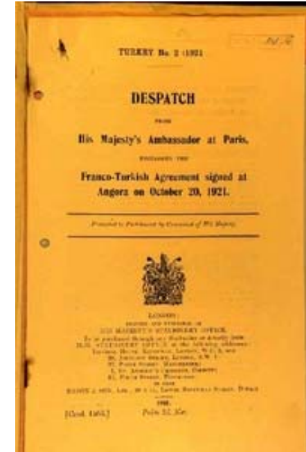
1921 Ankara Anlaşması