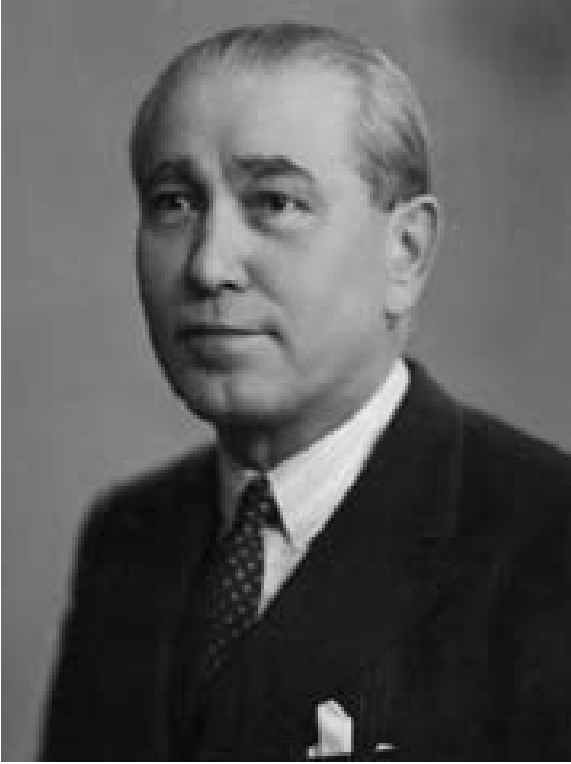
Ali Fethi Okyar