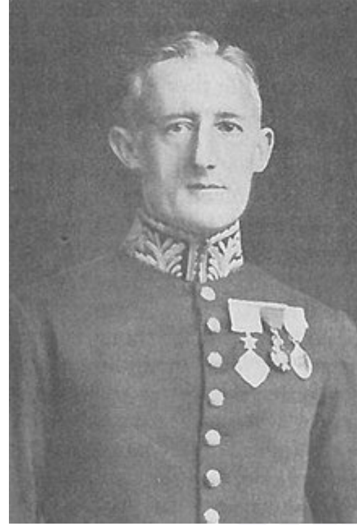
Sir Percy Zachariah Cox