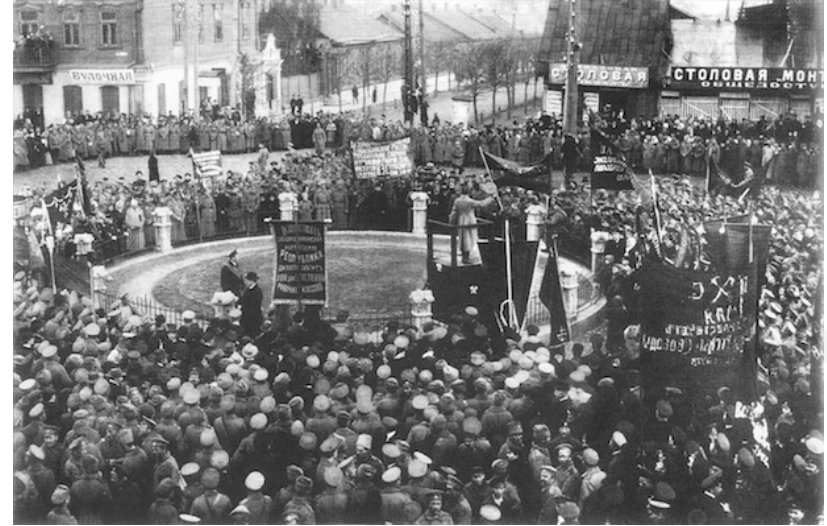
Rus Ekim 1917 Devrimini gösteren iki resim