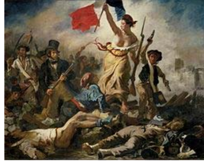
Fransız Devrimini resmeden bir çalışma