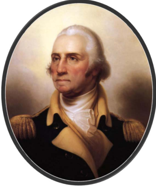
George Washington, Amerika Birleşik Devletlerinin Kurucusu