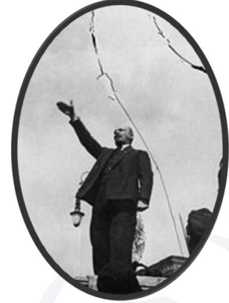
Vladimir Lenin, Sovyet Rusya'nın Kurucusu