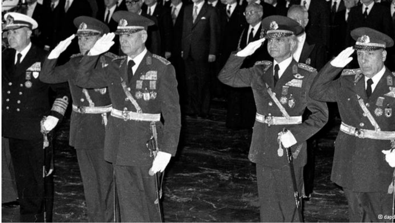
Genelkurmay Başkanı Org. Kenan Evren, Kara Kuvvetleri Komutanı Org. Nurettin Ersin, Hava Kuvvetleri Komutanı Org. Tahsin Şahinkaya, Deniz Kuvvetleri Komutanı Ora. Nejat Tümer ve Org. Jandarma Genel Komutanı Sedat Celasun